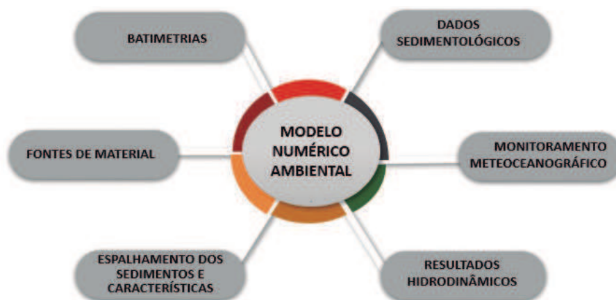
Figura 3 – Ferramentas de uso para modelagem hidrossedimentológica

a viscosidade. Com relação aos parâmetros físicos, a espessura da camada e a sua densidade, consideradas constantes em todo o domínio do modelo, se faz necessária a realização de testes de sensibilidade para avaliação dos resultados obtidos.