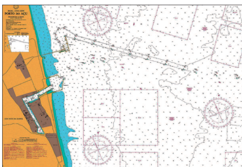
Figura 1 – Porto do Açu – Terminais T1 e T2. (Marinha do Brasil, 2021)

Nesse respectivo trecho, de cerca de 1,0 km 2 de área, as campanhas de batimetria em dupla frequência, consubstanciado por iniciativas de coleta e análise de material do leito marinho, indicam a possível existência de uma camada de material fluido (lama fluida) imediatamente após o perfil batimétrico de 200 kHz, o que desperta ainda mais interesse de estudo desse material.