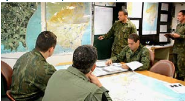
Figura 5: Sala de Planejamento - PC ForDbq.