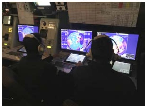
Figura 8: Centro de Operações de Combate do Navio, com seus consoles táticos em operação.

Possui um moderno Sistema de Combate, composto de 7 consoles, que gerencia o radar Artisan 3D 997 (apresenta marcação, distância e altitude da aeronave, com alcance nominal de 120 MN), o radar secundário IFF, o sistema automático de identificação de aeronaves ADS-B (fornece dados de registro e de voo da aviação comercial) e o radar de aproximação de aeronaves 1007 (alcance nominal de 15MN).