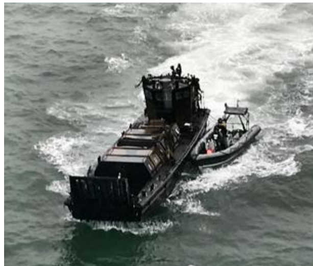
Figura 18: EDVP (LCVP Mk 5).

SIC2CFN, além de prover comunicações seguras, permitirá a troca de dados táticos, por meio de sistemas de enlace, conferindo maior versatilidade e flexibilidade no Controle do Movimento Navio-Terra.