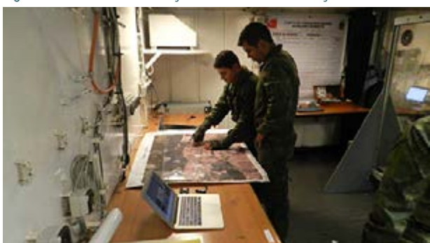
Figura 6: Centro de Informações de Combate da Força Embarcada.