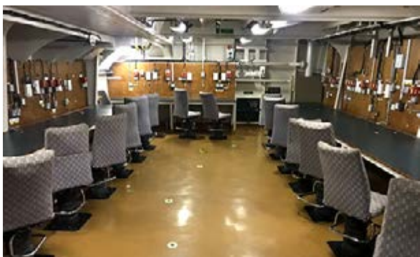
Figura 17: Centro de Operações do Comando Conjunto (Convés 3).