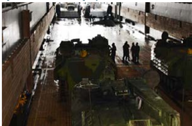
Figura 3: Convés Doca - Configuração Mista - CLAnf e EDVM.