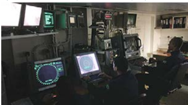
Figura 7: Centro de Informações de Combate - Operações Anfíbias.