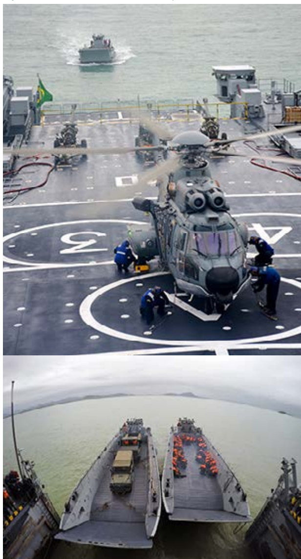
Figura 1 e 2: Conectores de Desembarque.