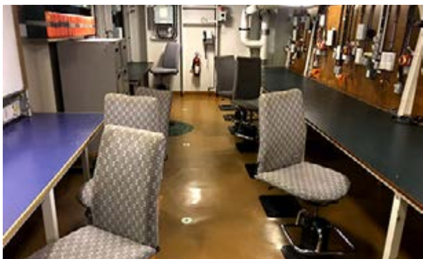
Figura 16: Centro de Operações do Comando Conjunto (Convés 2).

À vante do Complexo de Operações, situa-se o Centro de Operações do Comando Conjunto, composto por duas salas interligadas, uma no próprio convés 2 (Figura 16) e outra no convés 3 (Figura 17), em que podem ser instaladas até 39 estações de trabalho conectadas em rede e ao segmento satelital, 4 telas de projeção, equipamentos de videoconferência e servidores para os Sistemas Operativos do Ministério da Defesa e da Marinha do Brasil.