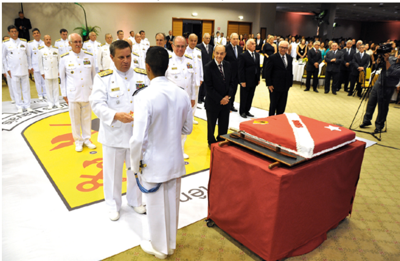
Figura 1: Encontro de Gerações no CFN