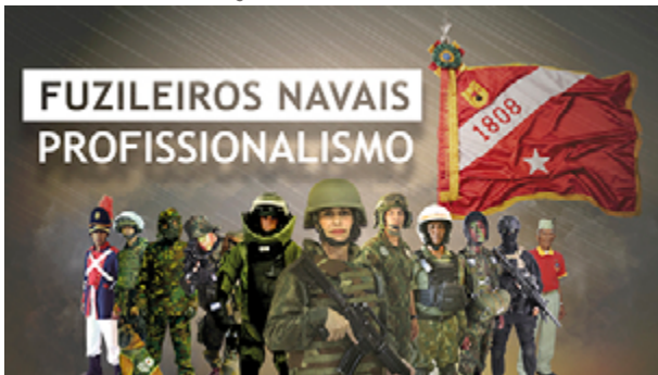
Figura 5: Profissionalismo