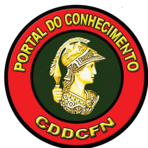
Figura 3: Ícone do Portal do Conhecimento

Para acelerar o fluxo de informações de interesse, todas as OM do CFN podem fazer constar em seus sítios eletrônicos da intranet um ícone de acesso ao Portal do Conhecimento.