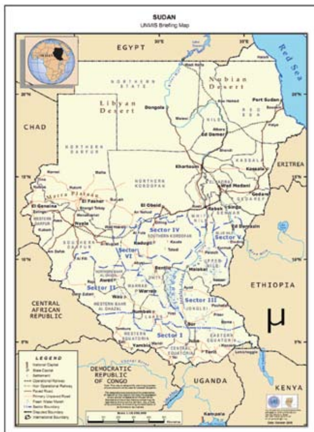
Figura 1: Setores da UNMIS

A UNMIS foi idealizada para permanecer no Sudão por um período de sete anos, compreendendo o “pré-período de transição” de 6 meses (09 de janeiro 2005 a 8 de julho de 2005); um “período de transição” de 6 seis anos (9 de julho de 2005 a 8 de julho de 2011) e; seis meses posteriores a este período, referente à “fase-final”.