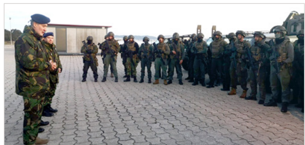
Figura 6: Mensagem do Almirante após cumprimento da missão