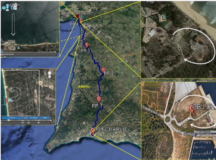
Figura 5: Exercício experimental do Conceito Light and Fast