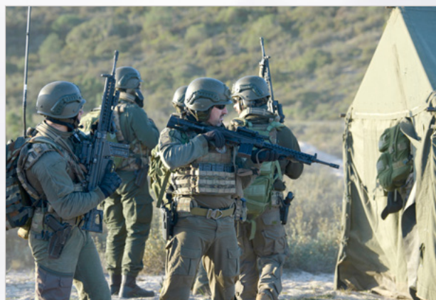
Figura 4: Limpeza de um objetivo e preparação de retirada