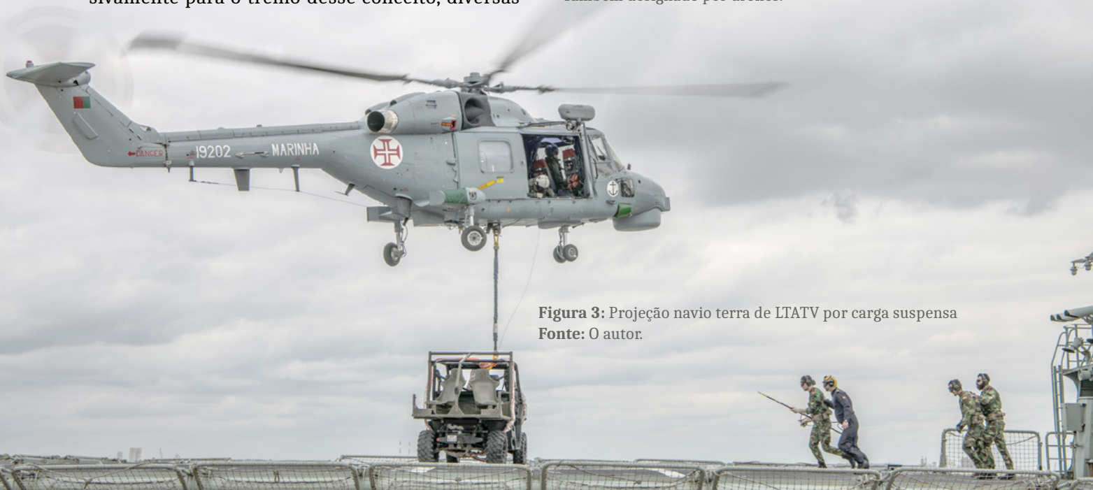
Figura 3: Projeção navio terra de LTATV por carga suspensa