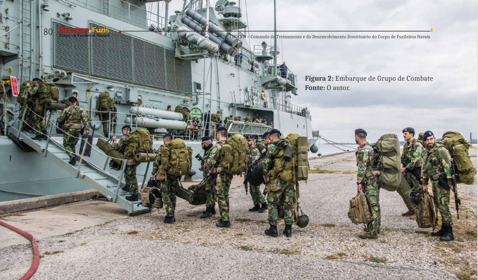
Figura 2: Embarque de Grupo de Combate

De uma forma macro, a figura seguinte ilustra a atual estrutura do Corpo de Fuzileiros.