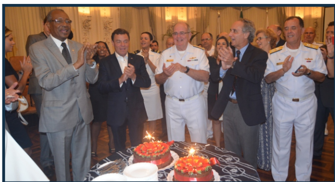
Autoridades festejam os 38 anos da SOAMAR