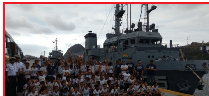
Grupo de Alunos do PROFESP