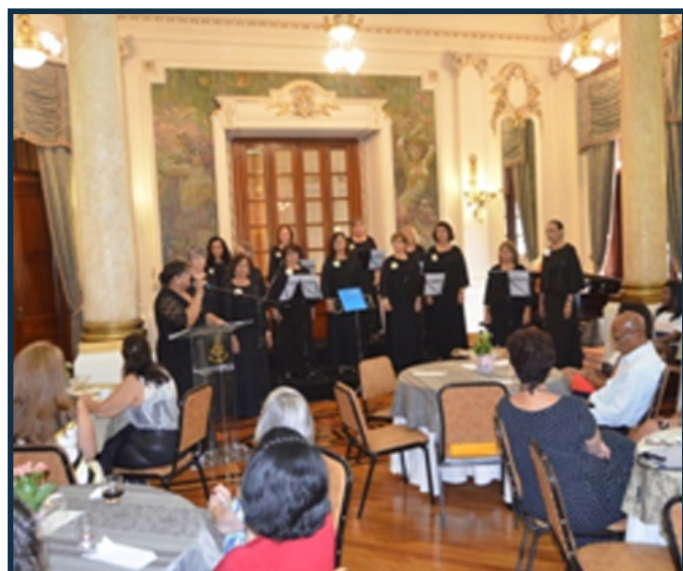
Apresentação do Coral no evento da APRAMA

A renda arrecadada pela venda dos convites foi destinada à instituição “Casa do Menor São Miguel Arcanjo”, localizada em Nova Iguaçu (RJ), que cuida de crianças e adolescente em situação de risco.