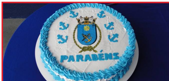
Bolo de Aniversário alusivo à data