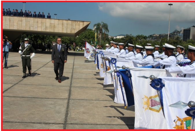
Ministro da Defesa passa em revista à tropa da Marinha do Brasil

A cerimônia em comemoração ao 72º aniversário do Dia da Vitória, presidida pelo Ministro da Defesa Raul Jungmann, concedeu no dia 8 de maio aos ex-combatentes e personalidades civis e militares a Medalha da Vitória, em celebração ao término da Segunda Guerra Mundial. A solenidade foi realizada no Monumento Nacional aos Mortos da Segunda Guerra Mundial, no Rio de Janeiro.