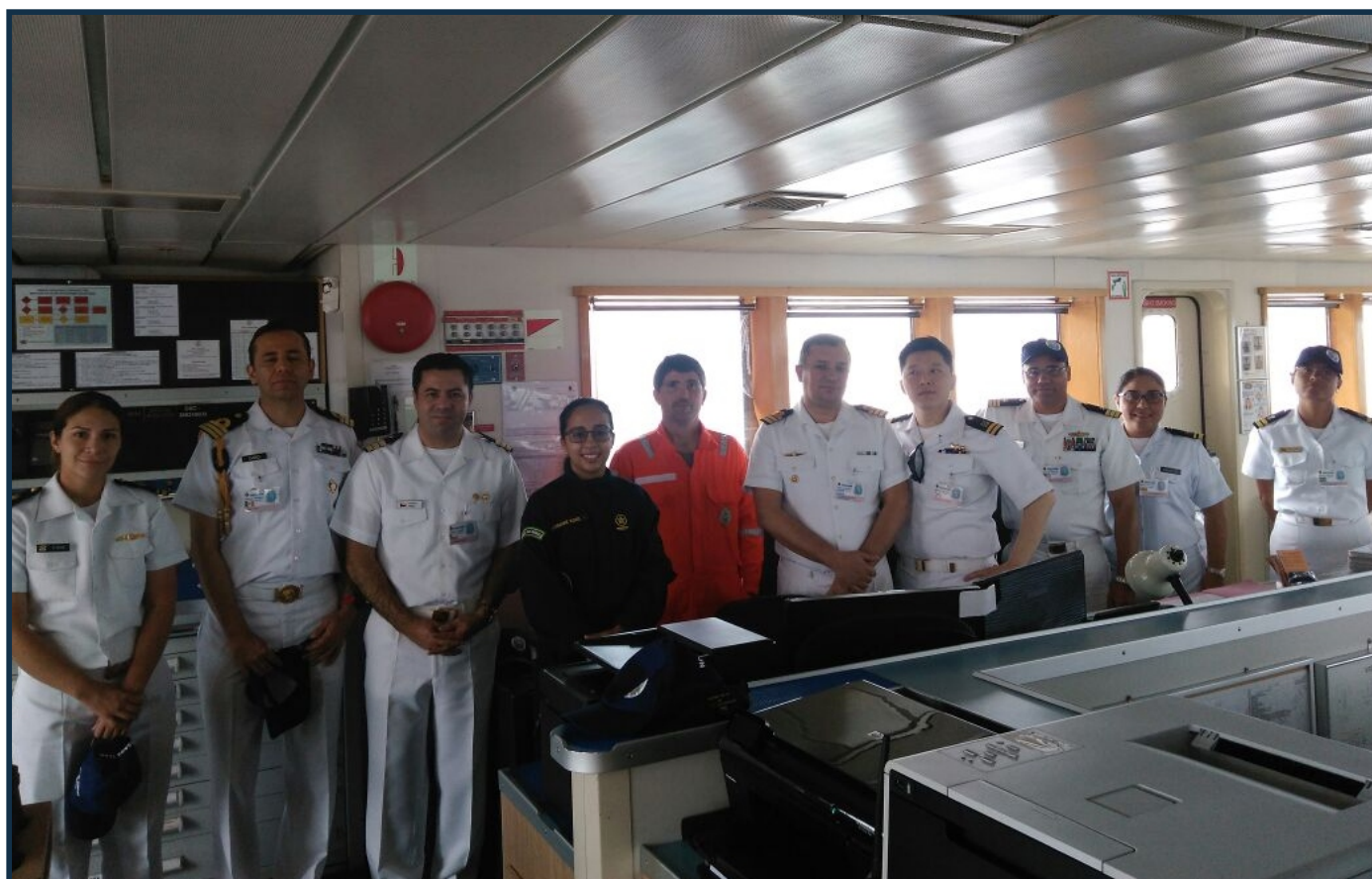
Militares da CPRJ ao lado de representantes de Marinhas estrangeiras

O “Bell Buoy” deste ano contou com a presença de militares da Marinha do Brasil e das Marinhas da Argentina, Austrália, Chile, Colômbia, Coreia do Sul, Equador, Estados Unidos, França, México, Nova Zelândia, Peru e Reino Unido, bem como de instituições civis.