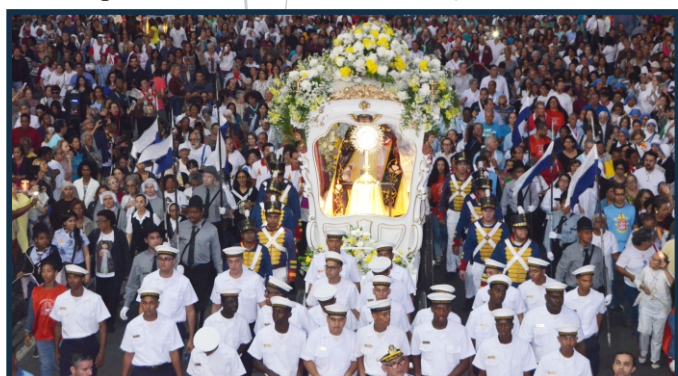
A CPRJ observou que muitos condutores estavam sem habilitação

conta tradicionalmente com uma grande procissão no centro da cidade do Rio de Janeiro (RJ). Este ano, o tema da festa está em sintonia com o Ano da Família, que a Arquidiocese do Rio está vivendo através de diversas atividades religiosas, culturais e sociais. Também é tradição nesta data a confecção de tapetes de sal em frente à Catedral e na Avenida Chile, iniciada ainda de madrugada.