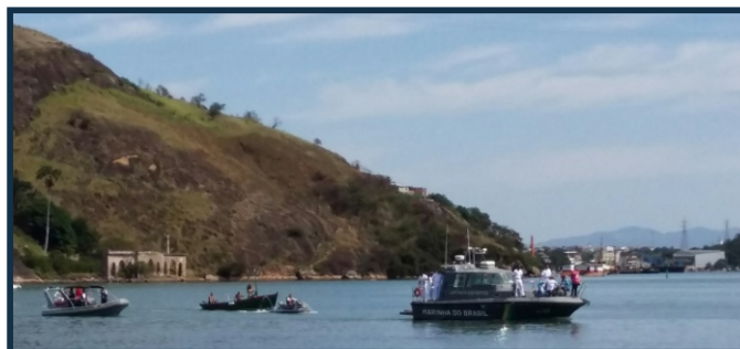
Travessia da imagem no canal de Vitória (ES).

Na ocasião, a imagem de Nossa Senhora foi levada por via terrestre do Convento da Penha para a EAMES, em Vila Velha (ES). Na sequência, a imagem seguiu a bordo da lancha “Peroá” e atravessou o canal com destino à CPES.