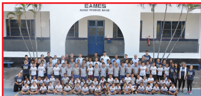
Autoridades civis e militares, professores, estagiários, com as crianças do Programa Forças no Esporte

No dia 8 de maio, na Escola de Aprendizes-Marinheiros do Espírito Santo (EAMES), foi realizada a Cerimônia de Abertura do Programa Força no Esporte (PROFESP). O projeto contará, este ano, com a parceria dos Ministérios da Defesa, do Esporte e da Educação, e participação da Prefeitura