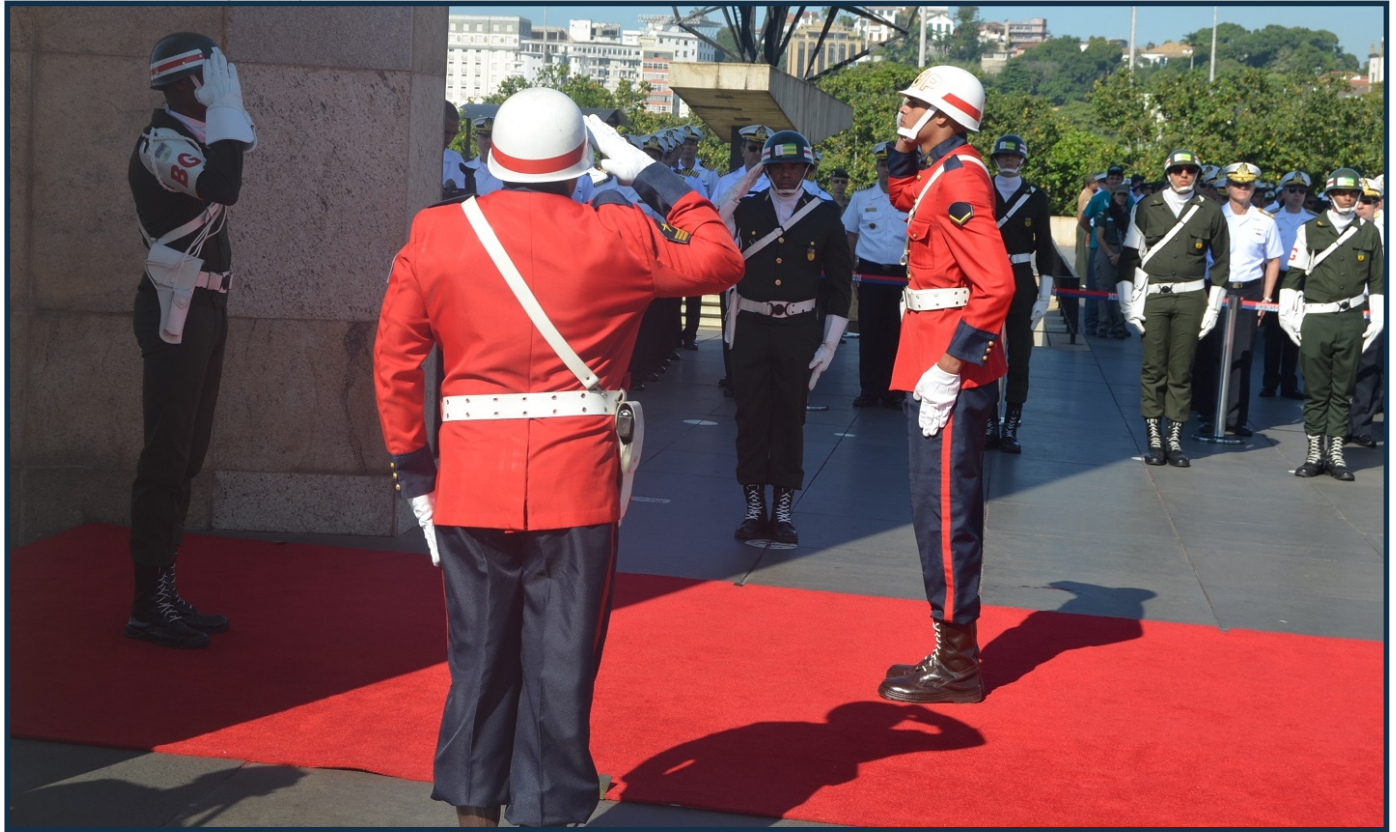
Militares prestam homenagem ao Soldado Desconhecido