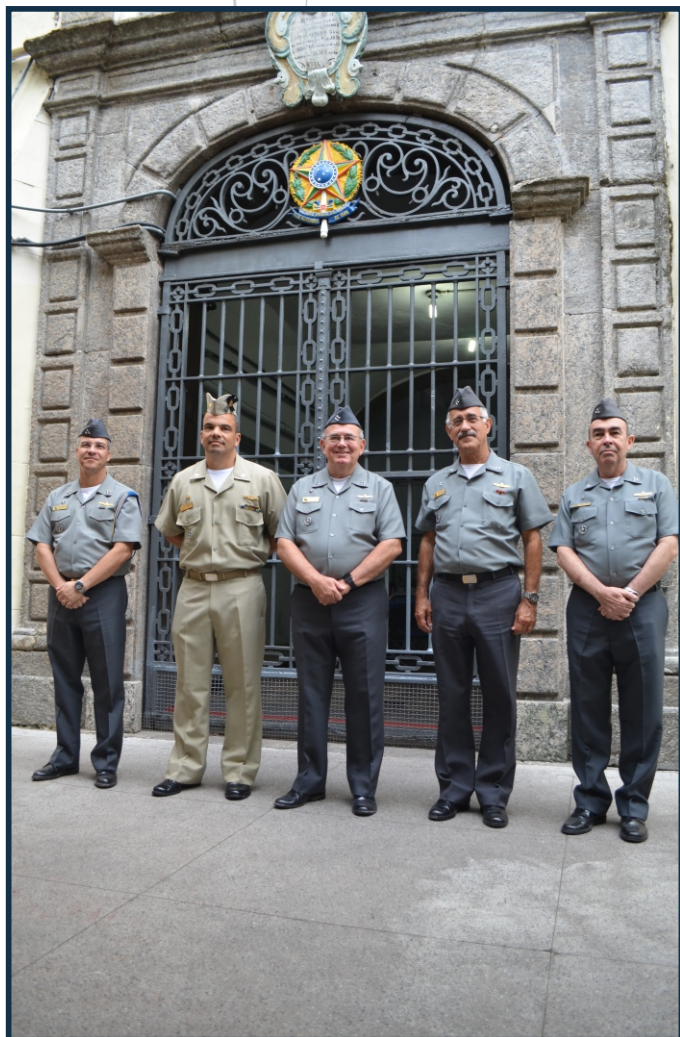
Comandante da MB, ao centro, conhece trabalho de ressocialização do PM