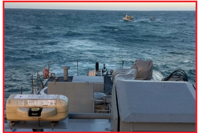
Navio-Patrolha Gurupi escoltando barco pesqueiro com segurança de volta ao porto

Em Vitória, o “Gurupi” ainda foi acionado para um incidente de Busca e Salvamento. O navio precisou localizar uma embarcação pesqueira, com três tripulantes, considerada desaparecida. Após encontrar o barco pesqueiro, que havia sofrido uma avaria, e escoltá-lo até próximo da cidade de Anchieta (ES), a missão foi concluída.