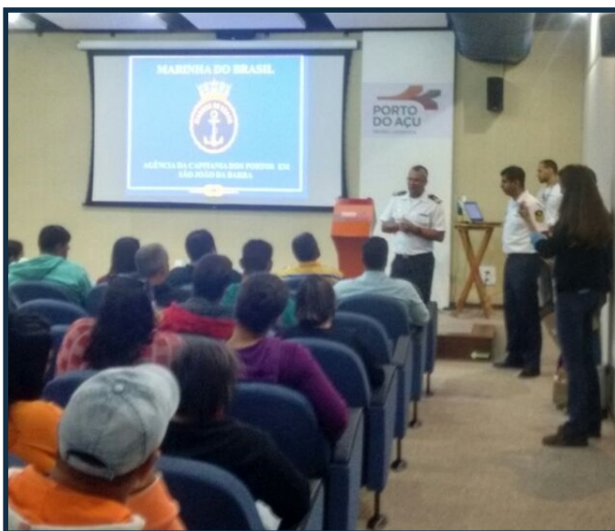
Cerca de 47 pescadores participaram da palestra sobre a Segurança do Tráfego Aquaviário

A Agência da Capitania dos Portos em São João da Barra (AgSJB Barra) realizou uma palestra sobre a Segurança do Tráfego Aquaviário, no auditório do Centro de Visitantes do Porto do Açú (CEVISPA), no Município de São João da Barra (RJ), no dia 19 de maio de 2017. O encontro promovido pela AgSJB Barra teve como público 47 pescadores da Colônia do Farol de São Thomé, que localiza-se no município de Campos dos Goytacazes (RJ).