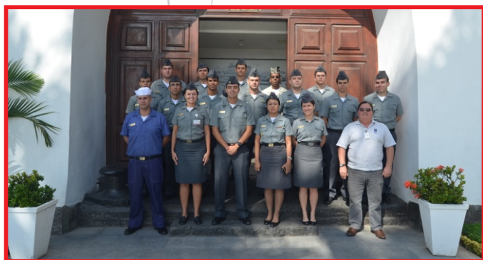
Oficiais e Praças das OM subordinadas participam de adestramento

O Comando do 1º Distrito Naval (Com1ºDN) promoveu o 1º Encontro de Comunicação Social com as Organizações Militares subordinadas com sede no Rio de Janeiro, no dia 24 de maio, no Centro de Comando de Operações do Com1ºDN.