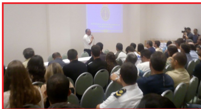
Palestra sobre segurança da navegação