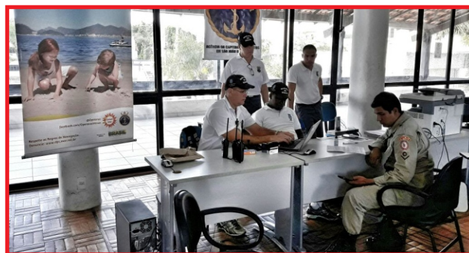
Militares da AgSJBarra atendem público de Campos

Foram disponibilizados à comunidade marítima os serviços de emissão, transferência, renovação e segunda via do título de inscrição de embarcação, bem como renovação e emissão de segunda via da carteira de habilitação de amador (CHA), além de poderem realizar a prova teórica para habilitação de novos amadores.