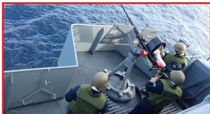
Esse exercício foi o quarto realizado em 2017

O Rebocador de Alto Mar “Almirante Guillobel” participou da comissão “Reboquex V/2017”, no período de 16 a 17 de maio, tendo rebocado o Navio-Patrolha “Gurupi” durante o adestramento, no litoral do Rio de Janeiro, área de jurisdição do Comando do 1º Distrito Naval.