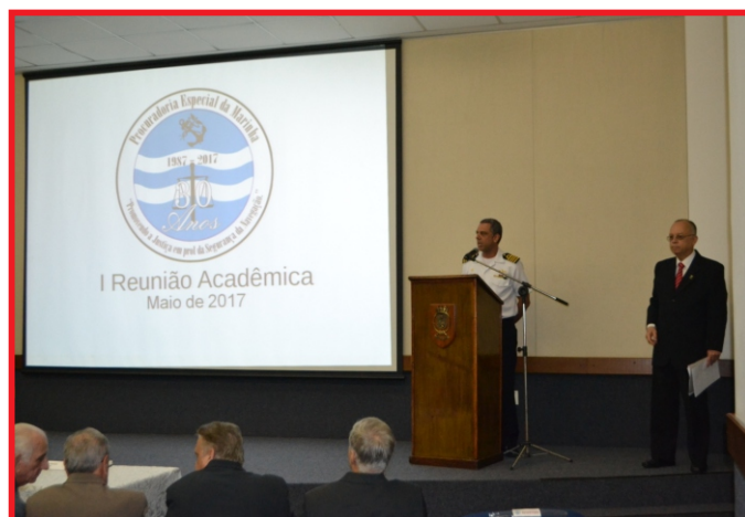
Recolhimento do dispositivo de reboque

Dentre as diversas palestras ministradas, destacou-se a que apresentou os processos sobre Acidentes e Fatos da Navegação e Autos de Infração. Esses processos serão conduzidos por todas as Capitânicas, Delegacias e Agências e, posteriormente, julgados pelo Tribunal Marítimo, acompanhados pela PEM.