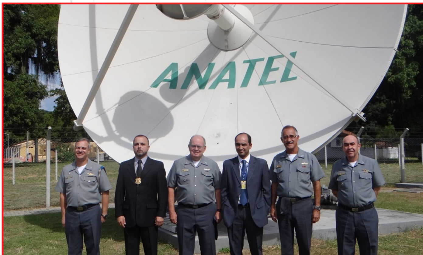
Comandante da MB, o terceiro da esquerda para a direita, conhece as instalações da ERMJR