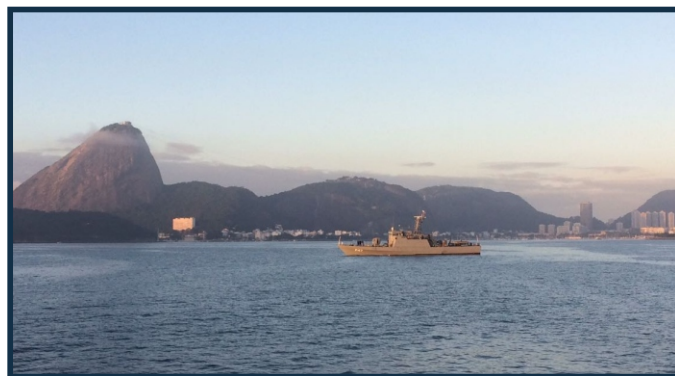
Npa Gurupi, fundeado próximo à Escola Naval

Também estavam fundeados nas proximidades a Fragata “Rademaker”, o Navio Hidroceanográfico “Amorim do Valle” e os Avisos de Instrução “Aspirante Nascimento”, “Guarda-Marinha Jansen” e “Guarda-Marinha Brito”.