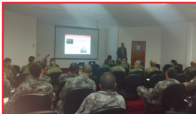
Representantes de diversas Forças Militares foram à palestra no GPTFNRJ

quando são acionados para operações de Controle de Distúrbios e Garantia da Lei e da Ordem (GLO), como ocorreu durante os Jogos Olímpicos e Paralímpicos Rio 2016.