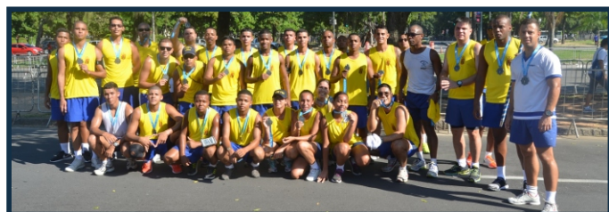
Pelotão do Com1ºDN

O pelotão misto do Comando do 1º Distrito Naval (Com1ºDN) somado ao pelotão vibração do Rebocador de Alto Mar “Alte Guillobel” e aos dois pelotões do Grupamento de Fuzileiros Navais do Rio de Janeiro representaram o Com1DN na 30ª Corrida do Corpo de Fuzileiros Navais e 12ª Corrida do Corpo de Intendentes da Marinha, na categoria, dia 14 de maio, no Aterro do Flamengo (RJ).