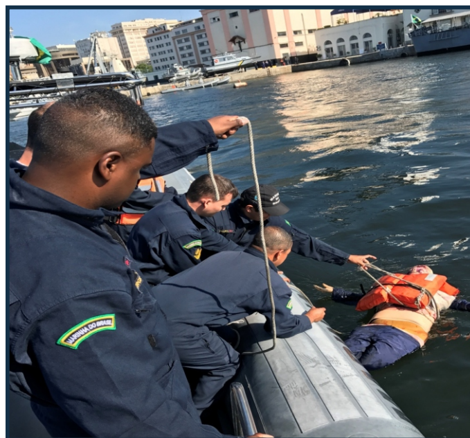
Militares da CPRJ treinam para cumprir missão da MB na Baía de Guanabara

Este exercício é decorrente de entendimentos prévios entre as OM envolvidas, iniciados com o adestramento Básico de Suporte de Vida, para cerca de 100 militares da CPRJ, realizado nas instalações do CMOpM.