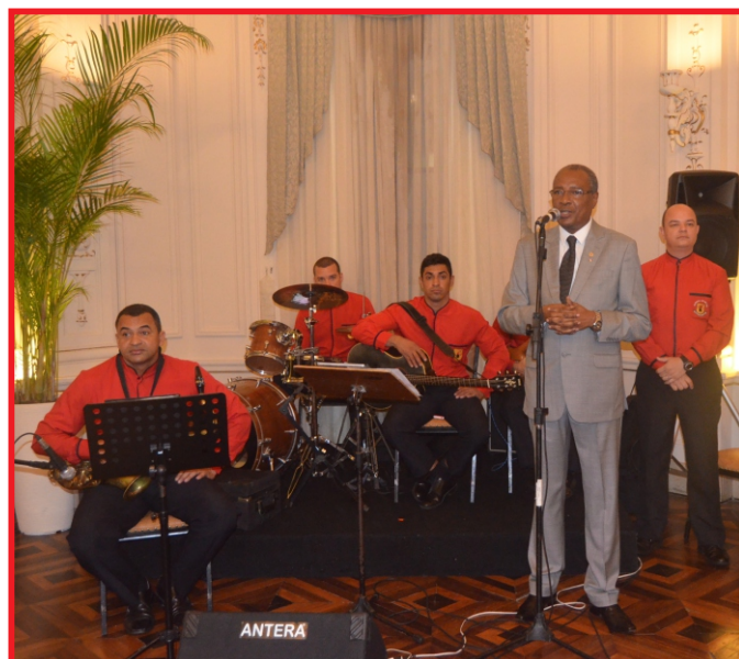
Presidente da SOAMAR discursa em abertura