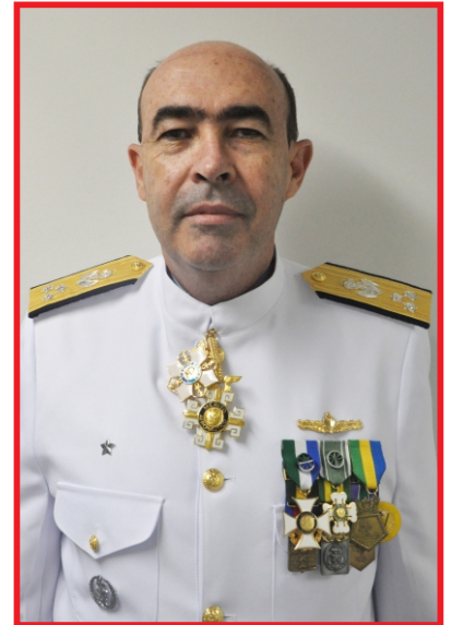
Cláudio Portugal de Viveiros Vice-Almirante Comandante