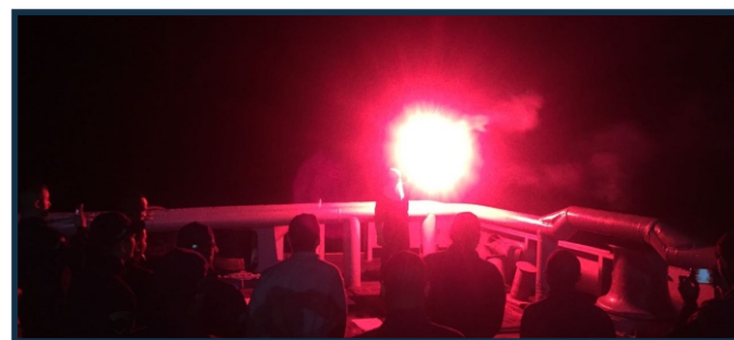
Adestramento de utilização de pirotécnicos na popa

Na terceira fase, o navio fundeou nas proximidades da praia de Itaoca, permanecendo pronto para atuar em operações de salvamento, como reboque e desencalhe de embarcações, durante a realização da Operação Anfíbia. Ao término das ações, o navio regressou para o porto sede, tendo atracado no cais sul do Arsenal do Rio de Janeiro.