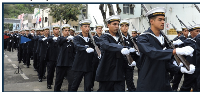
Desfile em Continência ao Governador do ES

As comemorações contaram, ainda, com a entrega da medalha “Vasco Fernandes Coutinho” - alusão ao fundador da Vila do Espírito Santo, atual município de Vila Velha - a algumas autoridades civis e militares que se destacaram junto à sociedade capixaba e com a presença da população nas arquibancadas, montadas este ano em local estratégico, no sítio histórico do município, próximo ao Convento da Penha.