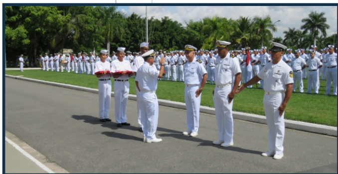
Três militares receberam o reconhecimento da MB pelos serviços prestados

reconhecimento da Marinha do Brasil aos serviços prestados pelos militares da Organização Militar que foram transferidos para a reserva.