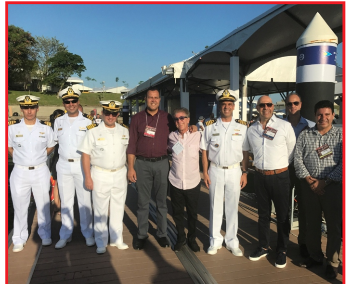
Capitão dos Portos do Rio de Janeiro e representantes da Comunidade Marítima

No stand da Capitania dos Portos, foi montado uma estação de atendimento ao visitante, contando com militares do setor de habilitação de amadores e do ensino profissional marítimo, que atendiam ao público, orientando-o quanto à segurança da navegação, à salvaguarda da vida humana no mar e a prevenção da poluição hídrica, cumprindo uma das tarefas previstas na missão da CPRJ, a de orientar o usuário de embarcações quanto a esses aspectos.