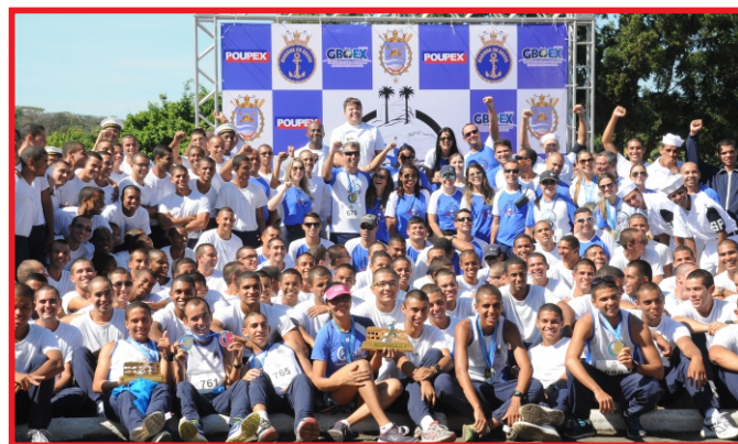
Atletas, alunos e pessoal envolvido na 1ª Corrida Histórica da EAMES

Abertos” com o propósito de fornecer diversos tipos de atividades, tais como: orientações e prevenções, além de muitas diversões para as crianças.