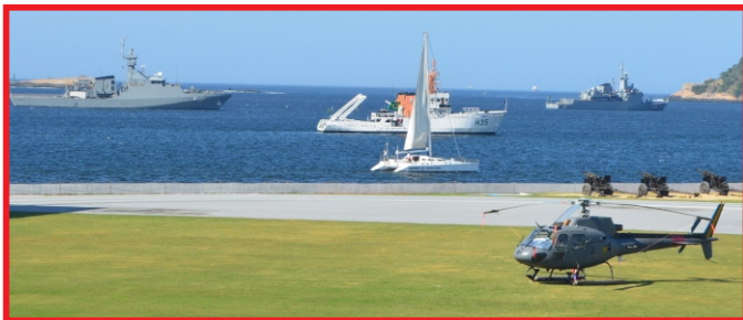
Corveta "Jaceguai", Navio Hidroceanográfico "Amorim do Valle" e Navio-Patrolha Oceânico "Apa"

A Batalha Naval do Riachuelo é, sem dúvida, o maior e o mais importante conflito da Marinha Imperial brasileira durante a Guerra do Paraguai (1864-1870). A vitória travada mudou o destino da guerra e, em consequência, o destino do Brasil como nação. Ficaram famosas na História Militar Brasileira as mensagens transmitidas às embarcações brasileiras pelo Almirante Barroso, através da sinalização de bandeiras: "O Brasil espera que cada um cumpra o seu dever! (...) Sustentar o fogo, que a vitória é nossa!"