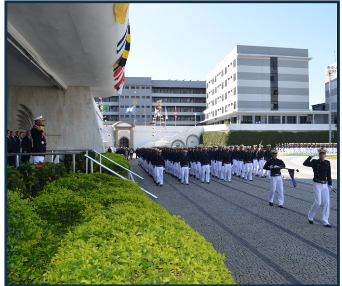
Aspirantes desfilaram em continência ao CON

Na época, o controle dos rios era fundamental como meio de acesso ao Paraguai, porém, por serem estreitos e apresentarem bancos de areia e calha de navegação pouco profunda, traziam desvantagem para os grandes navios brasileiros. Em 11 de junho de 1865, o Brasil estava com alguns de seus melhores navios como a Fragata Amazonas, a Corveta