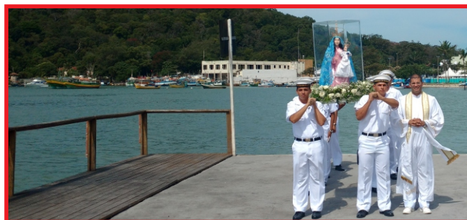
Imagem de Nossa Senhora da Penha na EAMES

Como parte dos festejos de Nossa Senhora da Penha, padroeira do Espírito Santo, a Marinha do Brasil, por meio da Capitania dos Portos (CPES) e da Escola de Aprendizes-Marinheiros do Espírito Santo (EAMES), realizou o translado da imagem no dia 22 de abril, no canal de Vitória (ES).