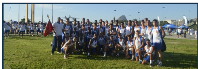
Pelotão do GptFNRJ