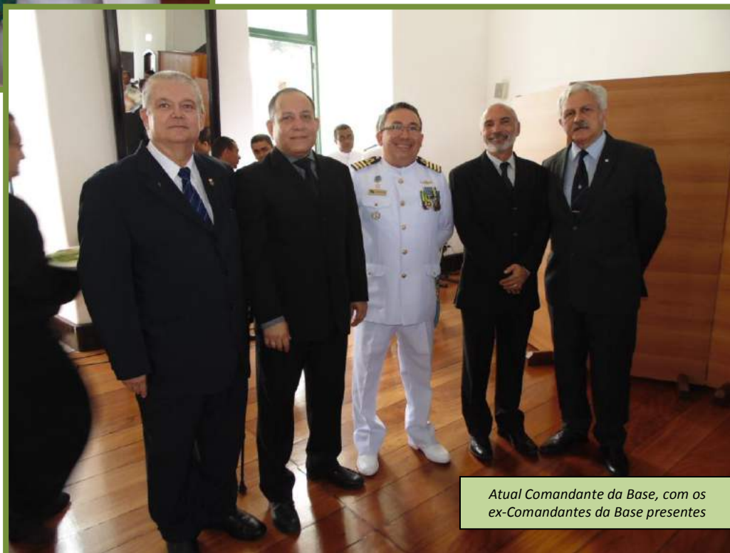
Atual Comandante da Base, com os ex-Comandantes da Base presentes