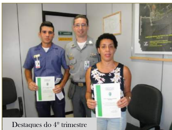
Destaques do 4º trimestre