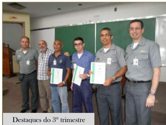
Destaques do 3º trimestre