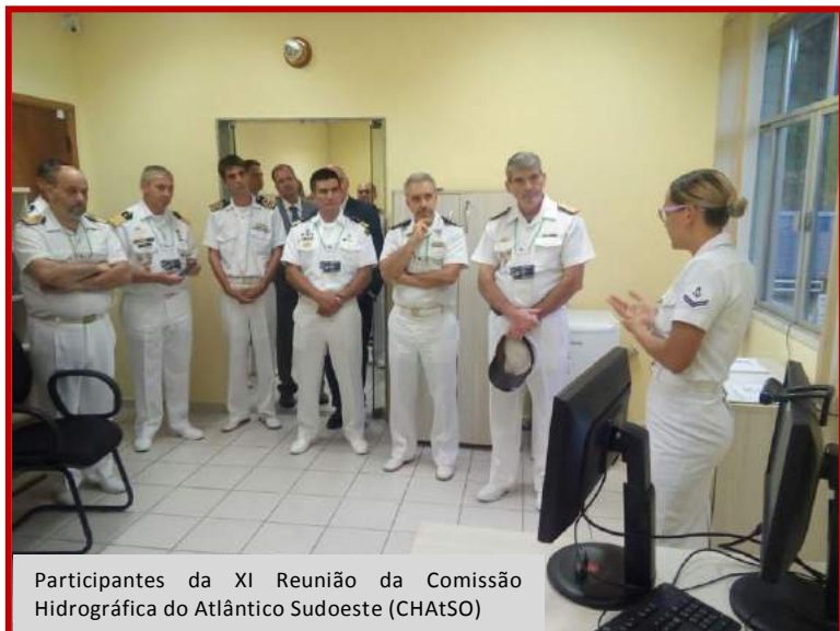
Participantes da XI Reunião da Comissão Hidrográfica do Atlântico Sudoeste (CHAtSO)

No mês de março, o LA-RENC (Latin American IC-ENC Regional Office) recebeu visitas ilustres: no dia 7, os Oficiais participantes da XI Reunião da Comissão Hidrográfica do Atlântico Sudoeste (CHAtSO), que estava sendo realizada nas dependências do CHM, e no dia 14, membros da Comitiva do Japão, que estavam em visita à DHN.