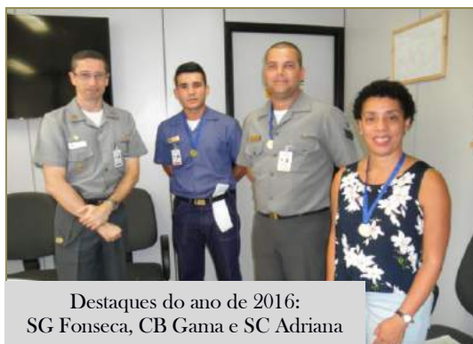
Destaques do ano de 2016: SG Fonseca, CB Gama e SC Adriana