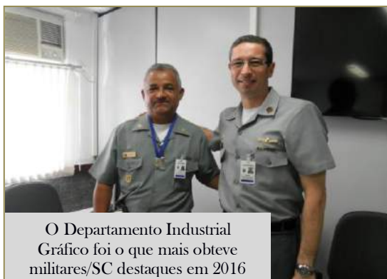
O Departamento Industrial Gráfico foi o que mais obteve militares/SC destaques em 2016