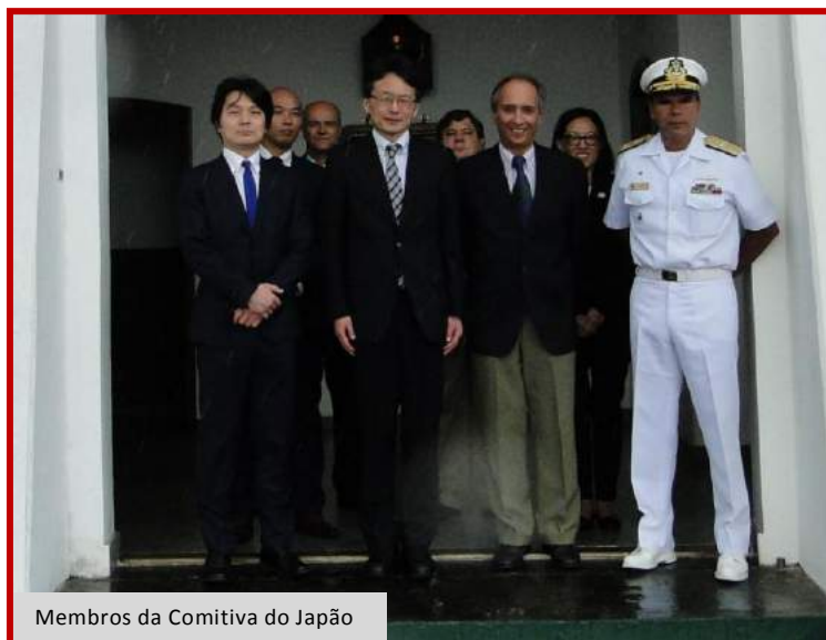
Membros da Comitiva do Japão