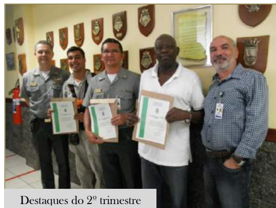
Destaques do 2º trimestre