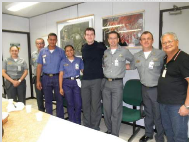
Aniversariantes de 16 a 31 de outubro