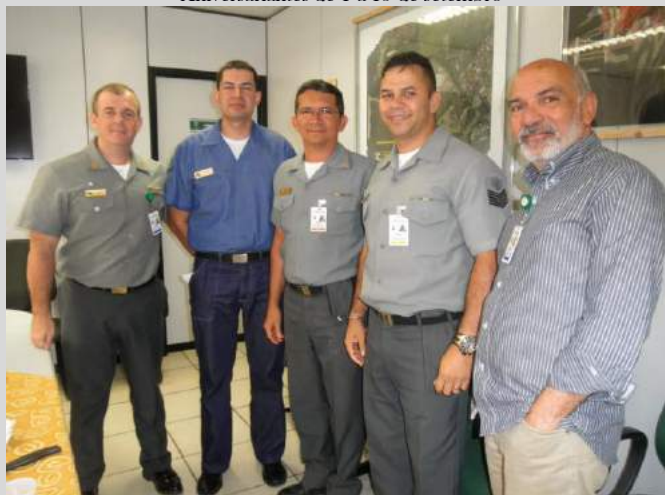
Aniversariantes de 1 a 15 de outubro