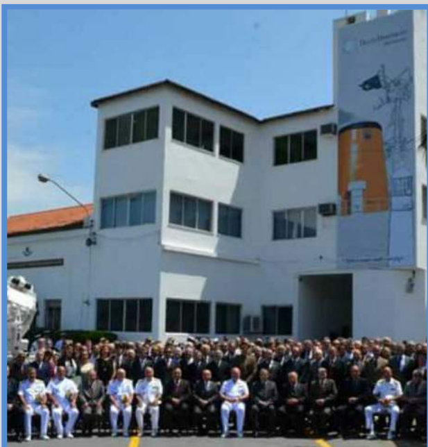
Dia do Hidrógrafo 2016