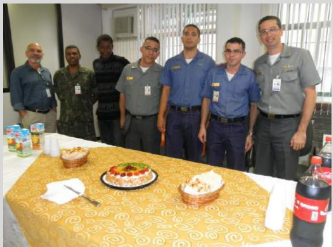
Aniversariantes de 1 a 15 de setembro

Com o propósito de estar mais perto da FT e saber os seus anseios, qual o trabalho que cada um realiza e qual a sua contribuição para a OM, quinzenalmente o Comandante da OM se reúne com os aniversariantes desse período. São momentos agradáveis de descontração que tem trazido resultados positivos para a OM.