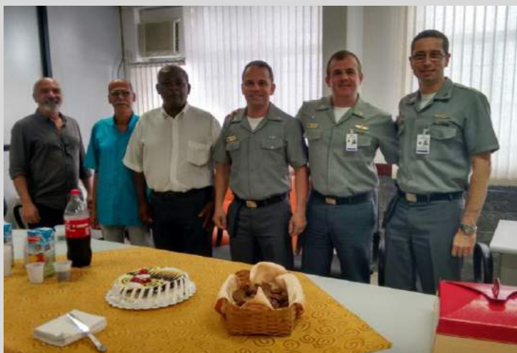
Aniversariantes de 16 a 30 de setembro