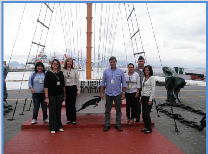
Representação de Hidrógrafos Honorários da BHMN