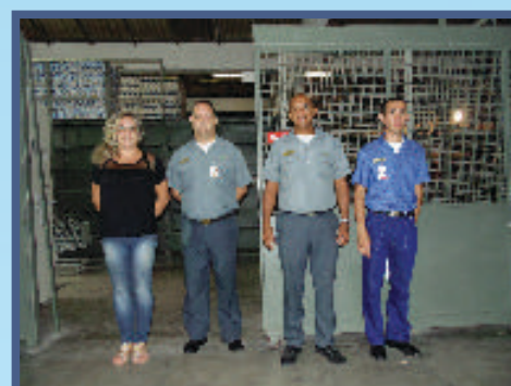
Divisão de Material