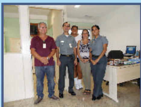
Divisão de Contabilidade