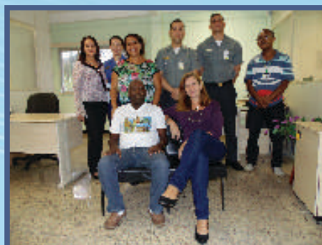
Divisão de Pagamento