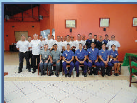
Divisão de Muniamento

E completando a equipe do BH-20, os militares da Divisão de Material executam as tarefas atinentes ao recebimento, conferência, armazenagem, controle de estoque e fornecimento do material comum da BHMN.