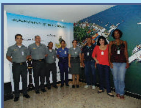
Divisão de Obtenção