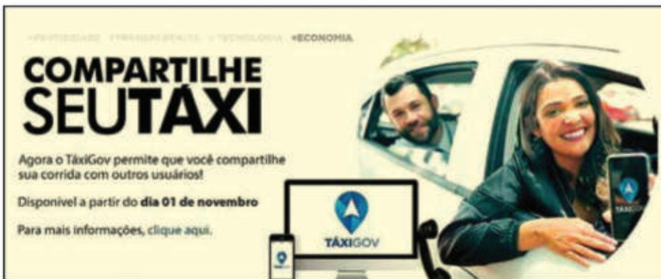
Peça publicitária do aplicativo TáxiGov