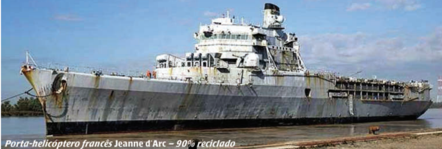
Porta-helicóptero francês Jeanne d'Arc – 90% reciclado

A desativação de 17 submarinos nucleares britânicos esteve paralisada por vários anos em razão dos requisitos de segurança terem se tornado mais rigorosos. No Brasil, o descomissionamento do Submarino Nuclear Almirante Álvaro Alberto pode estar estimado para a década de 2050, mas seu projeto terá que adotar obrigatoriamente o conceito do design thinking , ou seja, deve-se considerar a “gestão do ciclo de vida” do navio, “do berço ao berço”.