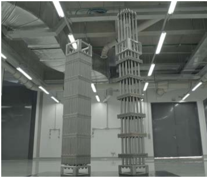
Elemento Combustível fabricado pela ICN e utilizado nas Usinas de Angra I e II

bilidade da Indústrias Nucleares do Brasil (INB), possibilita que o Brasil venha a integrar um restrito grupo de países capazes de oferecer uma alternativa energética valiosa em benefício da sociedade.