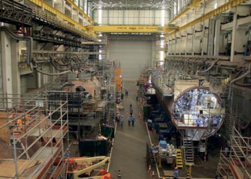
Vista do interior do main hall do ESC