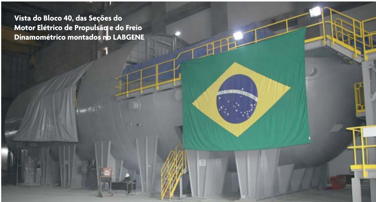
Vista do Bloco 40, das Seções do Motor Elétrico de Propulsão e do Freio Dinamométrico montados no LABGENE

O LABGENE consubstanciará o primeiro Reator de Potência a Água Pressurizada (PWR)