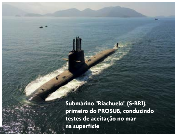
Submarino "Riachuelo" (S-BR1), primeiro do PROSUB, conduzindo testes de aceitação no mar na superfície