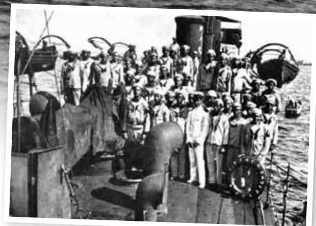
Guarnição do Contratorpedeiro "Piauí"

Logo no início, nas Guerras da Independência, a Marinha foi fator decisivo e primordial