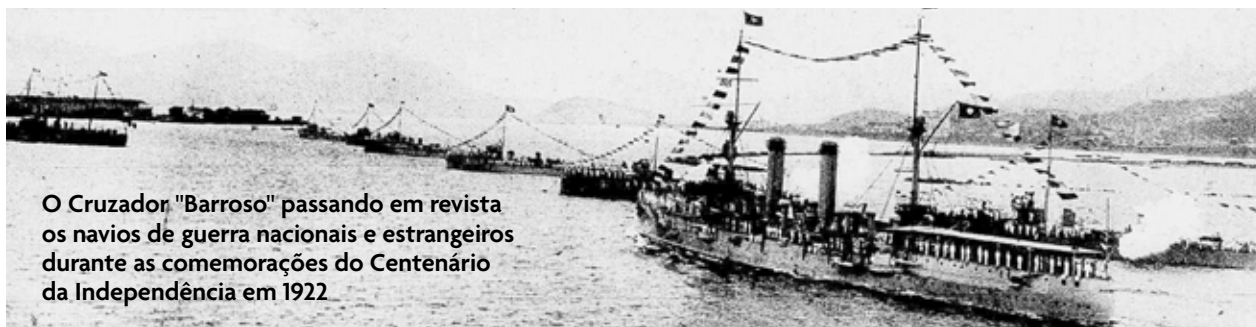
O Cruzador "Barroso" passando em revista os navios de guerra nacionais e estrangeiros durante as comemorações do Centenário da Independência em 1922

Por ocasião dos 100 anos da Independência, a Marinha de Guerra estava estruturada de acordo com a Segunda Fase, da Primeira Reforma Alexandrino (1914-1923). Possuía uma excess-