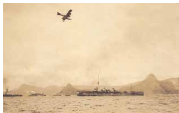
A participação da Marinha brasileira na 1ª Guerra Mundial foi um fato marcante da nossa história naval. Acima, o Presidente da República do Brasil Wenceslau Brás quando assinava a declaração de guerra e o Cruzador "Rio Grande do Sul" na chegada da DNOG ao Rio de Janeiro