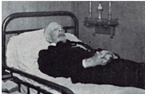
Conde d'Eu no seu leito de morte a bordo do "Massilia", quando se dirigia ao Brasil para celebrar o Centenário da Independência do País

Fotografia da Revista "Careta" - Ano 1922/ Ed. 0742 Fonte: BN Digital