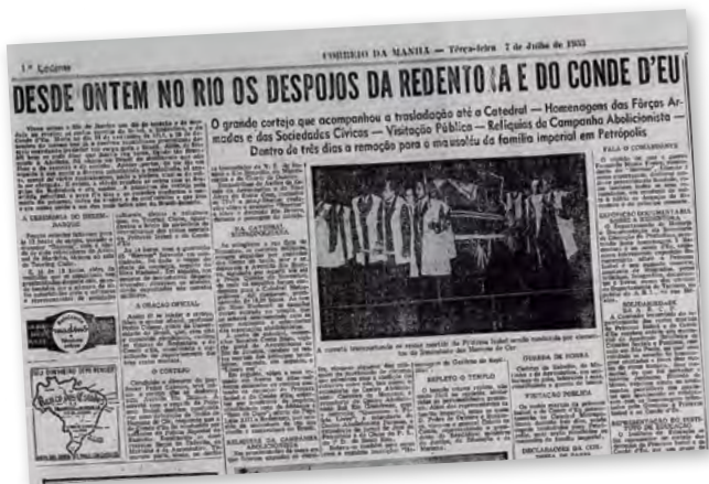
Jornal Correio da Manhã de 7 de julho de 1953