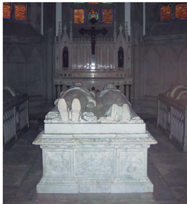
Os restos mortais de Pedro II e sua esposa Teresa Cristina, bem como sua filha, a Princesa Isabel, e seu genro, Conde d'Eu, encontram-se sepultados no Mausoléu Imperial, em Petrópolis (RJ)

de D. Pedro I com a Imperatriz D. Leopoldina; os Príncipes imperiais D. Afonso Pedro (1845-1847) e D. Pedro Afonso (1848-1850), filhos de D. Pedro II e D. Teresa Cristina; e D. Luísa Vitória (1874-1874), filha natimorta da Princesa D. Isabel e do Conde d'Eu. Embora falecida na Ilha da Madeira, a princesa D. Maria Amélia (1831-1853), filha de Pedro I e da Imperatriz D. Amélia, encontra-se, também, sepultada nesse Convento. ■