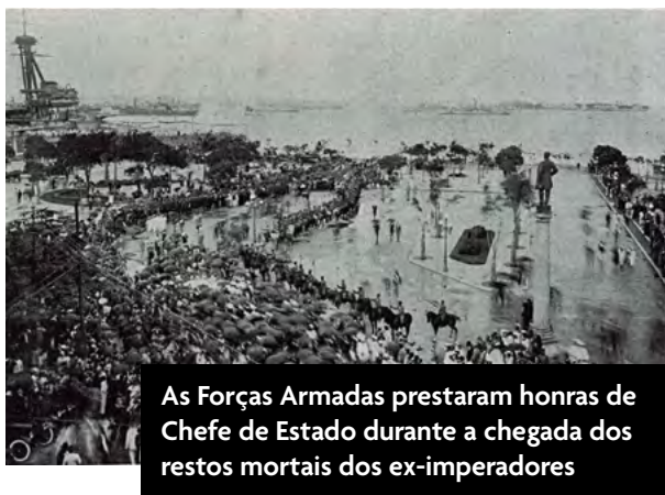
As Forças Armadas prestaram honras de Chefe de Estado durante a chegada dos restos mortais dos ex-imperadores