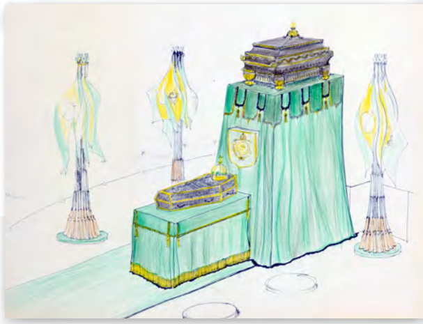
Projeto de ornamentação para o transporte dos despojos de D. Pedro I