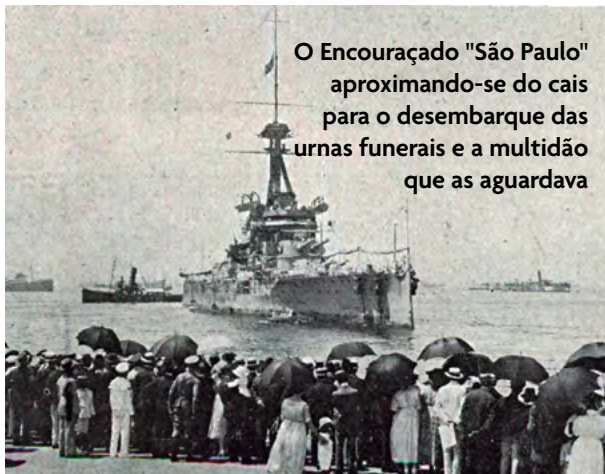
O Encouraçado "São Paulo" aproximando-se do cais para o desembarque das urnas funerais e a multidão que as aguardava