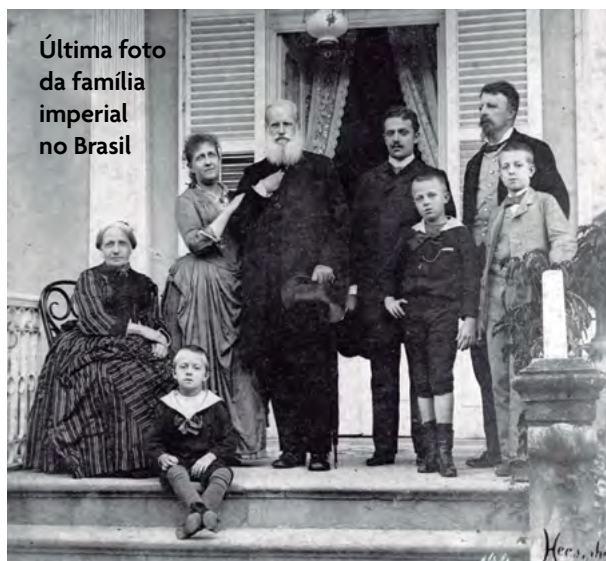
Última foto da família imperial no Brasil

Finalizando este artigo, cabe mencionar que outros componentes da família imperial faleceram e foram sepultados no Brasil e se encontram, até os nossos dias, no mausoléu do Convento de Santo Antônio, no Rio de Janeiro, a saber: os Príncipes da Beira D. Miguel (1820-1820) e D. João Carlos (1821-1822); a Princesa D. Paula Mariana (1823-1833), filhos e filha