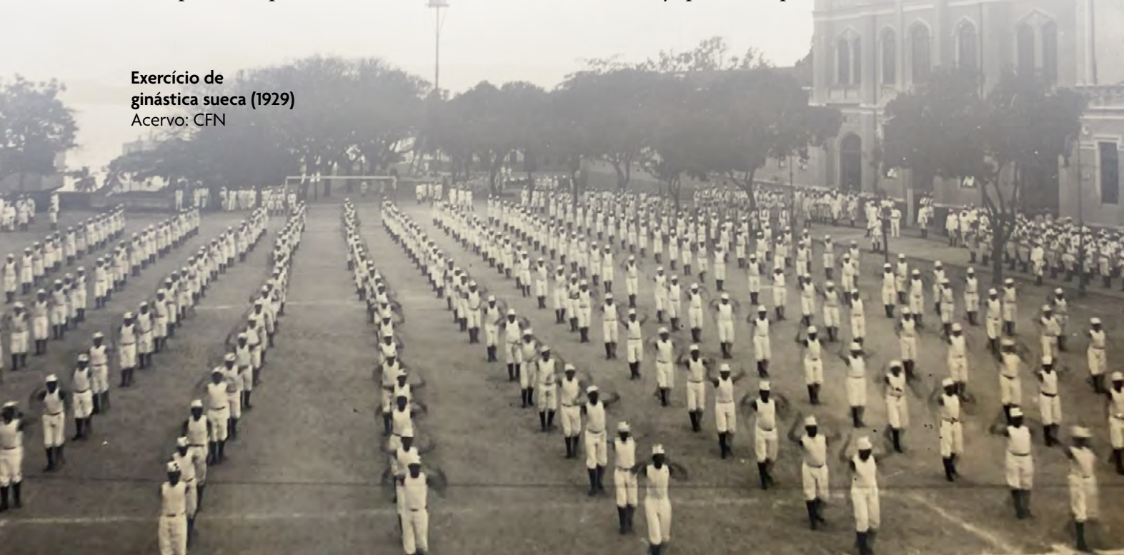
Exercício de ginástica sueca (1929)