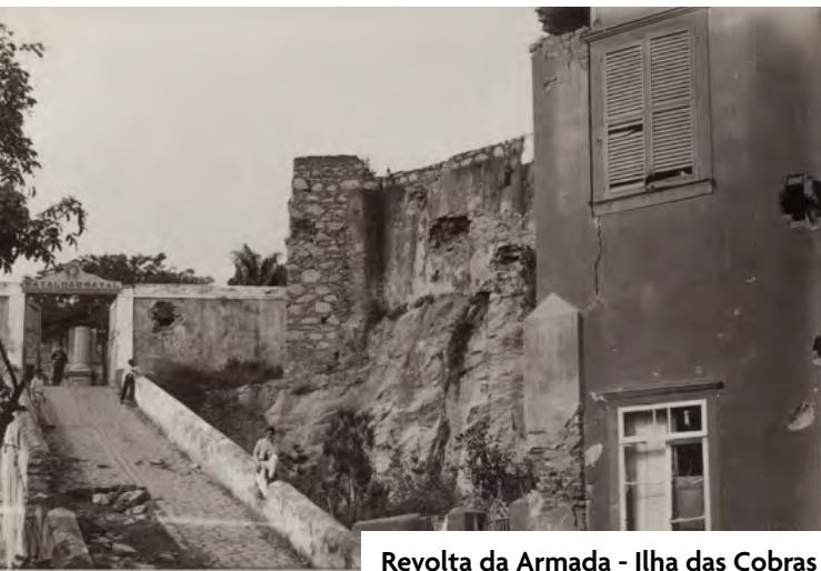
Revolta da Armada - Ilha das Cobras

No mesmo ano, todo o Batalhão Naval se rebelou (Abreu, 2018; p. 199), fez-se ao mar e aderiu à Revolta. Com todos os seus quadros informalmente desertados (Marques, 1940; p. 55), a Fortaleza da Ilha das Cobras foi duramente bombardeada, tendo suas muralhas arrasadas (Bielinski, 2002; p. 123). Virtualmente extinto, teve anistia-