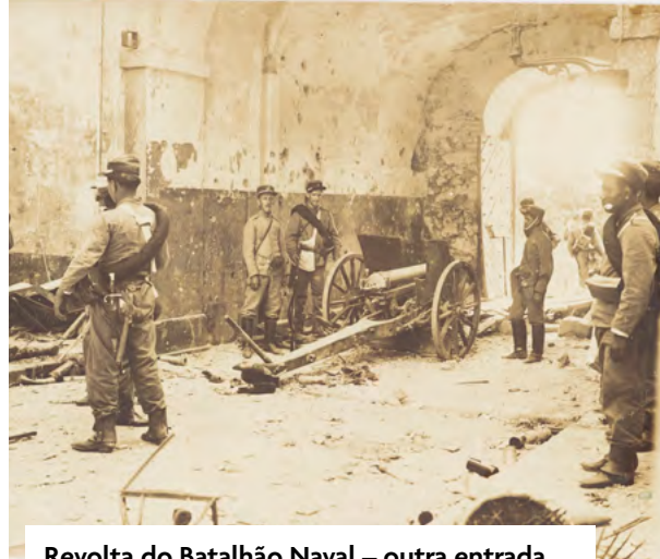
Revolta do Batalhão Naval – outra entrada para o Batalhão Naval, onde os revoltosos assentaram um canhão

Em 1910, boa parte das praças aderiria ao levante que se seguiu à Revolta da Chibata. A Revolta do Batalhão Naval (9 e 10 de dezembro de 1910) acabou com um saldo de setecentos militares presos (Marques, 1940; p. 69), e foi à frente por um mal entendido (um boato implantado pelos presos, tal qual ocorreu em 1831 por parte de Cipriano Barata), divulgado pelos presos da marinharia: diziam entre eles e com seus carcereiros que as punições físicas teriam sido extintas apenas para os marinheiros nacionais, incitando os fuzileiros navais a se amotinarem (Silva, 1961; p. 30). O contra-ataque viria da oficialidade e parte da guarnição que não havia aderido ao movimento, bem como do governo federal, que estabeleceu uma posição de artilharia do Exército no Mosteiro de São Bento (Bielinski, 2008; p. 83). Dada a derrama que se fizera nas fileiras dos marinheiros nacionais e dos fuzileiros navais, coube ao Exército (1º Batalhão de Infantaria) a guarda da Ilha das Cobras e de seus presos, sendo os fuzileiros restantes levados a ocupar, pela primeira vez, em 3 de janeiro de 1911, os “antigos depósitos de munição na