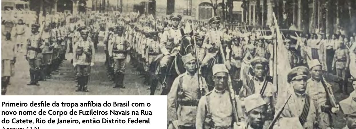
Primeiro desfile da tropa anfíbia do Brasil com o novo nome de Corpo de Fuzileiros Navais na Rua do Catete, Rio de Janeiro, então Distrito Federal

ram o cargo de Comandante-Geral: CMG Durval, CF Milcíades, CC Seabra, CT Sylvio de Camargo e 1º Ten Serejo (Costa, 2005; p. 15). Destes, o penúltimo é hoje seu patrono. O primeiro oficial-general da ativa seria o Contra-Almirante (FN) Milcíades Portela Alves, em 1940.