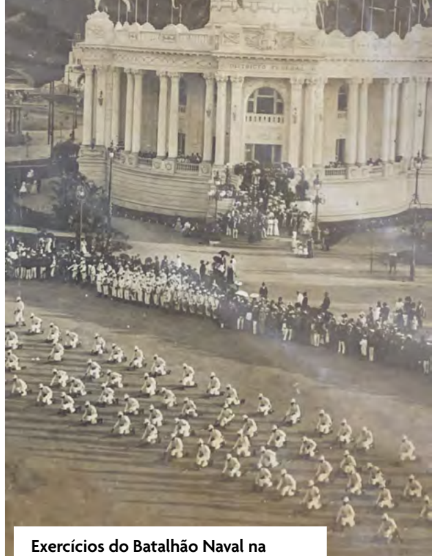
Exercícios do Batalhão Naval na Exposição de 1908 na Praia Vermelha