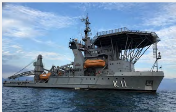
Navio de Socorro Submarino "Felinto Perry"

Incorporação do Navio de Socorro Submarino "Felinto Perry", K-11, de origem norueguesa, com capacidade de realização de mergulho saturado de até trezentos metros, inédito na Marinha até então, além de ser pioneiro na execução de exercícios reais de socorro submarino - Search and Rescue Submarine (SARSUB), incluindo resgate de tripulantes de submarinos por meio do Sino de Resgate Submarino (SRS) acoplado à escotilha do submarino.