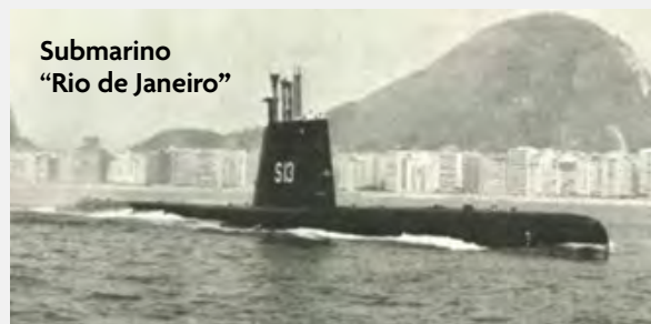
Submarino “Rio de Janeiro”

Incorporação dos Submarinos “Guanabara”, S-10, “Rio Grande do Sul”, S-11, e “Rio de Janeiro”, S-13, de origem norte-americana, da Classe “Guppy II”, que trouxeram como maior novidade o uso de esnórquel, aumentando consideravelmente a capacidade do submarino em se manter mergulhado.