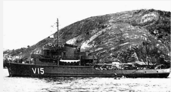
Corveta “Imperial Marinheiro”

Incorporação da Corveta “Imperial Marinheiro”, V-15, de origem holandesa, com a capacidade de prover socorro e salvamento a submarinos.