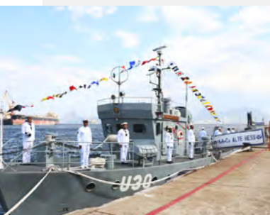
Aviso de Apoio Costeiro "Almirante Hess"

Incorporação do Aviso de Apoio Costeiro "Almirante Hess", U-30, construído na Indústria Naval do Ceará S.A. (INACE), com capacidade para recolhimento de torpedos de exercício.