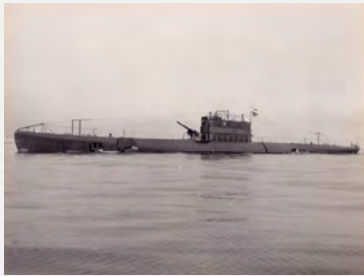
Submarino de Esquadra “Humaytá”

Substituição das denominações da Flotilha de Submersíveis e Escola de Submersíveis para Flotilha de Submarinos e Escola de Submarinos, que teve como um dos fatores determinantes a aquisição do Submarino de Esquadra “Humaytá”, de origem italiana, que, diferentemente dos Classe “Foca”, não se limitava a operar em entrada de porto. Foi incorporado em 1929, como o primeiro submarino oceânico com capacidade de realizar operações de minagem no Brasil.