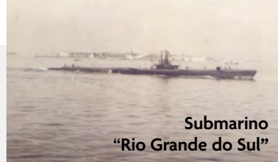
Submarino “Rio Grande do Sul”