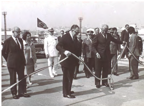
Inauguração da Ponte Rio – Niterói (1974)