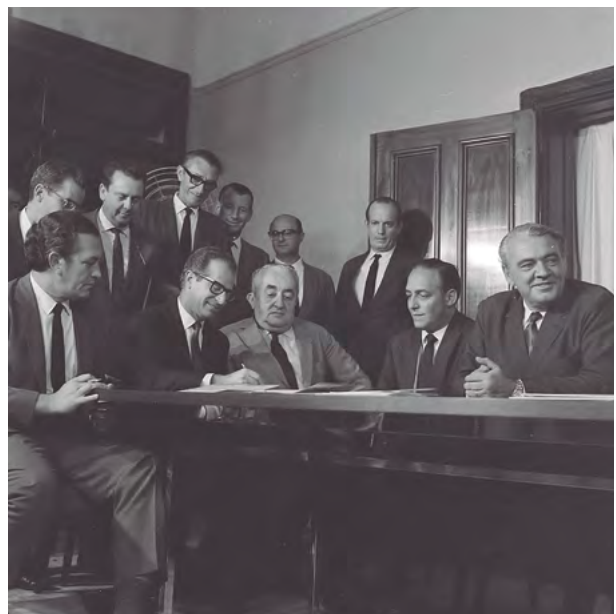
Assinatura de contrato da Ponte Rio – Niterói, no Ministério dos Transportes (1968)

Na fase de definição da altura, a Marinha precisava de, no mínimo, 60 m da linha d'água no vão central para a passagem de navios, principalmente petroleiros, e a Força Aérea de, no máximo, 72 m, devido aos procedimentos de aproximação das aeronaves para os aeroportos Santos Dumont e Galeão, onde ainda operavam os quadrimotores Electra, que chegavam a baixa altitude. Foi, então, adotada a altura de 72 m para o vão central.