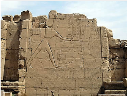
Fig.2 – Hieróglifos em pedra registram a Batalha de Megido no Templo de Karnak.

na vitória. Algum tempo depois, a saga egípcia seria transcrita para as paredes de pedra do templo de Karnak, em Tebas.