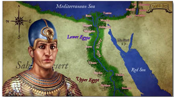
Fig. 1 – Tutmés III, o maior dentre os faraós guerreiros.

Após a morte de Hatshepsut, Tutmés III ascendeu ao trono. Tinha 20 anos de idade quando herdou um império próspero que controlava grandes áreas da Núbia e do Levante 4 . Porém, logo após assumir o trono, o jovem faraó deparou-se com uma grave insurgência na região de Canaã e sul da Síria. Era frequente no mundo antigo que estados vassalosos se rebelassem contra um novo governante a fim de aproveitar a transição do poder para conquistar autonomia ou negociar novas condições de submissão. Se para os egípcios Tutmés III era um ser sagrado, para os sírios e cananeus 5 ele era apenas um jovem rei sem experiência em batalha e com um frágil controle do poder.