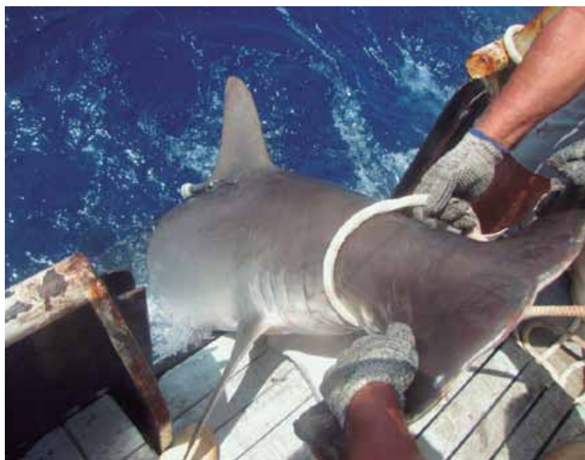
Tubarão-Martelo capturado e sendo devolvido ao mar, após instalação de transmissor de monitoramento via satélite