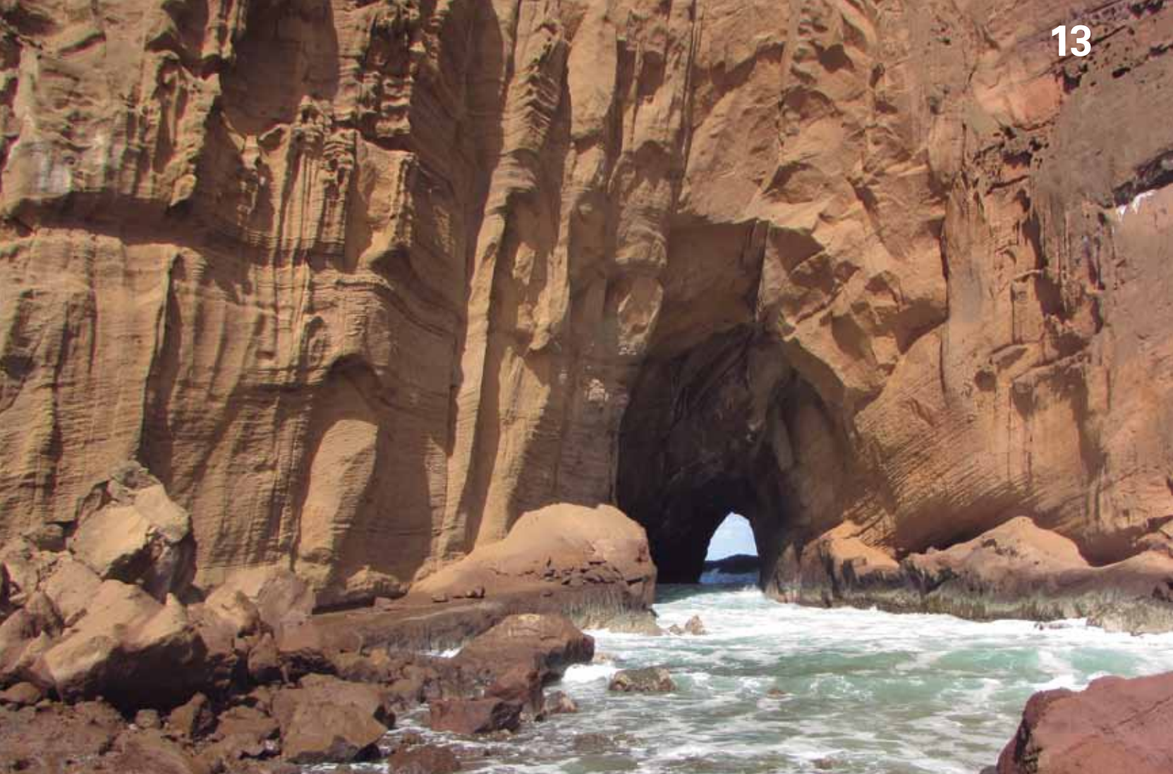
Túnel de Trindade

Já em recentes 170.000 anos atrás, teoriza-se ser a gênese da Formação do Morro Vermelho, uma manifestação eruptiva próxima ao morro de mesmo nome e, ao contrário dos outros eventos anteriormente descritos, tem pouco Piroclastos, apresentando lavas mais fluidas e cujas camadas tem uma distinta inclinação máxima de 30 graus para norte.