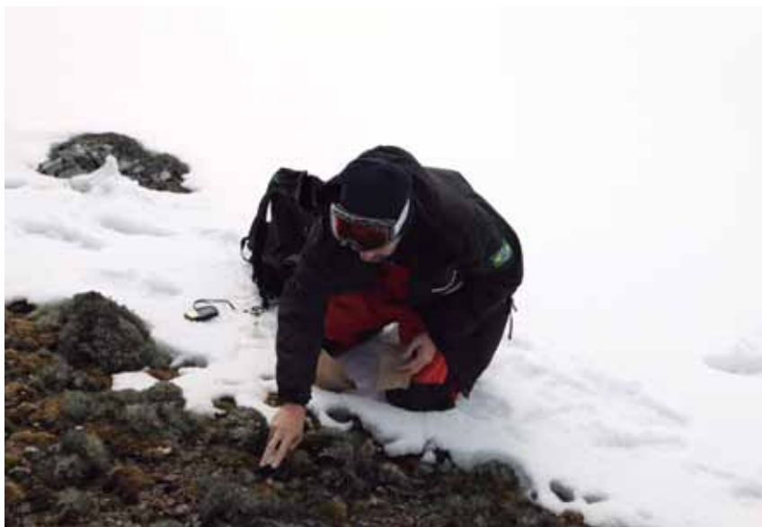
Coleta na Antártica

A CIRM é a responsável pela execução das pesquisas, por meio de expedições científicas, a bordo dos navios da Marinha do Brasil, em acampamentos lançados a partir desses Navios e pela permanência dos pesquisadores brasileiros na Estação Antártica Comandante Ferraz.