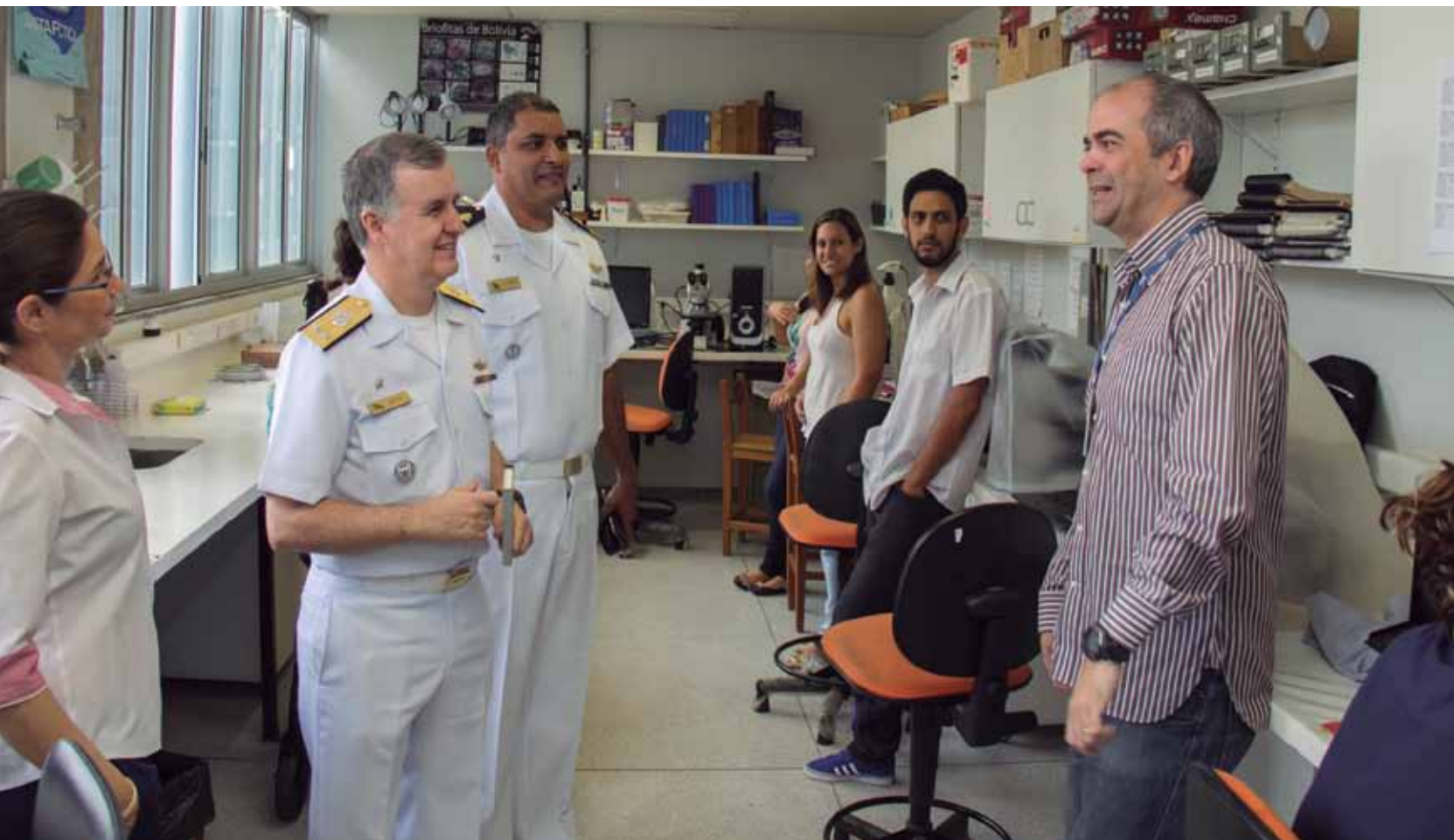
Membros da CIRM conhecem os laboratórios onde são analisadas e armazenadas espécies coletadas nas pesquisas

Estudos sobre vegetação do Instituto de Ciências Biológicas recebem apoio da CIRM para investigação da origem de musgos e líquens na região da Ilha da Trindade e Antártica