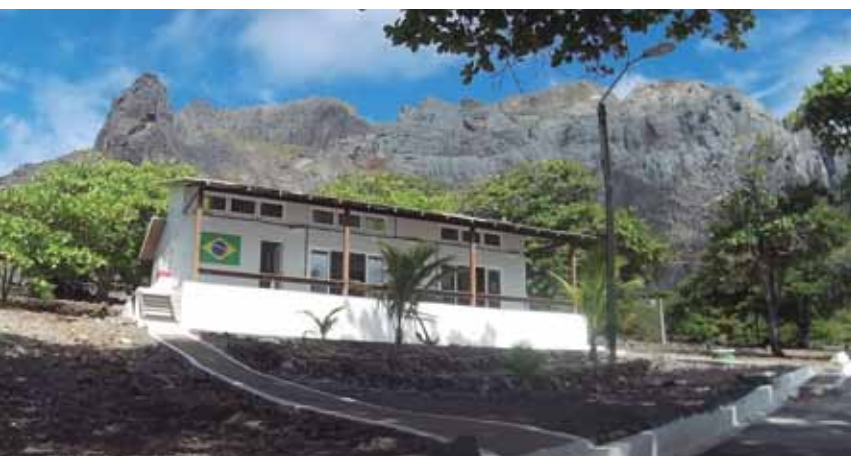
Estação Científica da Ilha da Trindade (ECTT), que possui dois laboratórios e tem capacidade para alojar até oito pesquisadores.

de 90, a Ilha vem passando por um importante processo de reflorestamento. Esse trabalho foi necessário, porque, no período das grandes navegações, conforme costume da época, cabras foram deixadas no local, para servirem como alimento. Aconteceu que, sem predador natural, tornaram-se selvagens, proliferaram e devastaram a vegetação nativa. Os biólogos do Museu Nacional, importante Laboratório de Botânica da UFRJ, orientaram a Marinha na retirada dos caprinos, e, menos de uma década após, já se observa a recuperação da vegetação, a redução da erosão, o renascimento de nascentes e o reaparecimento de aves julgadas extintas, como é o caso de uma espécie de fragata, também endêmica, que chega a medir dois metros de envergadura.