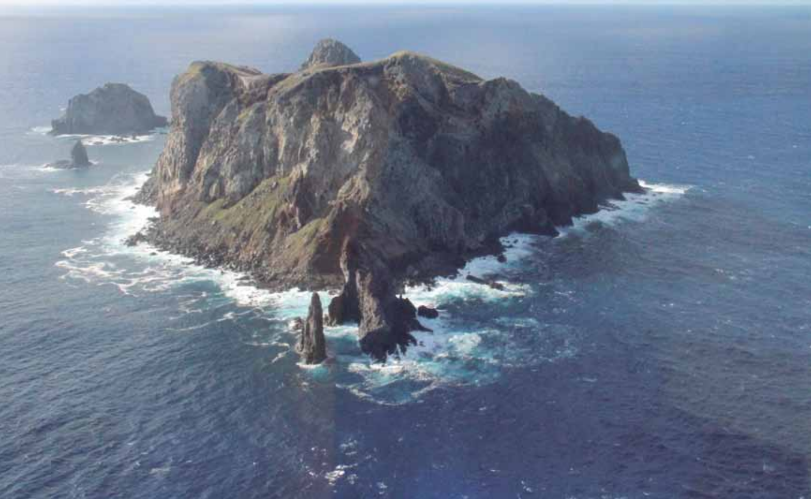
Arquipélago de Martin Vaz, ponto extremo oriental da cadeia de montanhas submarinas Vitória-Trindade.