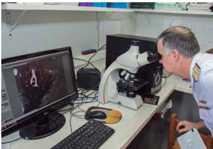
Laboratório de Criptógamas do Departamento de Botânica da UnB