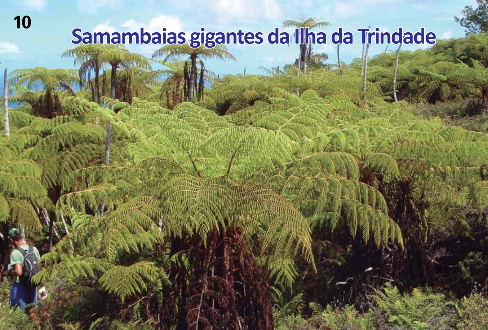
Floresta de samambaias gigantes

A vegetação original da Ilha da Trindade é desconhecida, havendo escassos relatos oriundos de viajantes que ali estiveram entre os séculos XVIII e XIX. A introdução de animais na Ilha foi realizada por volta de 1700 durante expedição do astrônomo Edmund Halley, responsável por parte da devastação da flora da Ilha.