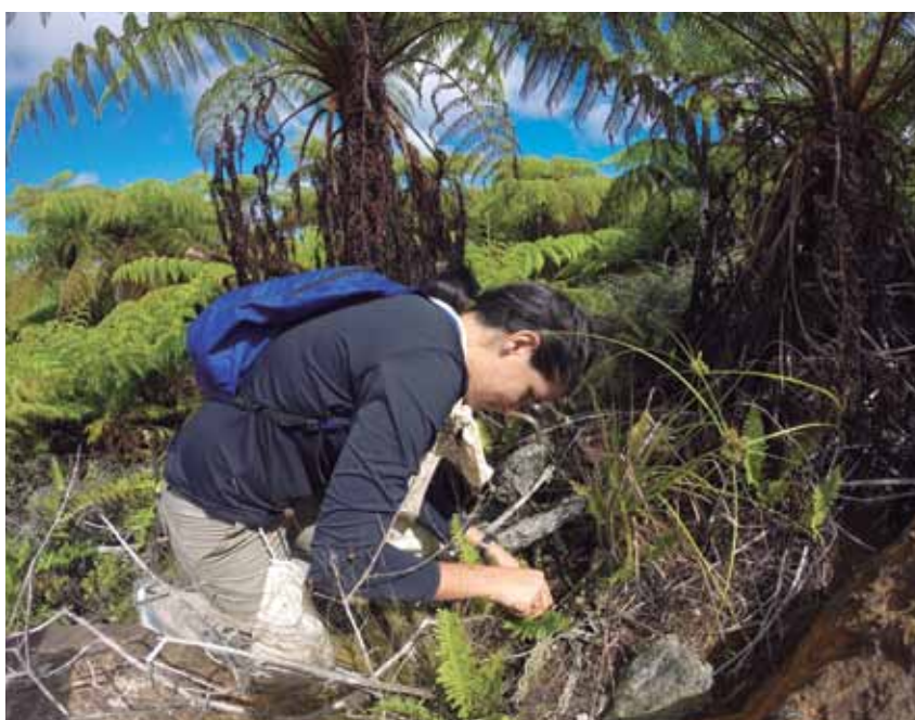
E na Ilha da Trindade