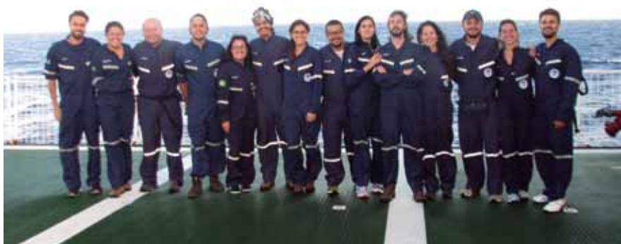
Pesquisadores da 47ª Expedição do PROTRINDADE

Em termos de botânica, Trindade é única e se destaca por possuir espécies endêmicas (identificadas somente naquela região). É o caso da Samambaia gigante, que chega a medir até seis metros de altura. Desde a década