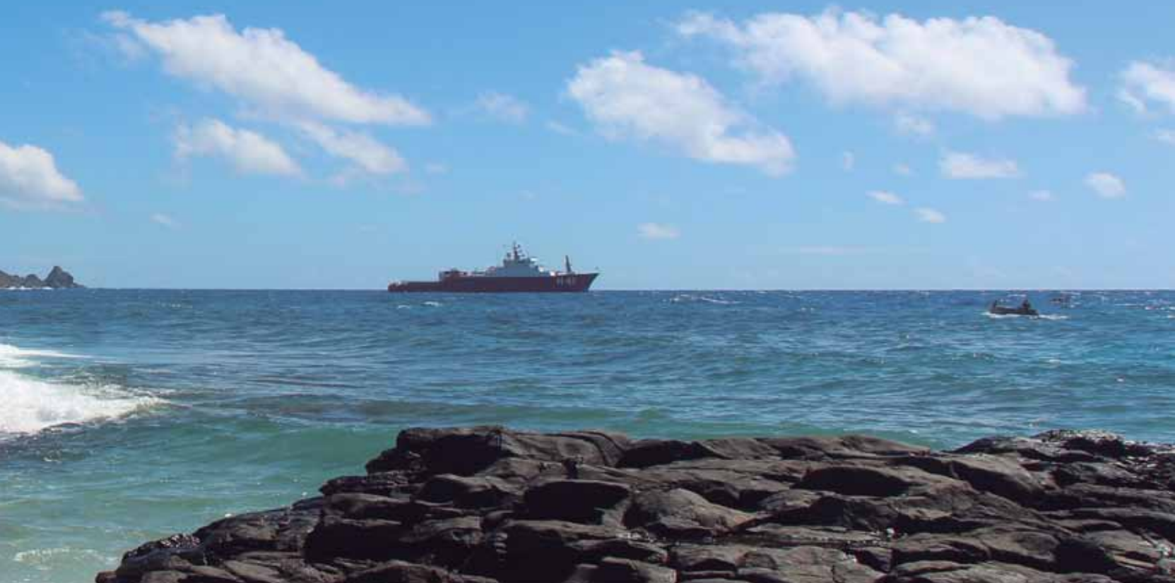
Navio Polar Almirante Maximiano fundeado na Ilha da Trindade

ado pelo projeto TAMAR e pelo Instituto Chico Mendes de Preservação da Biodiversidade (ICMbio), com o apoio da Marinha.