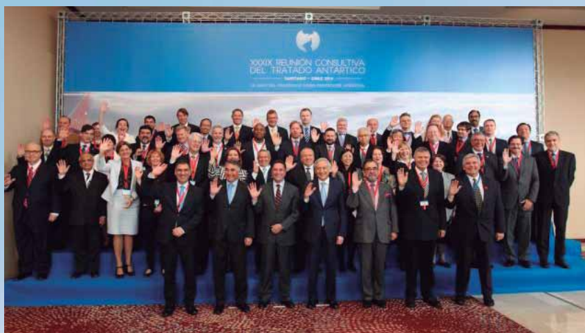
Representantes dos Países da ATCM

A Antártica, um Continente de características ímpares, está intimamente relacionada com o equilíbrio da Terra e constitui um verdadeiro laboratório natural, por conter no seu manto de gelo o registro da história do planeta. Por meio das pesquisas busca-se compreender os fenômenos da atmosfera, dos oceanos e da vida, de modo a orientar as decisões sobre o futuro do Continente Branco.