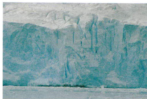
Geleira com gretas (fendas) resultantes de degelo

As ações em andamento são importantes ferramentas para o estabelecimento de políticas e estratégias para o mar, incluindo metas para mitigar os possíveis problemas decorrentes do aquecimento global. Permitirão, também, subsidiar os estudos para a montagem de nossa matriz energética, nos aspectos relacionados ao Atlântico Sul.