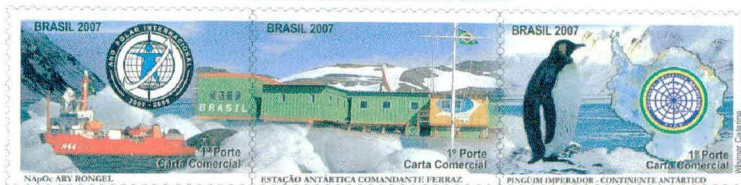
Selo comemorativo ao Ano Polar Internacional 2007/2009