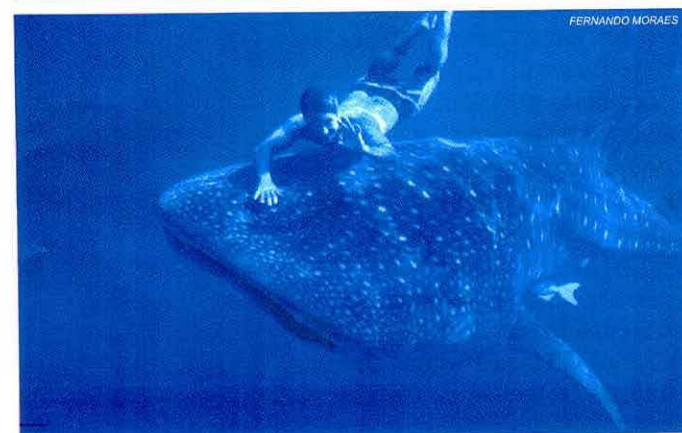
FIGURA 2: International Union for the Conservation of Nature