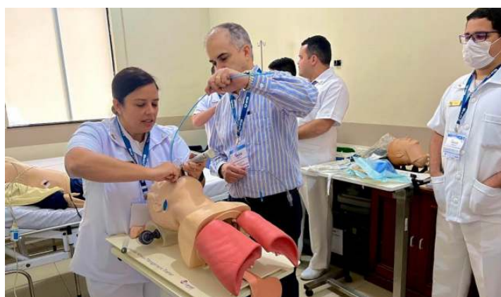
O Hospital Naval de Belém (HNBe) realizou, nos dias 27 e 28 de agosto, o Curso "Fundamental Critical Care Support" (FCCS). Este é um curso de imersão da Sociedade Norte-Americana de Medicina Intensiva que é franquiado à Associação de Medicina Intensiva Brasileira (AMIB)