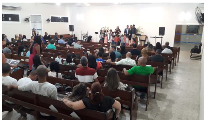
Uma celebração religiosa marcou as comemorações pelo quarto ano de criação da Capela Evangélica da Marinha em Belém