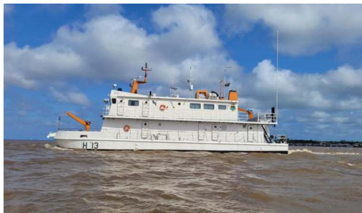
Durante a Comissão Hidrográfica VII, o Aviso Hidroceanográfico Fluvial “Rio Xingu”, meio subordinado ao Centro de Hidrografia e Navegação do Norte, apoiou pesquisadores do projeto “Sistema multiescala de detecção e modelagem de derramamento de óleo”, da Universidade Federal do Pará, coletando dados de maré e perfil de corrente em pontos ao longo do Rio Pará