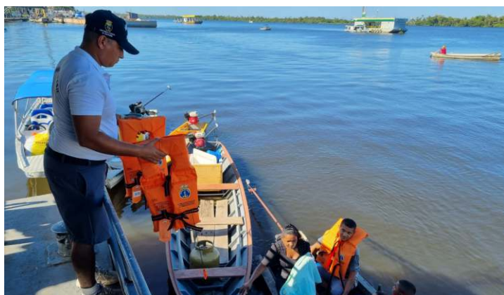
A Capitania Fluvial de Santarém apoiou a realização do Círio Fluvial de Santo Antônio, padroeiro de Oriximiná-PA, e realizou atividades de Inspeção Naval, a fim de garantir a segurança do evento