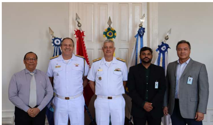
O Comando do 4º Distrito Naval recebeu equipe da Petrobras para apresentação de um projeto para exploração de petróleo na Foz do rio Amazonas, distante cerca 830 km de Belém (PA)