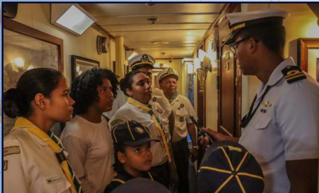
Grupo de escoteiros recebem instruções a bordo do Navio-Veleiro Cisne Branco

Durante visita a Belém (PA), o tradicional Navio-Veleiro Cisne Branco cumpriu extensa programação, que incluiu visitação pública e visitação guiada com a presença de 4.930 pessoas, nos dias 7 e 8 de agosto. A programação fez parte das comemorações da Marinha do Brasil pelos 200 anos da Independência do Brasil.