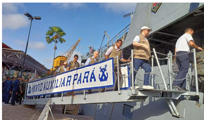
O Navio-Auxiliar "Pará", subordinado ao Comando do Grupamento de Patrulha Naval do Norte, recebeu integrantes da turma "Bicentenário da Independência", do Curso de Altos Estudos em Defesa, ministrado pela Escola Superior de Defesa, em visita a Belém (PA)