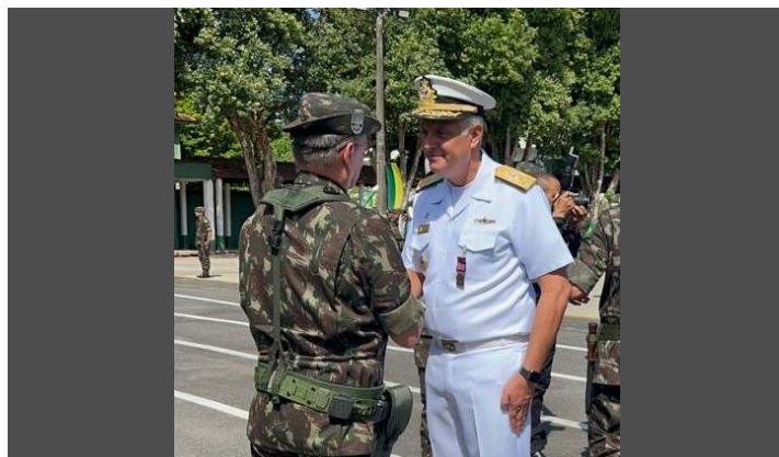
O 1º Esquadrão de Helicópteros de Emprego Geral do Norte, Organização Militar subordinada ao Comando do 4º Distrito Naval, realizou a cerimônia alusiva ao 106º Aniversário da Aviação Naval, em Belém (PA)