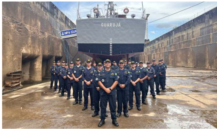
O Navio-Patrolha "Guarujá", subordinado ao Comando do Grupamento de Patrulha Naval do Norte, realizou a manobra de saída do dique "Almirante Raul Barros", na Base Naval de Val de Cães, por ocasião do fim de seu Período de Docagem de Rotina