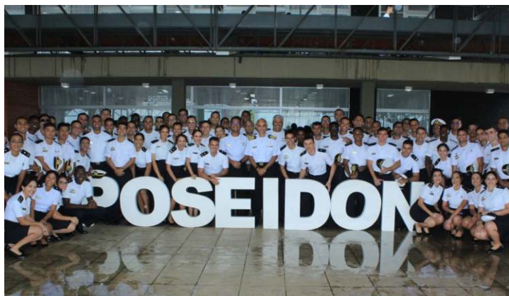
Os alunos do 3º ano da Escola de Formação de Oficiais da Marinha Mercante, do Centro de Instrução Almirante Braz de Aguiar realizaram, em Belém (PA), um almoço em comemoração aos cem dias que antecedem a cerimônia de formatura, quando irão ascender ao posto de Praticantes e Guardas-Marinhas da reserva