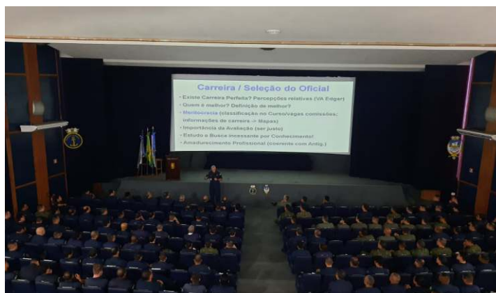
Palestra a ser proferida pelo VAITE Edgar: A carreira e os processos seletivos do Oficial de Marinha