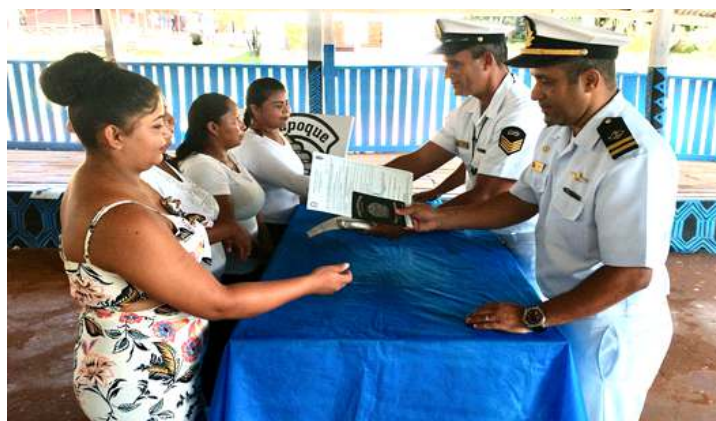
A Agência da Capitania dos Portos no Oiapoque qualificou 30 novos aquaviários na Aldeia do Manga, terra indígena Uaçá, no município de Oiapoque (AP). Os indígenas, dentre eles cinco mulheres, participaram da cerimônia de encerramento do 1º Curso de Formação de Aquaviários