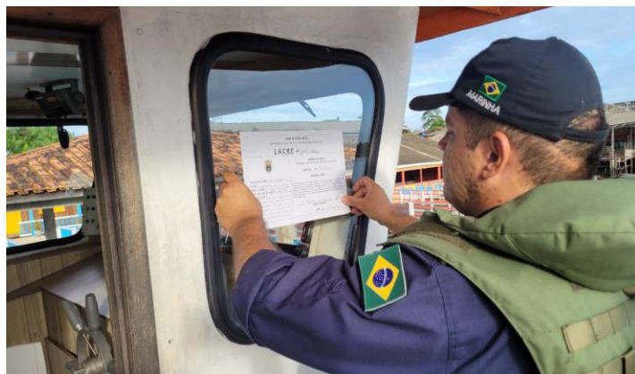
O Comando do 4º Distrito Naval, por meio de suas Capitancias e Agências subordinadas, encerrou a Operação Verão Amazônico e as ações de fiscalização do tráfego aquaviário nos Estados do Amapá, Pará, Maranhão e Piauí