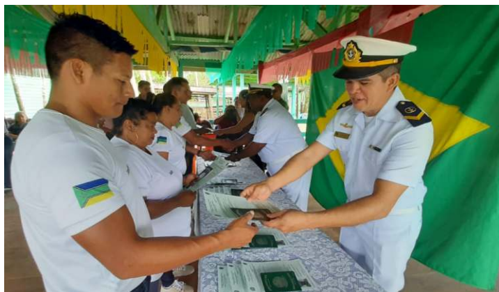
A Capitania dos Portos do Amapá realizou o curso de Formação de Aquaviários – Marinheiro Fluvial Auxiliar de Convés e de Máquinas, formando 30 novos aquaviários na comunidade Lontra da Pedreira, distrito de Macapá (AP)