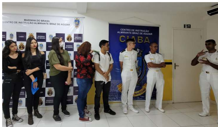
Alunos da Escola de Formação de Oficiais da Marinha Mercante, do Centro de Instrução Almirante Braz de Aguiar, participaram da 1ª Feira de Profissões do Sistema de Ensino Rosana Bastos, estabelecimento particular de ensino de Belém (PA)