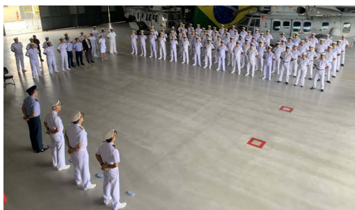
O 1º Esquadrão de Helicópteros de Emprego Geral do Norte, Organização Militar subordinada ao Comando do 4º Distrito Naval, realizou a cerimônia alusiva ao 106º Aniversário da Aviação Naval, em Belém (PA)