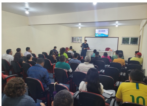
A tripulação do Aviso Hidroceanográfico Fluvial “Rio Xingu”, subordinado ao Centro de Hidrografia e Navegação do Norte, realizou atividades em prol da segurança da navegação em comunidades situadas ao longo dos rios Tapajós, Tocantins e na região dos Estreitos, no Marajó