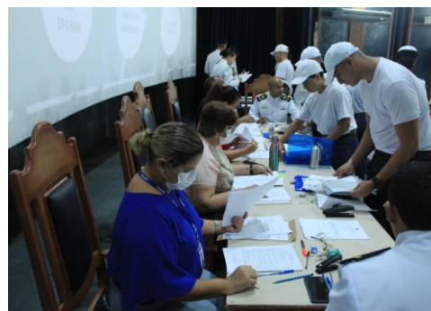
O Centro de Instrução Almirante Braz de Aguiar iniciou o período de adaptação para os candidatos aprovados no Exame de Conhecimentos, na Seleção Psicofísica e no Teste de Suficiência Física do Processo Seletivo à Escola de Formação de Oficiais da Marinha Mercante 2023