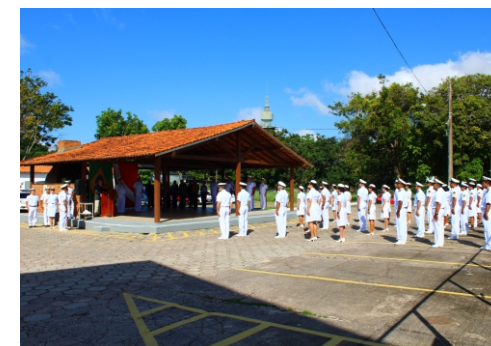
O Hospital Naval de Belém completou 64 anos de atividades no dia 31 de dezembro de 2022. A data foi celebrada com cerimônia presidida pelo Chefe do Estado-Maior do Comando do 4º Distrito Naval, Contra-Almirante Carlos Roberto Rocha e Silva Júnior, no dia 6 de janeiro