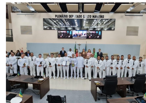
Militares da Capitania dos Portos do Amapá participaram da sessão ordinária da Assembleia Legislativa do Amapá