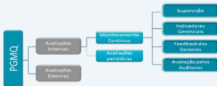
Estrutura do PGMQ.

ria, que consiste na agregação de valor e na contribuição para o alcance dos objetivos estratégicos da MB;