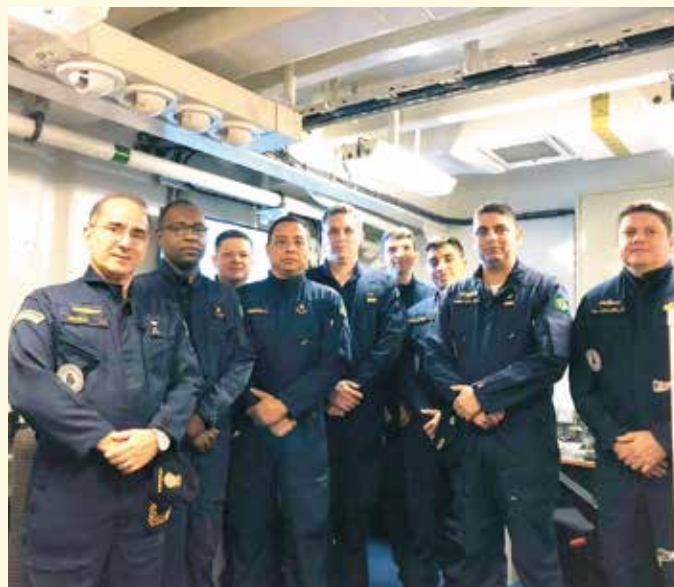
Vice-Almirante (IM) Hugo em visita ao Grupo de Intendência do Navio.

Grupo de Intendência do maior navio da MB. Durante a visita ao paiol de sobressalentes, foram apresentadas as particularidades relativas ao fornecimento de materiais, assim como o relacionamento desenvolvido entre o navio, as Comissões Navais no Exterior e as Diretorias Especializadas. Na visita à cozinha, padaria e ranchos, pôde observar a preparação das mais de 950 refeições que eram servidas no dia.