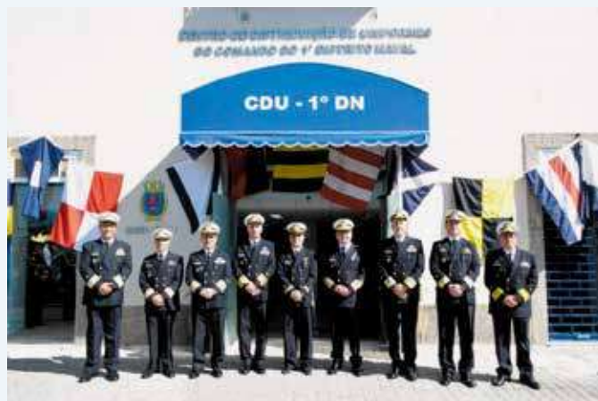
Visita do Secretário-Geral e de Almirantes Intendentes às instalações do CDU-1ºDN