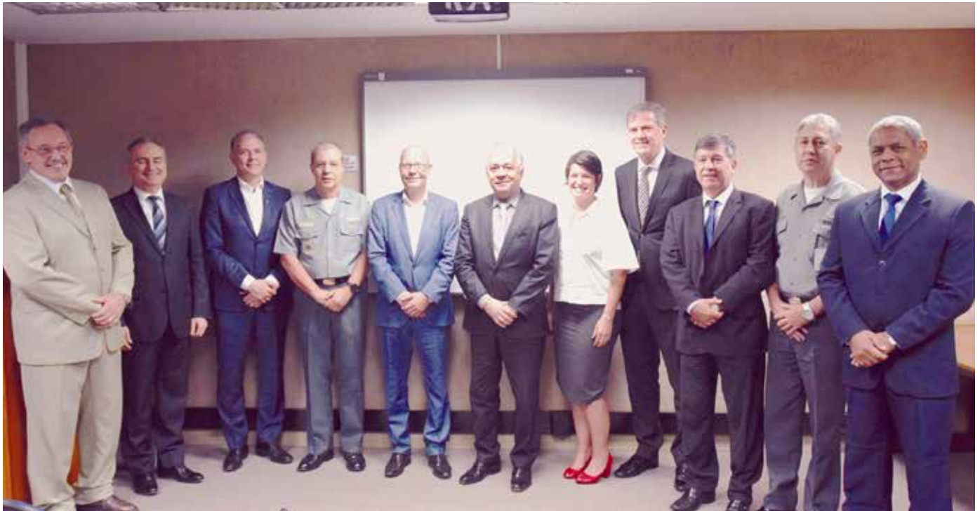
Programa Classe Tamandaré

Marinha reúne representantes do Consórcio Águas Azuis.