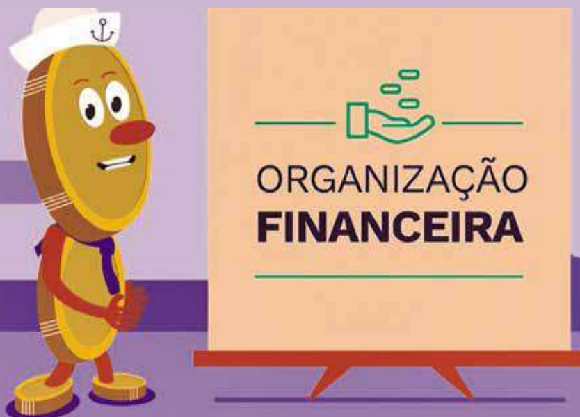
Figura 1: Tela de apresentação do vídeo sobre organização financeira

A PAPEM espera, com essas e outras ações em curso, contribuir para um maior esclarecimento do nosso pessoal sobre esse aspecto fundamental das nossas vidas que é a saúde financeira.