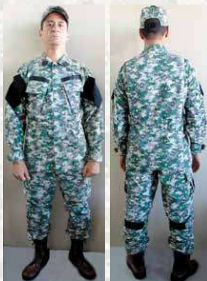
Figura 1 – Protótipo do novo camuflado

Nesta seara, está inserido o conceito da Tríplice Hélice (Universidade/Governo/Indústria), projeto o qual tem gerado resultados significativos, como é o caso do desenvolvimento do novo camuflado, que propõe incrementos no que tange à modelagem e ao tecido, agregando para este uniforme mais conforto, segurança e funcionalidades; além de um novo padrão de camuflagem para uso em ambiente urbano (figura 1). O tecido denominado Durapro produzido pela Santista (indústria) foi elaborado especialmente para atender às necessidades do Corpo de Fuzileiros Navais (CFN), com composição altamente resistente à tração e à abrasão, além de uma elevada solidez da cor, sendo bastante similar ao utilizado pelo Exército Americano. O referido tecido permite também maior mobilidade e conforto térmico, com propriedades, inclusive, antimicrobianas. Em relação à segurança, ajusta a reflexão de raios infravermelhos, diminuindo a chance de detecção do militar pelo inimigo,