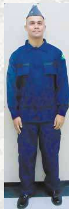
Figura 3 - Novo conjunto operativo

Tudo isso representou a preocupação constante desta Diretoria em oferecer o estado da arte de itens de SJ “M” e “U”, aumentando, por conseguinte, a proteção e satisfação dos usuários do Sistema de Abastecimento da Marinha (SAbM).