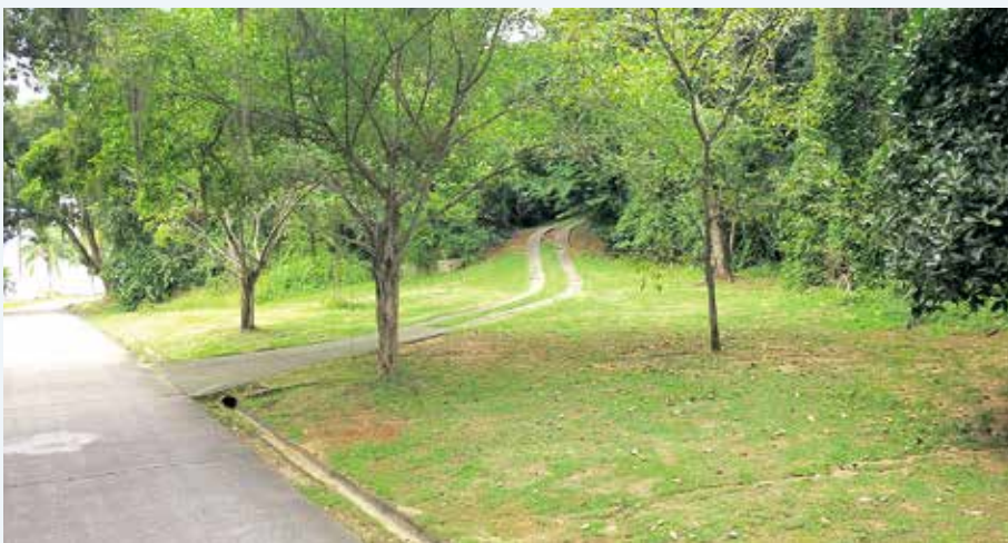
Área do novo laboratório

A construção do novo laboratório e aquisição do microcalorímetro irão melhorar significativamente a segurança do pessoal e material armazenado no CMM.