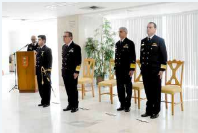
Investidura no cargo do Diretor nomeado realizada pelo Secretário-Geral da Marinha

De forma pioneira no âmbito das Forças Armadas, o CDU-1ºDN possuirá uma estação de coleta de uniformes propriamente militares inservíveis ou descartados pelos usuários, para posterior destruição e envio a cooperativas ou empresas de reciclagem, atendendo aos propósitos estabelecidos pela Política Nacional de Resíduos Sólidos