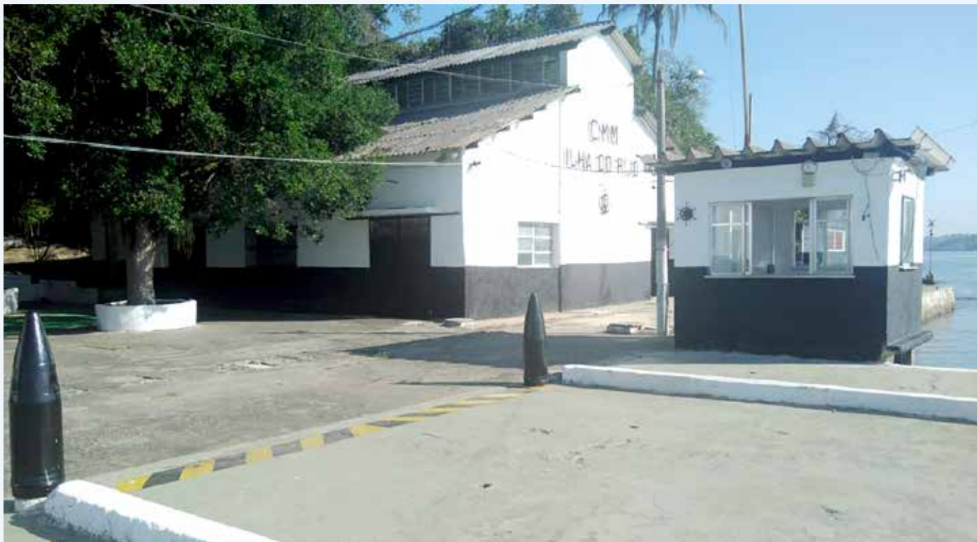
Ilha do Rijo

Início do processo para a construção do novo laboratório.