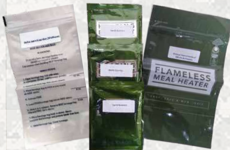
Figura 2 – Protótipo da nova Ração Alternativa de Combate

Um outro projeto de pesquisa e desenvolvimento conduzido por esta DE, atendendo a anseios antigos do CFN, consiste na nova Ração Alternativa de Combate - RAC (figura 2), cuja proposta se baseou em um novo kit, com o incremento do aporte calórico e do fornecimento de nutrientes essenciais, bem como a substituição do fogareiro convencional pelo fogareiro químico, que promove o aquecimento das refeições sem o uso de fogo.