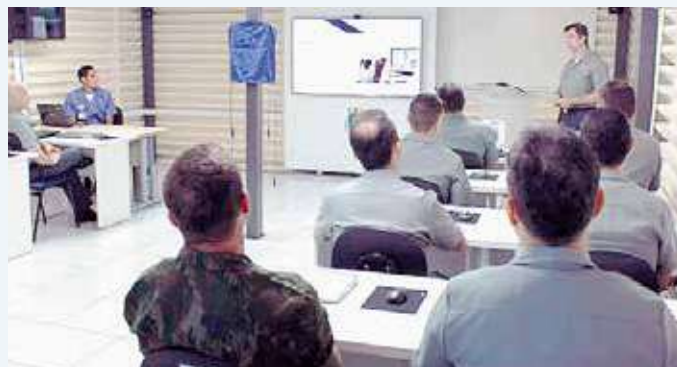
Apresentação do CMG (IM) Victor, Diretor do CIANB, sobre o CIANB Virtual.

O CeIMNa foi escolhido como OM Piloto do Projeto em razão de serem as OM da área do Comando do 3º Distrito Naval (Com3ºDN), atualmente, as maiores demandantes pelas