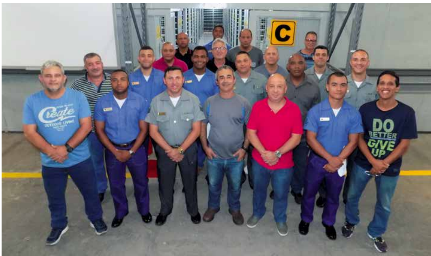
Militares e Servidores Cíveis da tripulação que trabalharam no inventário e na revitalização do paiol "CHARLIE"

Como fruto do Programa de Inventário e Revitalização de Paióis (PIRP), iniciado em 2006, o Depósito de Sobressalentes da Marinha no Rio de Janeiro (DepSMRJ) inaugurou, no dia 11 de outubro de 2019, o paiol "Charlie", cujo objetivo era segregar os itens de sobressalentes com maior demanda nos últimos 10 anos.