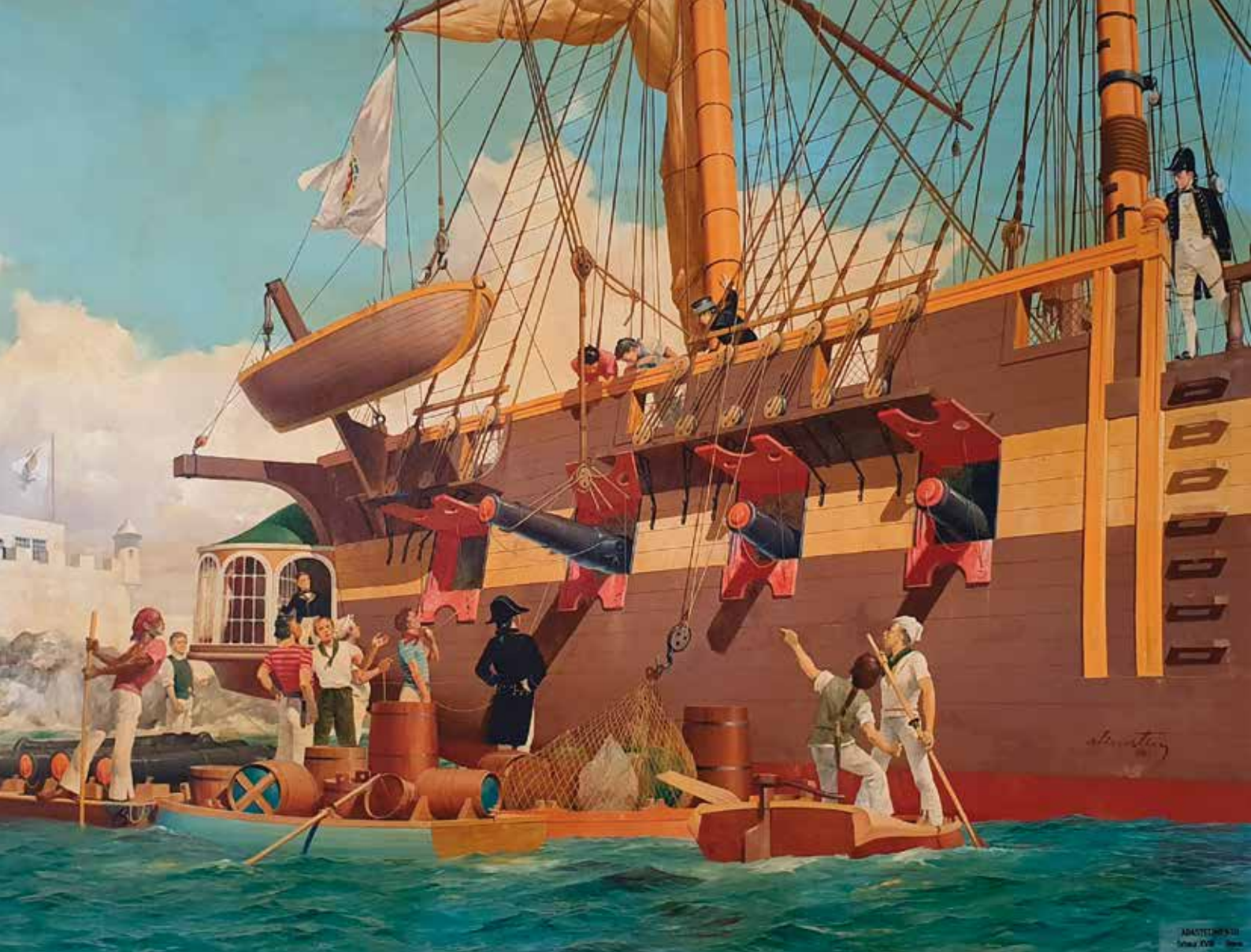
“O Abastecimento”, óleo de Álvaro Martins, pintado em 1986, retratando a faina de abastecimento de gêneros à fragata “Nichteroy” no século XVIII.