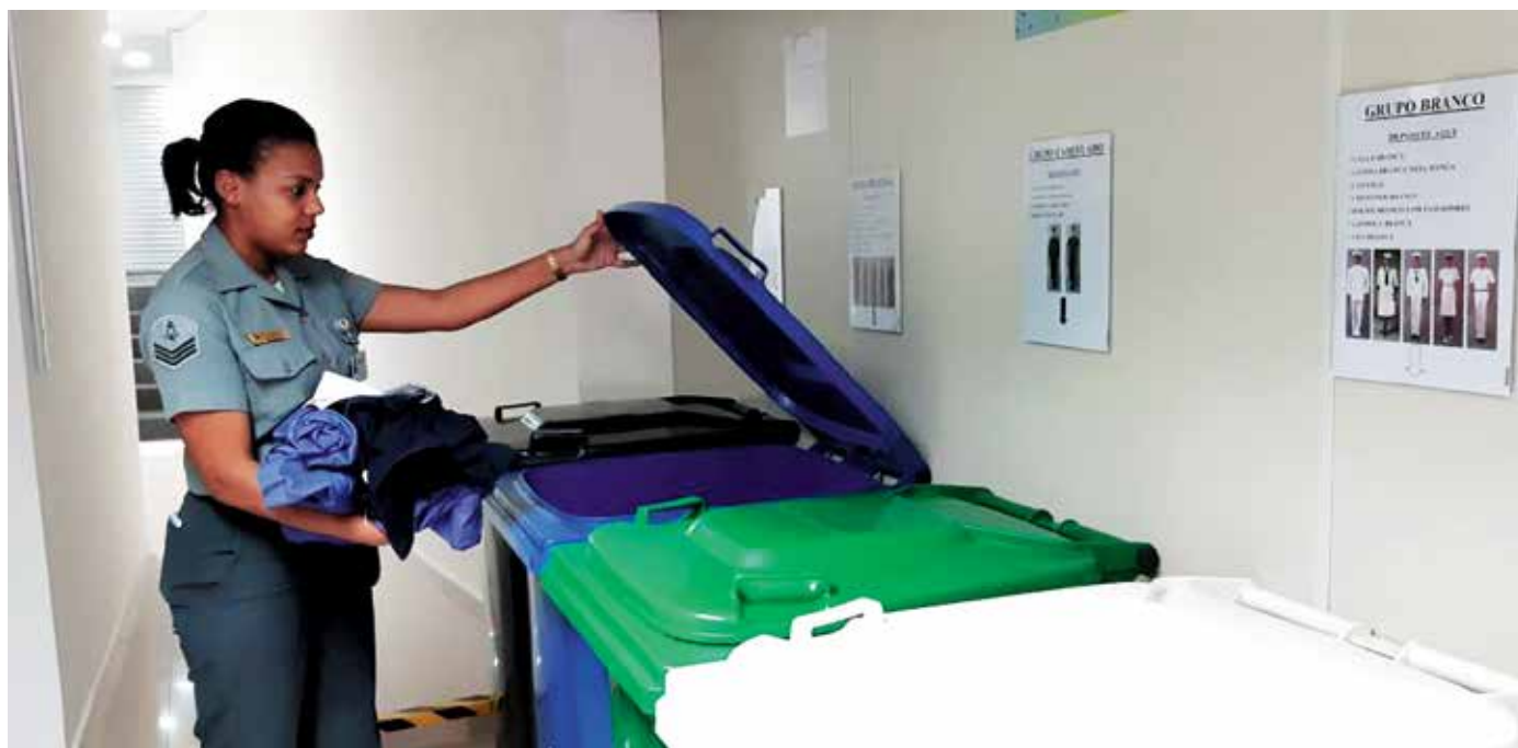
Militar, promovida à graduação de 3º Sargento, descarta uniformes do grupo azul

No atual contexto de ações voltadas para o aprimoramento da cadeia logística de fardamento do Sistema de Abastecimento da Marinha (SAbM), em especial de sua logística reversa, o Centro de Distribuição de Uniformes do Comando do 1º Distrito Naval (CDU-1ºDN) inaugurou no mês de setembro de 2019, de forma pioneira no âmbito das Forças Armadas, um Posto de Coleta de Uniformes exclusivamente militares, voltado ao descarte, posterior destruição e envio a cooperativas ou empresas de reciclagem. Esse posto conta com o apoio do Depósito de Fardamento da Marinha no Rio de Janeiro (DepFMRJ), atendendo aos propósitos estabelecidos pela Política Nacional de Resíduos Sólidos.