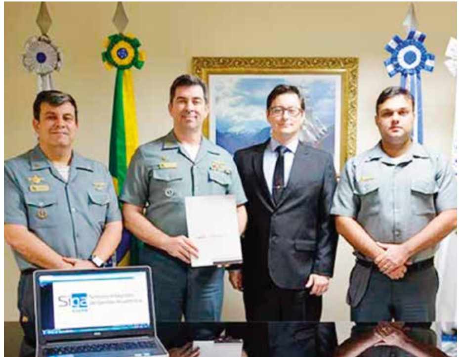
Diretor do CIANB recebe a licença de uso perpétuo do Sistema Integrado de Gestão Acadêmica (SIGA)

O Sistema permitirá, entre outras funcionalidades, que o usuário realize tanto pesquisa parametrizada quanto sua inscrição nos cursos conduzidos pelo CIANB, por meio de acesso