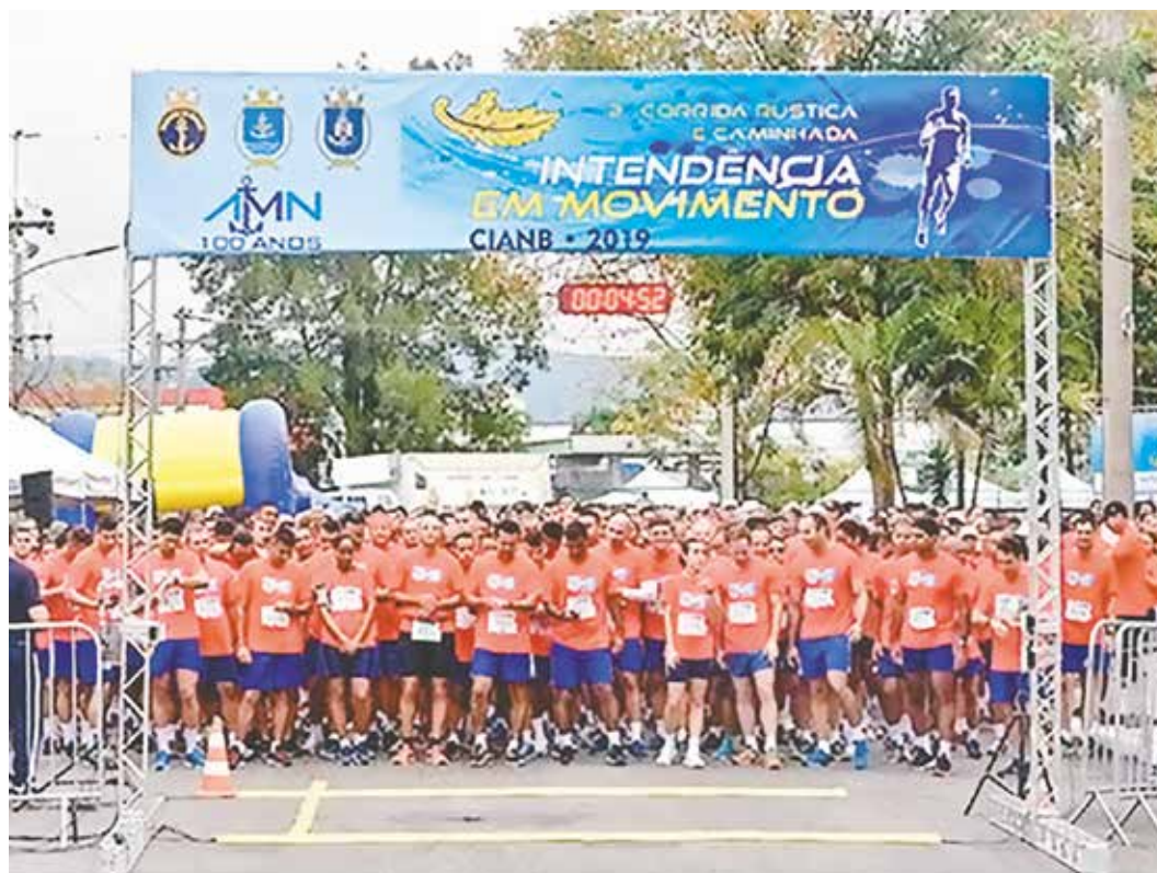
Participantes aguardam a largada do percurso de cinco quilômetros