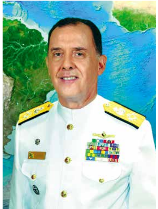
Comandante da Marinha Almirante de Esquadra ILQUES Barbosa Junior

de aplicação no âmbito das Marinhas e ante o dinamismo que o cenário geopolítico impõe. De fato, não obstante a peculiar necessidade de dispor de grandes efetivos e de modernos sistemas de armas, ganha um especial relevo todo o conjunto de atividades que gerenciam os recursos logísticos destinados a garantir os mais variados níveis de prontidão exigidos em combate.