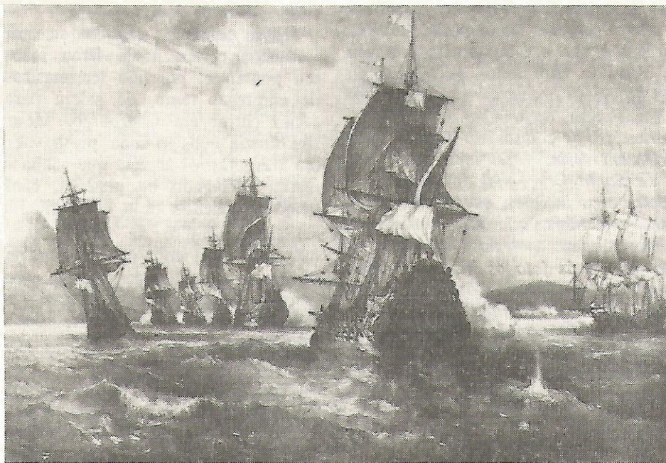
Cena do forçamento da Cidade do Rio de Janeiro pela esquadra de Duguay-Trouin. Reprodução de quadro a óleo existente no Museu da Marinha Francesa, em Paris.