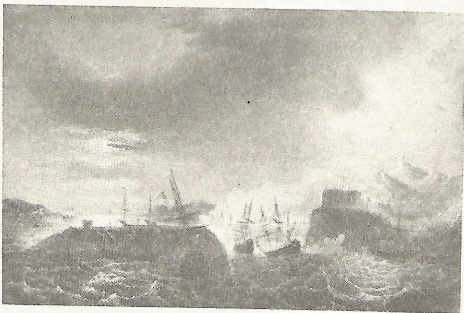
Cena do forçamento da Cidade do Rio de Janeiro pela esquadra de Duguay-Trouin. Reprodução de quadro a óleo existente no Museu da Marinha Francesa, em Paris.