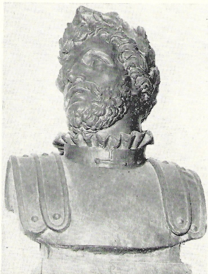
Herma de Camões existente no Instituto Histórico e Geográfico Brasileiro