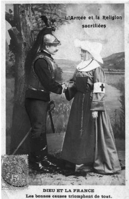
FIGURA 5 – Cartão-postal. L'Armée et la Religion sacrifiées / Dieu et la France / Les bonnes causes triomphent de tout , não circulado (Autor/editor não identificados).

mesmo botões excessivamente brilhantes” (HASTINGS, 2014, p.169). Além disso, no relatório, identificou a importância de seus obuseiros e das peças de artilharia pesada, dos quais oficiais superiores em Paris não davam grande importância. Na França, os militares continuaram a considerar a guerra como um torneio em que “ganhavam o melhor”. “O combate continuava a ser um assunto de honra no qual reinavam os princípios e a moral cavalheiresca. Conta-se mais com a tradição guerreira do sangue dos antepassados do que com os progressos da técnica” (FERRO, 2014, p. 133).