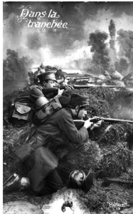
FIGURA 7 – Cartão-postal n. 19, série Patrie . Dans la tranchée , manuscrito pelo remetente em 20 jan. 1915 (Autor/editor não identificados).

Na Figura 7, podemos perceber que os combatentes estão enfileirados em uma trincheira claramente vulnerável e exposta. Certamente, se não estivessem em um estúdio fotográfico, seriam alvos fáceis. Percebe-se as explosões ao fundo na tela pintada e a ambientação que tenta retratar um combate em uma trincheira. A imagem também mostra o olhar severo do combatente, com armas em posição e um detalhe na parte inferior, um pickelhaube , capacete usado pelo Exército alemão, o que denota que o soldado francês abatera seu inimigo e possuía o prêmio por tal feito. Ain-