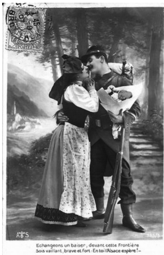
FIGURA 1 – Cartão-postal. Echangeons un baiser, devant cette Frontière / Sois vaillant, brave et fort: En toi l'Alsace espère! , postado em 07 ago. 1907 (Autor/editor não identificados).

Neste postal, a questão dos territórios perdidos na Guerra Franco-Prussiana é latente, o desejo expresso pelo casal é uma