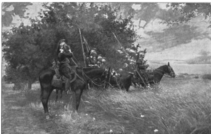
FIGURA 4 – Cartão-postal. Les Dragons , postado em 31 ago. 1915 (Autor/editor não identificados).

joelhos, suplicando clemência e nitidamente derrotado. A leitura da imagem e da legenda enfatizam a incapacidade do alemão de chegar a Paris, onde figura a Torre Eiffel ao fundo, além de desqualificar o combatente alemão por meio de palavras e imagens. Fica evidente nas representações o enaltecimento da imagem militar, e o caráter apologético ao militarismo. Além disso, os postais reafirmam concepções segundo as quais