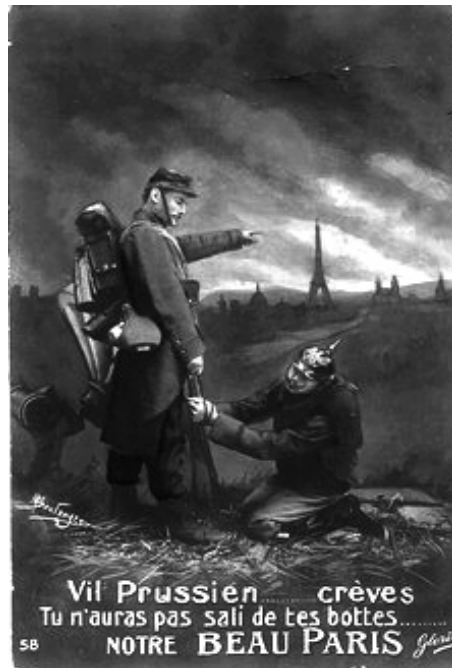
FIGURA 2 – BOULANGER, M. Cartão-postal, série Gloria. Le boche crève d'un coup dans l'Aisne , postado em 29 dez. 1914.