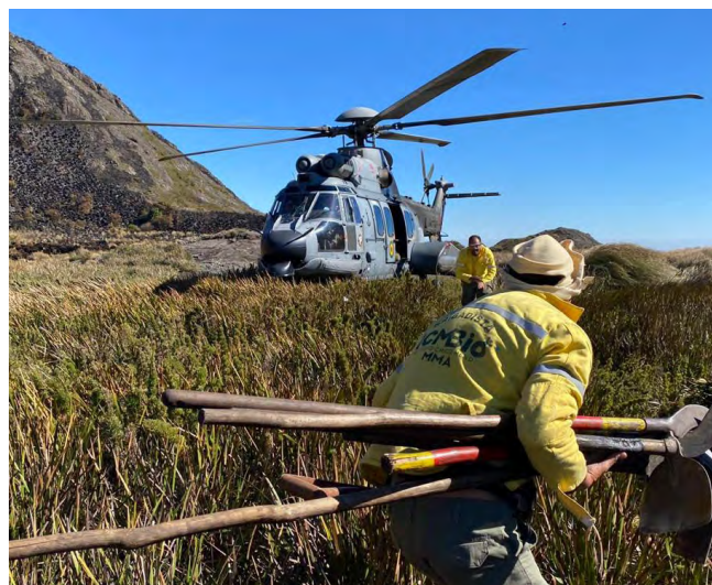
EsqdHU-2 em ação de resgate aos brigadistas do Instituto Chico Mendes de Conservação da Biodiversidade

coordenado entre os envolvidos contribuiu para extinguir os focos de incêndio e diminuir os danos ao meio ambiente na Área de Proteção Ambiental da Serra da Mantiqueira. 🌿