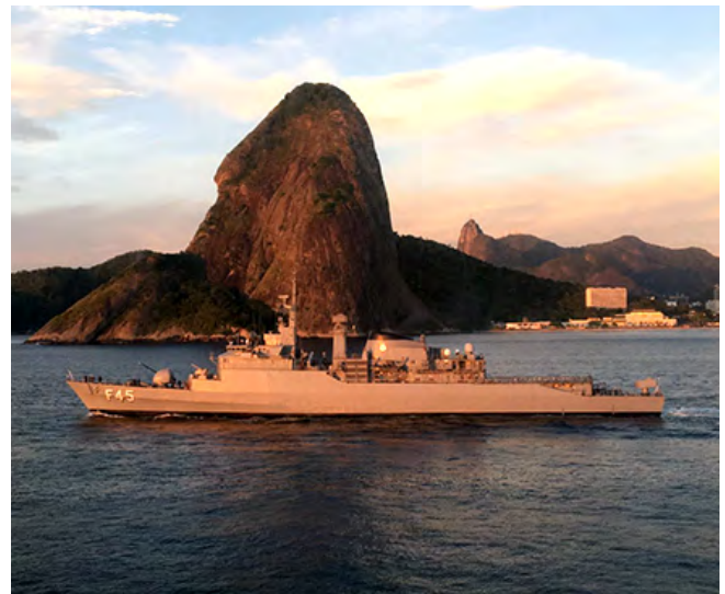
“União” durante alinhamento do sistema de armas

a comissão, além da obrigatoriedade do uso de máscara facial por todos os militares. ✪