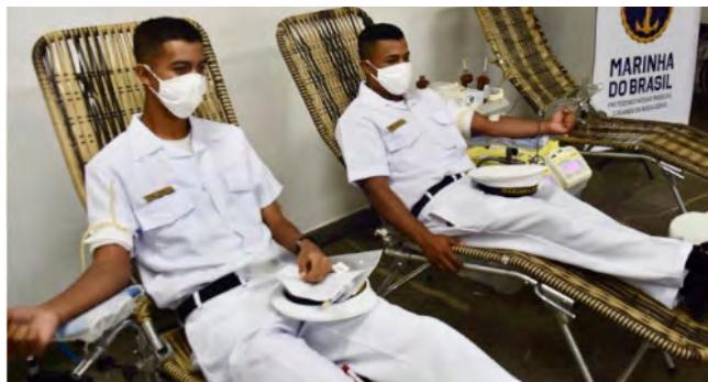
Capitania dos Portos do Ceará realizou campanha de doação de sangue em parceria com o Centro de Hematologia e Hemoterapia do Ceará