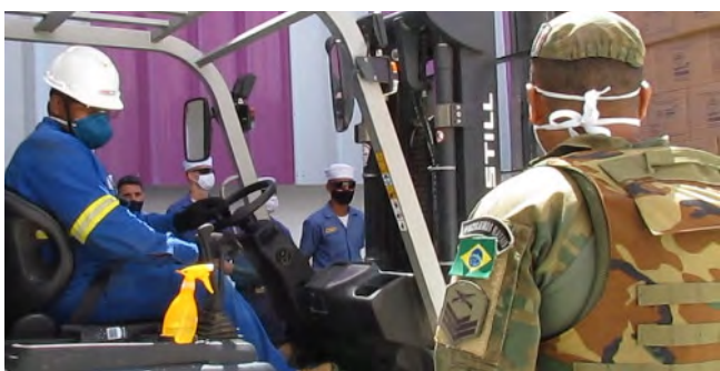
Militares do Centro de Intendência da Marinha em Salvador (CeIMSa) realizaram o transporte de cinco mil litros de álcool em gel 70% do complexo industrial do SENAI CIMATEC, em Camaçari (BA), até as instalações do CeIMSa. Militares do Grupamento de Fuzileiros Navais de Salvador fizeram a escolta e segurança do material