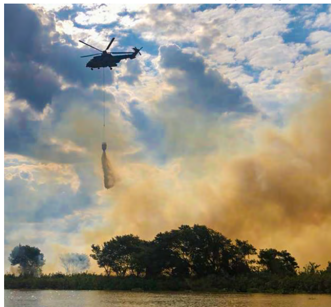
Ação de bambi bucket com a aeronave Super Cougar, da MB

EB; Blackhawk e Hércules , da FAB. As aeronaves são empregadas em voos de reconhecimento, transporte de militares/brigadistas e lançamentos de água. 🌿