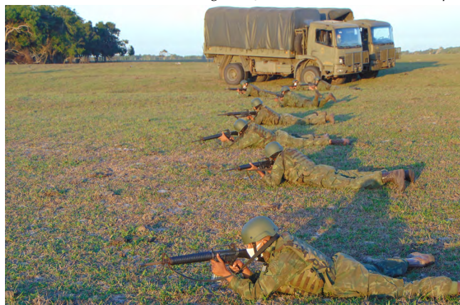
Segurança de Zona de Desembarque

execução de comboios operativos, realizadas pelo Batalhão Logístico de Fuzileiros Navais em coordenação com a Companhia de Polícia; e a operação de Zona de Desembarque (ZDbq) pela Companhia de Apoio ao Desembarque, sendo estabelecido o Posto de Coleta de Prisioneiros de Guerra pela Companhia de Polícia e a necessidade de destruição de obstáculos pelo Batalhão de Engenharia na área da ZDbq. 🇺🇵