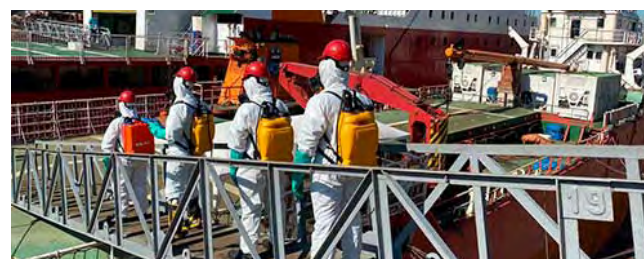
A Unidade de Descontaminação Volante da Esquadra realizou ações preventivas no Navio de Apoio Oceanográfico "Ary Rongel", que se encontrava no Arsenal de Marinha do Rio de Janeiro