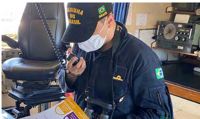
O Navio-Patrolha "Graúna", subordinado ao Comando do Grupamento de Patrulha Naval do Nordeste, realizou ações de conscientização sobre medidas de prevenção ao novo coronavírus, no âmbito da Operação "Covid-19"