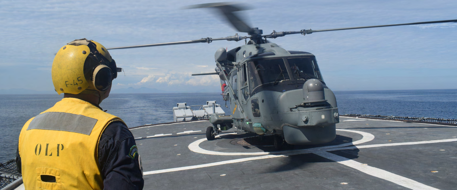
Fragata “União” opera com aeronave AH-11B

Durante a ação, foram realizados exercícios operativos com o objetivo de assegurar a precisão do armamento