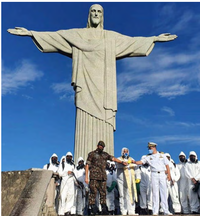
A Marinha e o Exército, sob coordenação do Comando Conjunto Leste, realizaram a capacitação e a desinfecção do Cristo Redentor, no Rio de Janeiro (RJ)