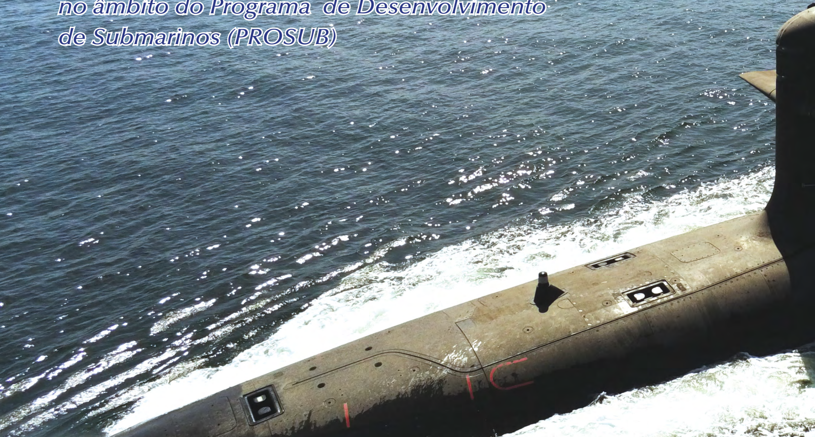
S40 realiza provas de mar, navegando na superfície

Mais uma etapa importante foi cumprida no âmbito do Programa de Desenvolvimento de Submarinos (PROSUB)