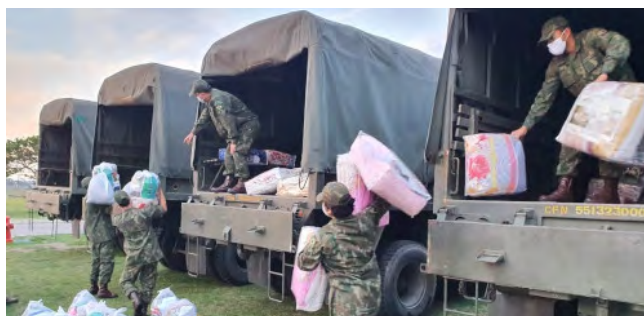
O Grupamento de Fuzileiros Navais do Rio Grande (RS) realizou a entrega de kits contendo uma cesta básica, um conjunto de máscaras, um conjunto de meias e um edredom para alunos do Centro de Convívio dos Meninos do Mar