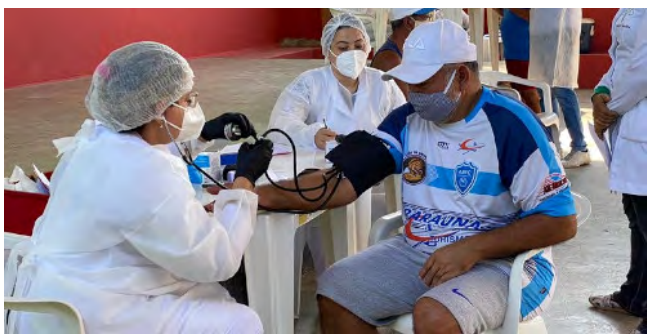
A Capitania Fluvial de Mato Grosso apoiou a Operação "Ribeirão sem Covid", em Cuiabá (MT). A ação foi realizada em duas frentes, sendo uma no rio Cuiabá e outra no Centro Cultural Antônio Lopes