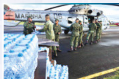
O tweet mais curtido foi sobre o apoio da Marinha às ações do Ministério do Desenvolvimento Regional e o Ministério da Defesa para mitigar os efeitos das fortes chuvas no RJ, no ES e em MG. A publicação teve 1 mil curtidas e 136 retweets.