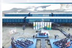
No Youtube, o vídeo mais curtido foi o da reinauguração da Estação Antártica Comandante Ferraz. O clipe teve 4.050 visualizações e 857 comentários.