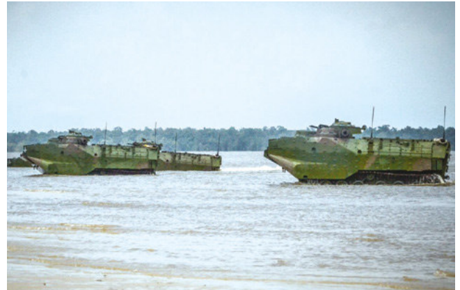
CLAnfs desembarcam na praia