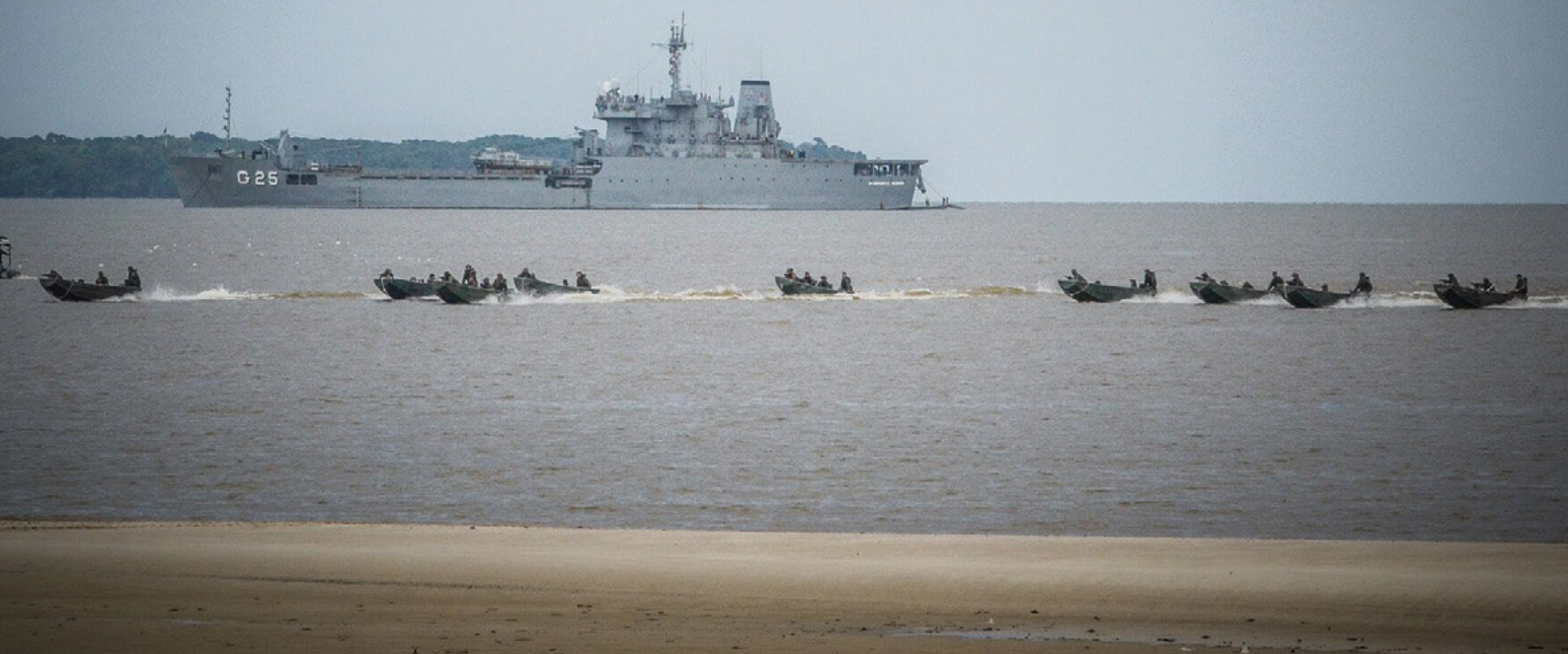
Fuzileiros Navais simulam ataque ao inimigo

© “Aderib” integrou meios e pessoal para demonstrar a capacidade do Poder Naval em regiões ribeirinhas