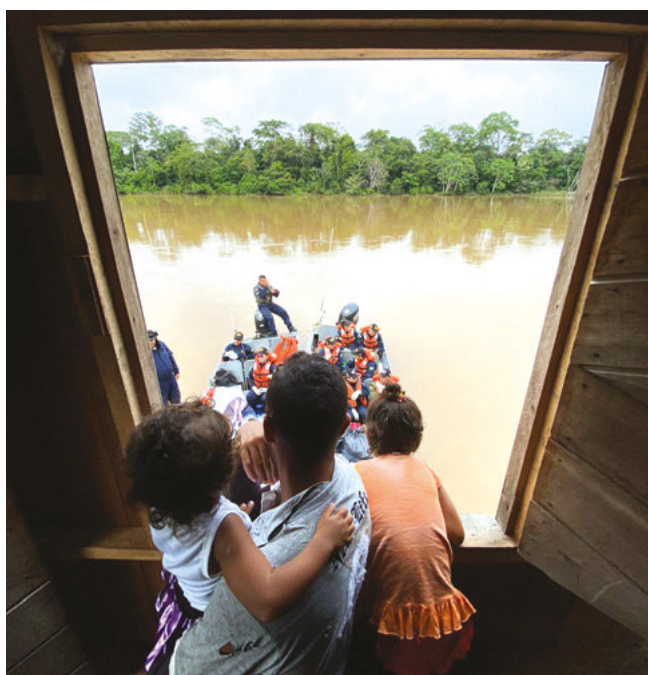
Ribeirinhos aguardam a chegada do NAsH “Doutor Montenegro”

Durante a Operação “Acre”, que ocorrerá até o dia 30 de abril, o navio prestará atendimento às comunidades isoladas dos municípios de Juruá, Itamaraty, Carauari, Eirunepé, Ipixuna e Guajará, no Amazonas; e de Cruzeiro do Sul, Rodrigues Alves, Porto Walter e Marechal Thaumaturgo, no Acre; todas localizadas no Rio Juruá. Serão oferecidas consultas médicas e odontológicas, exames clínicos e laboratoriais, procedimentos de enfermagem, cirurgias de pequeno porte, pré-natal, exames de mamografia e raios-x, palestras educativas, distribuição de medicamentos e atenção farmacêutica. A previsão é que sejam atendidas de 15 a 20 mil pessoas. ✿