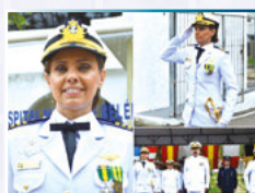
No Facebook, o post mais curtido foi da Capitão de Mar e Guerra Mônica Luna, primeira mulher a assumir a direção de uma Organização Militar na área do Comando do 4º Distrito Naval. A publicação recebeu 24.228 curtidas e 2.059 compartilhamentos.