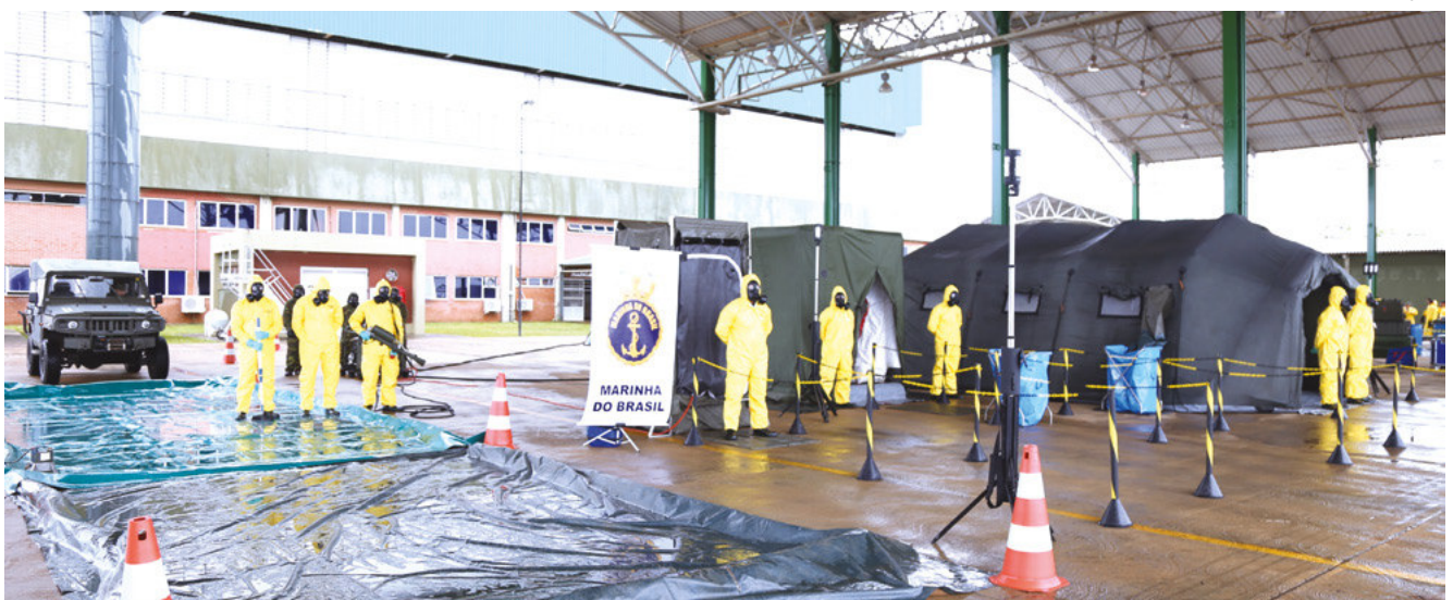
Área de descontaminação

No que tange à capacitação de pessoal, a Marinha do Brasil dispõe de dois cursos: um básico, com duração de três meses e meio, e outro avançado, com duração de um mês, ambos conduzidos no Centro de Instrução Almirante Sylvio de Camargo. 🇮🇵