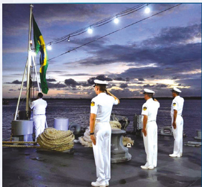
No Instagram, o post mais curtido foi a foto do cerimonial à Bandeira realizado a bordo da fragata "Constituição". A publicação recebeu 36.784 curtidas e 274 comentários.