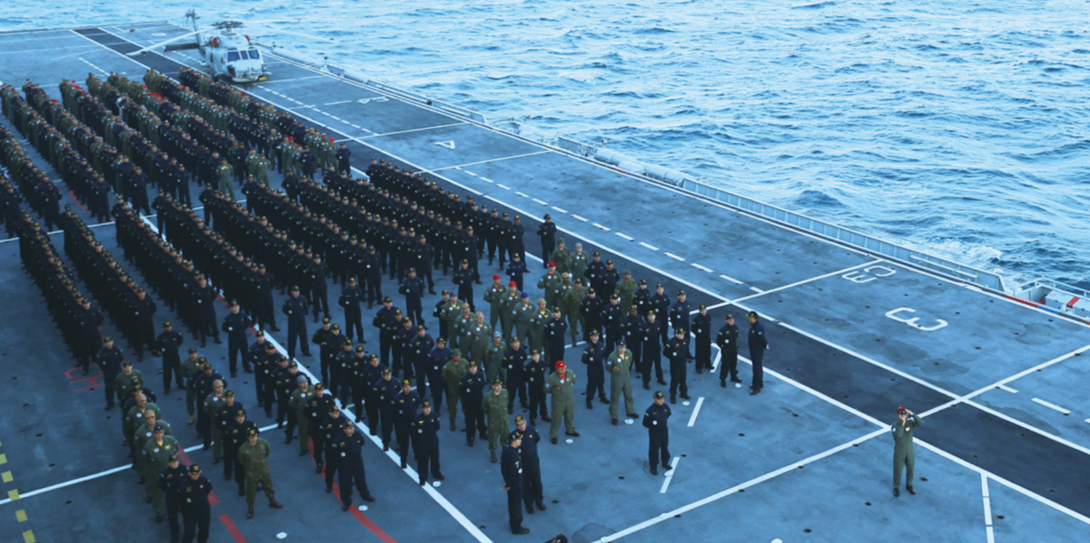
Tripulação formada no convoo do PHM “Atlântico”

A comissão fez parte da 3ª fase da Operação “Amazônia Azul - Mar Limpo é Vida!”