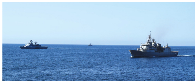
Quatro países empregaram meios nos exercícios