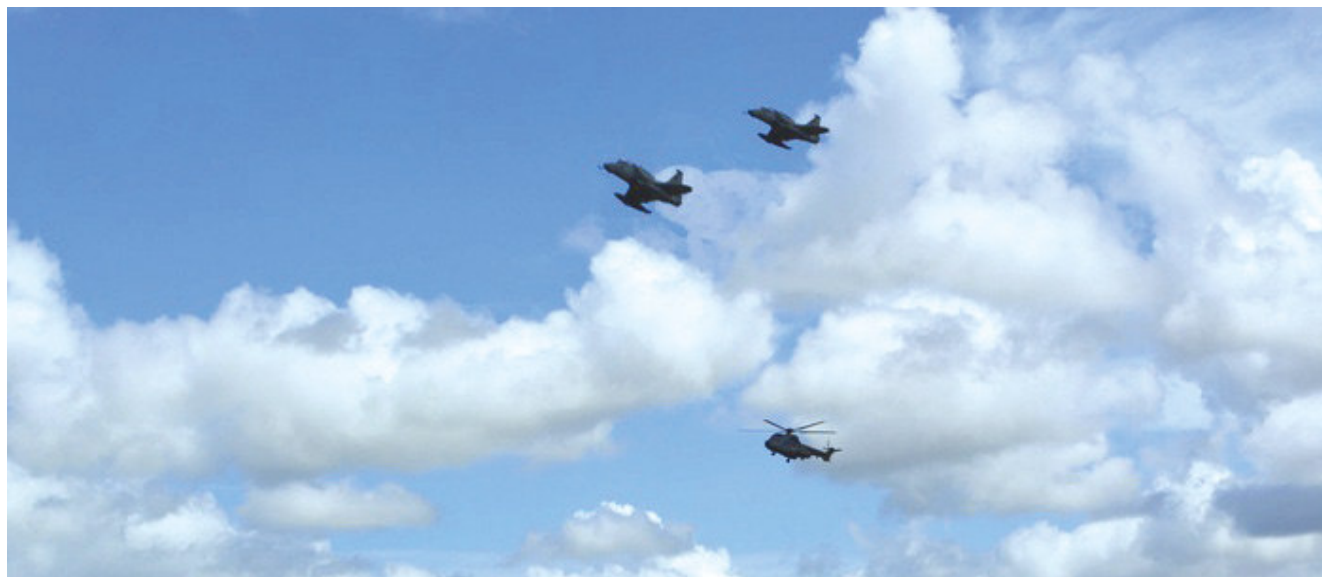
UH-15 em voo de infiltração e ataque com escolta de aeronaves AF-1

O feito está dentro do contexto de aprimoramento doutrinário e integração dos meios da Força Aeronaval, sempre com o foco de apoiar a Esquadra e o Corpo de Fuzileiros Navais. ✪