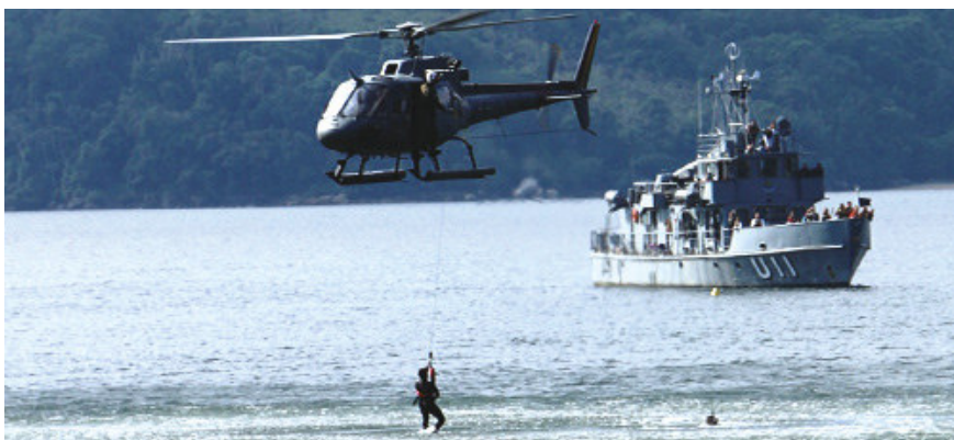
A Marinha empregou meios materiais e humanos para os exercícios

A programação do evento teve início no dia 11, com a realização de aulas práticas de moto aquática para a capacitação na categoria “Motonauta”. O dia 12 foi reservado às práticas do “Dia de Mar”, ocasião em que os participantes vivenciaram as possíveis situações presentes em caso de um acidente com embarcações. Na oportunidade, foram passadas instruções como a utilização de equipamentos e sistemas de combate a incêndio, coletes salva-vidas, noções de primeiros socorros, meteorologia, assim como a realização de exercício de abandono e de resgate de homem ao mar. A MB cedeu recursos humanos e materiais para os treinamentos. O dia 13 foi dedicado a palestras e o encerramento ocorreu no dia 14 com a realização de exames para arrais-amador, mestre-amador e capitão-amador. ✪