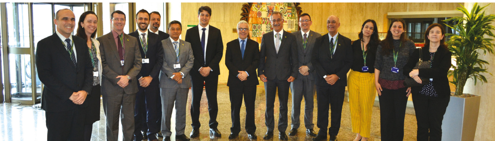
Delegação do Brasil no Grupo de Trabalho sobre GEE da IMO

Entre os assuntos tratados, destacaram-se a avaliação de procedimentos para medir os impactos nos Estados das medidas para redução da emissão de gases do efeito estufa; a finalização da minuta de termos de referência para o 4º Estudo sobre GEE provenientes de navios; a consideração de propostas visando à redução da poluição atmosférica causada por embarcações em curto, médio e longo prazos; e a elaboração de ações relativas ao desenvolvimento da capacitação, da cooperação técnica e pesquisa e desenvolvimento. 🌐