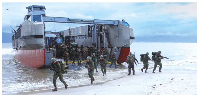
Militares da Marinha do Brasil e Marinha Nacional da França chegam à Marambaia

A Operação “Joana D’arc” foi uma oportunidade de trocar conhecimento, aperfeiçoar e colocar em prática as doutrinas militares preestabelecidos para os treinamentos propostos. Também visou promover o intercâmbio cultural entre os militares das duas nações.