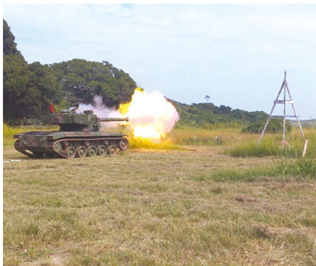
Carro de Combate atirando com canhão de 105mm

O propósito do exercício foi treinar os militares que operam as viaturas nos diversos procedimentos de tiro, de forma a manter o alto grau de preparo e prontidão da unidade. ✪