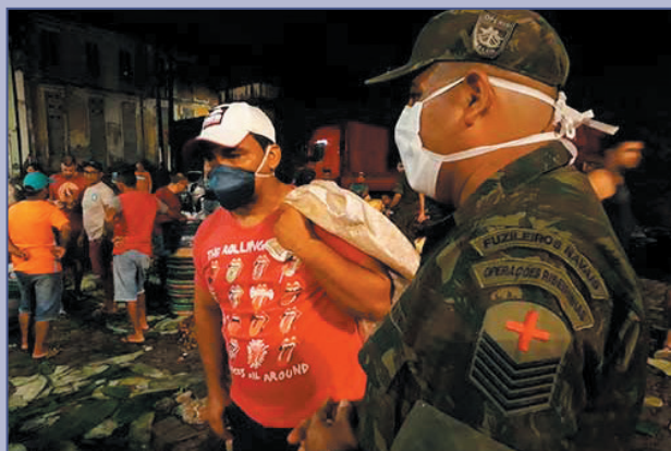
Militares do 2º Btl Op Rib promoveram ação de conscientização em mercado público de Belém

O 2º Batalhão de Operações Ribeirinhas promoveu, ainda, ação de conscientização sobre medidas preventivas no combate à propagação do novo coronavírus no mercado Ver-o-Peso, em Belém-PA. O local é conhecido pelo comércio de peixe e açaí, praticado pela população ribeirinha, que vive em regiões isoladas e, por isso, tem acesso limitado a informações. A iniciativa teve como objetivo eliminar o medo que provém da desinformação e orientar quanto aos cuidados necessários com apoio de militares da área de saúde.