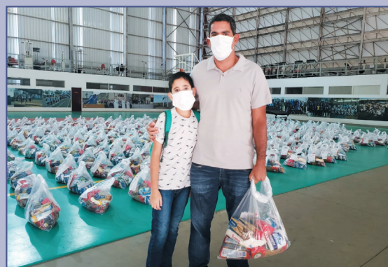
No CIASC, foram distribuídas mil cestas básicas aos jovens do PROFESP e seus familiares

No dia 9 de abril, o Centro de Educação Física Almirante Adalberto Nunes distribuiu kits de alimentação a 500 famílias das crianças e adolescentes que fazem parte do Programa Forças no Esporte (PROFESP) e do Projeto João do Pulo atendidos pela OM. No Centro de Instrução Almirante Sylvio de Camargo foram entregues mil cestas básicas às crianças e jovens atendidos pelo PROFESP na OM, nos dias 14 e 15 de abril.