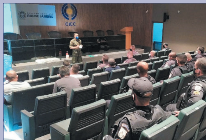
Integrantes das Polícias Civil e Militar, da Defesa Civil, dos Bombeiros e funcionários administrativos das instituições participaram das capacitações