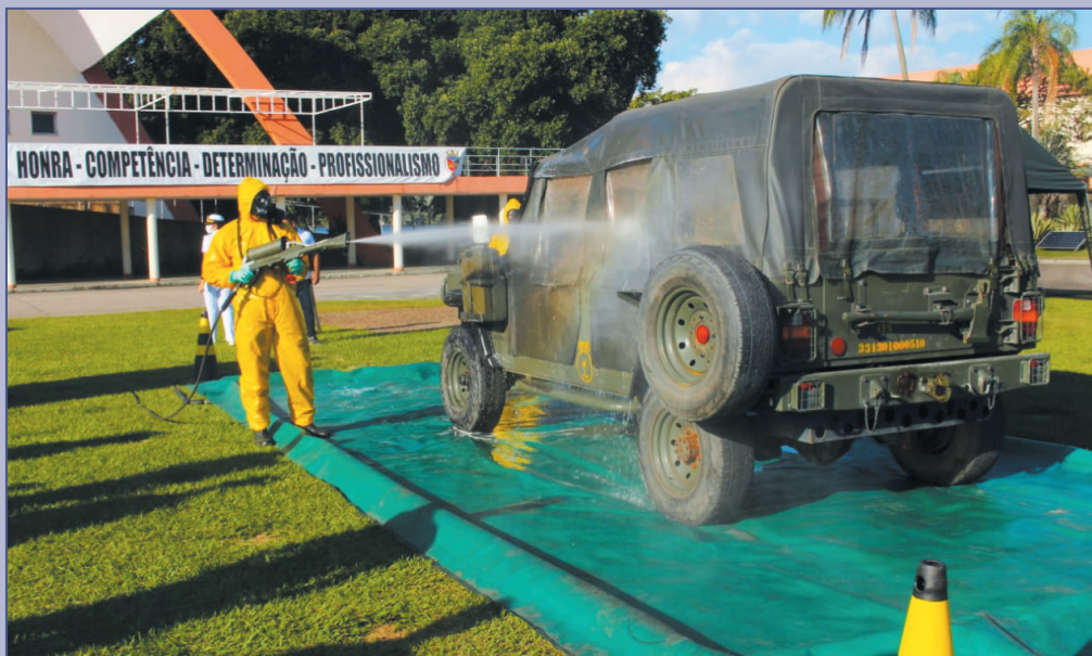
A Marinha do Brasil ministrou diversas capacitações com instruções teóricas e práticas

A Marinha do Brasil (MB) realizou diversas capacitações ao longo dos meses de abril, maio e junho. No Centro de Instrução Almirante Sylvio de Camargo (CIASC), o Estágio de Qualificação Técnica Especial de Atuação contra a Proliferação da Covid-19 da MB qualificou mais de 500 alunos brasileiros e de nações amigas. Realizado pela Escola de Defesa Nuclear, Biológica, Química e Radiológica (NBQR) e com sua versão internacional coordenada pelo Centro de Operações de Paz de Caráter Naval, do CIASC, o estágio subsidiou militares da MB e de 21 nações amigas com conhecimentos detalhados sobre agentes biológicos e o novo coronavírus. A atividade foi realizada no formato de Ensino a Distância por meio da plataforma Moodle , disponibilizada em três idiomas: português, inglês e espanhol. No início de abril, já haviam sido qualificados 41 militares da Marinha do Brasil e do Exército Brasileiro no Estágio.