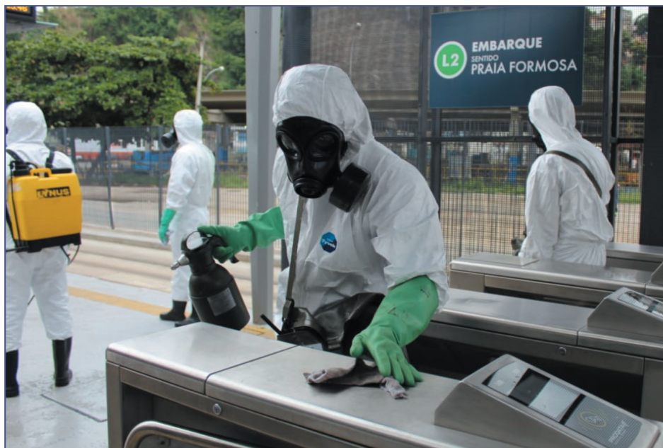
Estações de VLT do Centro do Rio passaram por desinfecção nos dias 15 e 16 de abril

Como parte das ações da “Operação Grande Muralha”, as Organizações Militares do Corpo de Fuzileiros Navais situadas na Fortaleza de São José da Ilha das Cobras passaram por desinfecção no dia 7 de maio. A novidade da ação ficou por conta da desinfecção de áreas externas e da utilização de uma nova substância, o quaternário de amônio, também recomendado pela