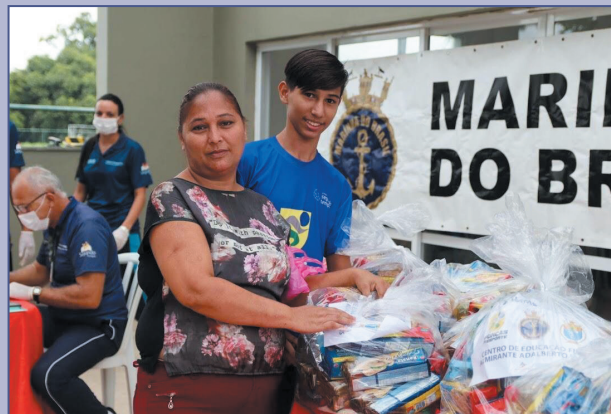
No CEFAN, 500 famílias receberam kits de alimentação