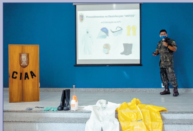
Instruções visam a tornar a desinfecção preventiva como tarefa rotineira no combate à Covid-19