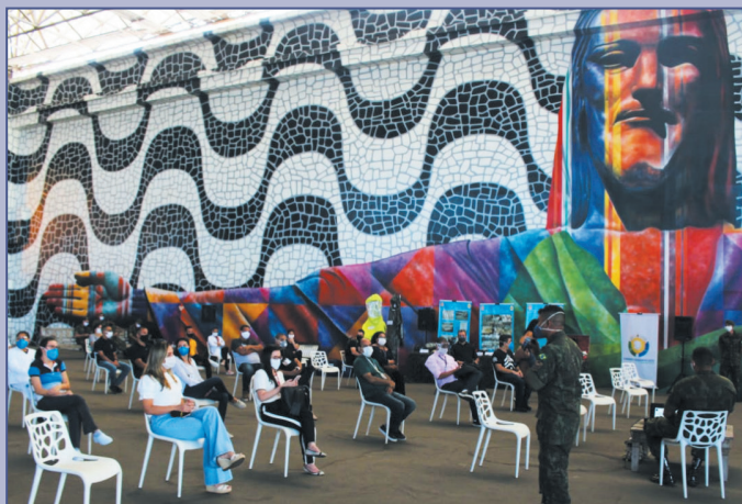
Profissionais de imprensa foram capacitados em ação realizada no Hospital de Campanha do RioCentro