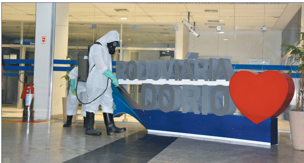
Rodoviária do Rio passou por ação de combate ao novo coronavírus no dia 23 abril, com desinfecção de locais de grande circulação de pessoas

Confira também, nesta edição especial, algumas das iniciativas que vêm sendo implementadas pela Marinha do Brasil e o Corpo de Fuzileiros Navais no combate à pandemia da Covid-19 em todo o território nacional