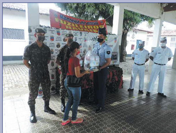
De 19 a 28 de maio, Grupamento de Fuzileiros Navais de Natal entregou kits de alimentação