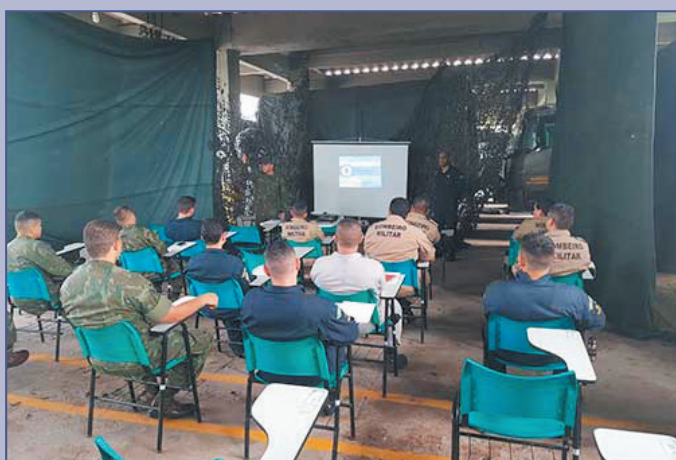
Desde o início da pandemia, 160 militares foram formados no Estágio Básico de Defesa NBQR, em Manaus