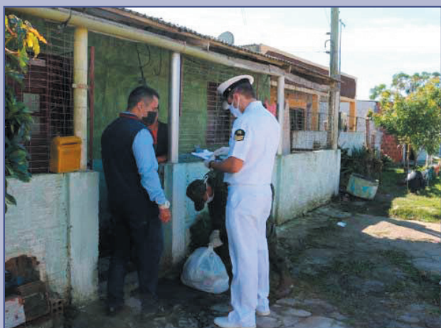
Em 8 de abril, Grupamento de Fuzileiros Navais do Rio Grande distribuiu 1.801 cestas básicas