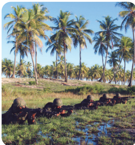
O Grupamento de Fuzileiros Navais de Salvador realizou o primeiro Adestramento de Equipes do ano, de 29 de março a 15 de abril, no litoral norte da Bahia