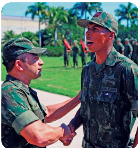
O CIAMPA promoveu, em abril, a entrega de barretas aos alunos do Curso de Formação de Soldados Fuzileiros Navais que mais se destacaram em seus respectivos pelotões