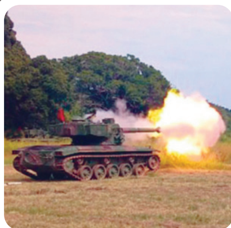
O Batalhão de Blindados de Fuzileiros Navais realizou exercício de tiro, entre os dias 30 de abril e 3 de maio, no Centro de Avaliações do Exército, na Restinga da Marambaia-RJ