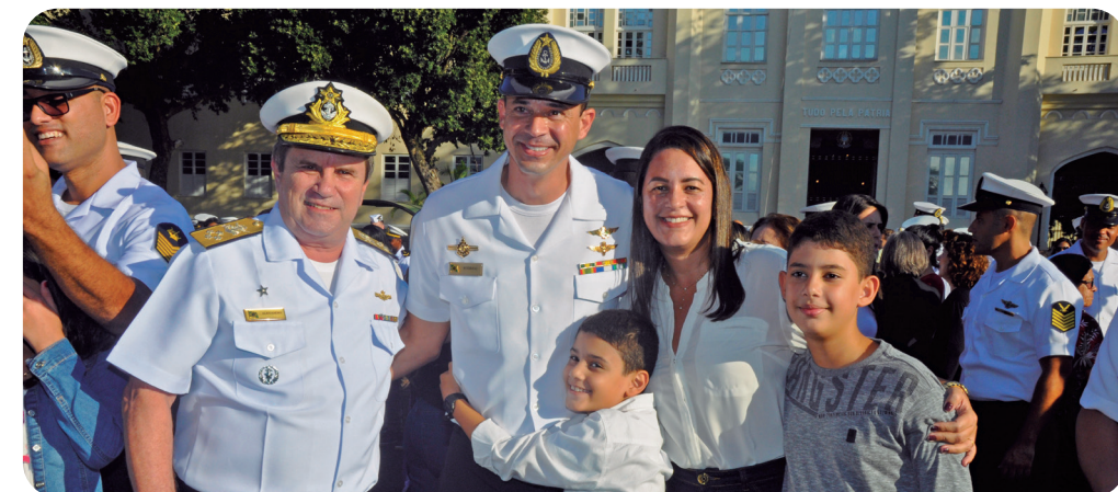
Cerimônia alusiva à Batalha Naval do Riachuelo reuniu Família Naval na Fortaleza de São José, em junho