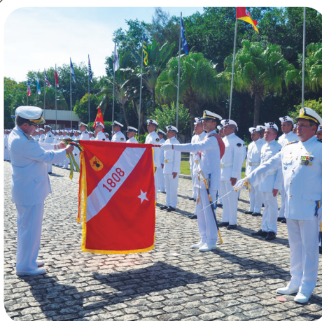
O Batalhão de Artilharia de Fuzileiros Navais foi agraciado com a Medalha Mérito Tamandaré, no dia 10 de maio