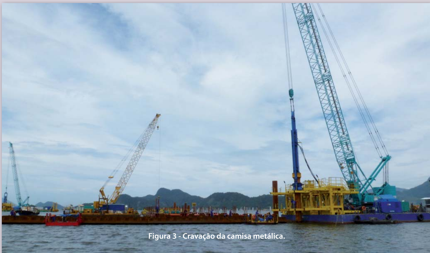
Figura 3 - Cravação da camisa metálica.

A locação das estacas no mar é realizada através do cruzamento dos alinhamentos a partir de dois pontos de coordenadas conhecidas. As estacas foram cravadas e ensaiadas mediante um sistema de cravação com acionamento hidráulico com martelo de 14 tf e altura máxima de queda de 150 cm (correspondente à energia potencial de 21,0 tf·m), conforme Figura 3. A tensão máxima de compressão não pode ultrapassar 80% da tensão de escoamento mesmo nas piores condições possíveis de cravação, a fim de evitar o amassamento da ponta da camisa.