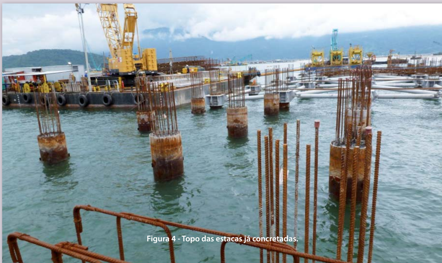
Figura 4 - Topo das estacas já concretadas.

O comprimento de cada estaca varia entre 30 e 52 metros e há no interior das camisas metálicas um preenchimento de concreto armado, somente até a profundidade necessária para resistir aos momentos fletores impostos. O concreto, introduzido através de funil após a dragagem do interior e colocação da armadura, possui f_{ck} \geq 40 MPa (Figura 4).