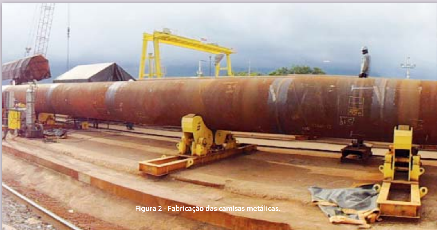
Figura 2 - Fabricação das camisas metálicas.

A locação das estacas no mar é realizada através do cruzamento dos alinhamentos a partir de dois pontos de coordenadas conhecidas. As estacas foram cravadas e ensaiadas mediante um sistema de cravação com acionamento hidráulico com martelo de 14 tf e altura máxima de queda de 150 cm (correspondente à energia potencial de 21,0 tf·m), conforme Figura 3. A tensão máxima de compressão não pode ultrapassar 80% da tensão de escoamento mesmo nas piores condições possíveis de cravação, a fim de evitar o amassamento da ponta da camisa.