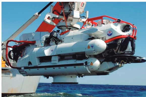
Figura 9: Sistema de Resgate Submarino da OTAN (NSRS)

Cabe ressaltar também que hoje há diversas marinhas com capacitação no resgate submarino, como Japão, Cingapura, China, Rússia, Coreia do Sul, Austrália, dentre outras, cujos meios estão disponíveis para consulta no site supracitado da ISMERLO.