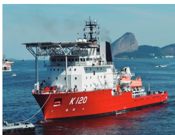
Figura 12: NSS GUILLOBEL.

A Marinha do Brasil (MB) recentemente adquiriu o NSS Guillobel (K-120), com capacidade de realizar mergulho profundo, fato este de fundamental importância, uma vez que, por possuir somente um VOR de observação, o mergulhador é o único instrumento de intervenção durante o resgate submarino, sendo responsável pelas ações supracitadas no parágrafo anterior. Em paralelo, a MB está envidando esforços para modernizar seu sistema de resgate submarino, composto por um sistema de lançamento ( launch and recovery system – LARS) e um sino de resgate de fabricação nacional com capacidade de resgate a 300 metros e inclinação máxima de 45 graus para acoplamento.