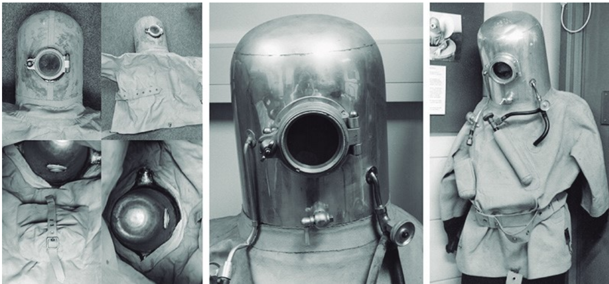
Figura 1: Hall-reess-Davi.

Inicialmente, os sistemas de escape tiveram como base os aparelhos respiratórios utilizados por mineradores de carvão, constituídos de um cartucho de cal sodada para absorção de dióxido de carbono, buscando filtrar o ar respirado. O primeiro equipamento desenvolvido foi o Hall-reess-Davis , em 1907, na Inglaterra. Era constituído de um capacete rígido que utilizava peróxido de sódio para filtrar o dióxido de carbono, porém, por ser volumoso, tornou-se inviável e foi abandonado.