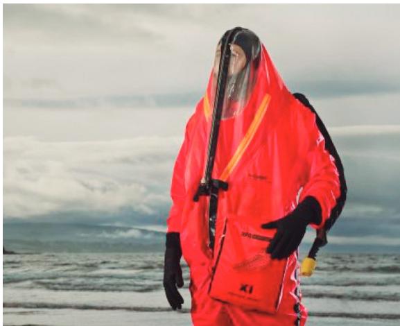
Figura 4: Submarine Escape Immersion Ensemble (SEIE) MK11.

O projeto mais recente de sistema de escape é a HABETA s (HDW, Amits, Bfa Escape Technology advanced SPES), que permite o escape a uma profundidade significativamente maior, cerca de 250 metros. Em maio de 2012, foram realizados ensaios ESCAPEX em mar aberto no HNLMS Zeeleeuw, nas águas norueguesas. Atualmente está sendo adaptado para os submarinos de diversas marinhas.