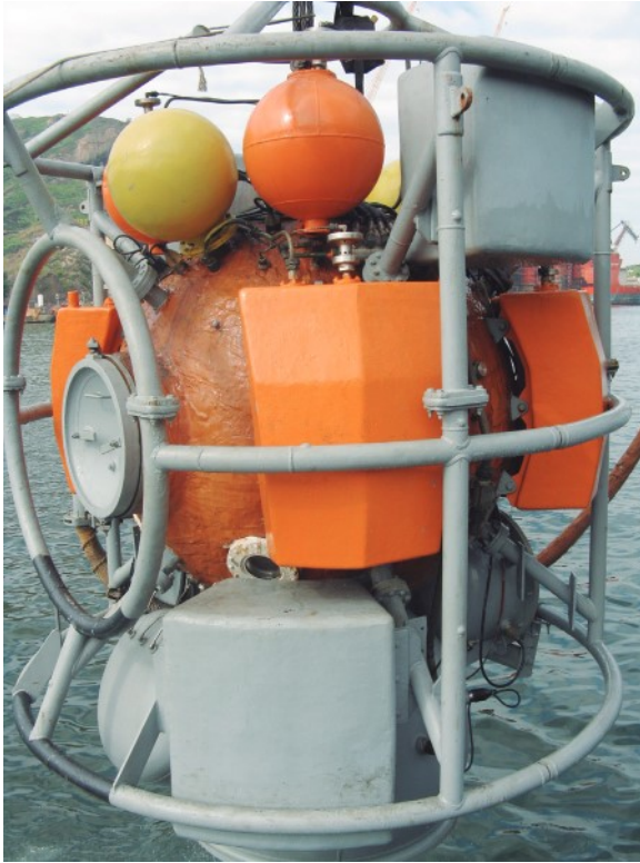
Figura 13: Sino de Resgate (SRS).

Por conseguinte, será retomada a capacidade operativa de realizar operações SARSUB e manter-se inserido no seleto grupo de países habilitados a conduzir e efetuar o resgate de uma tripulação de um DISSUB.