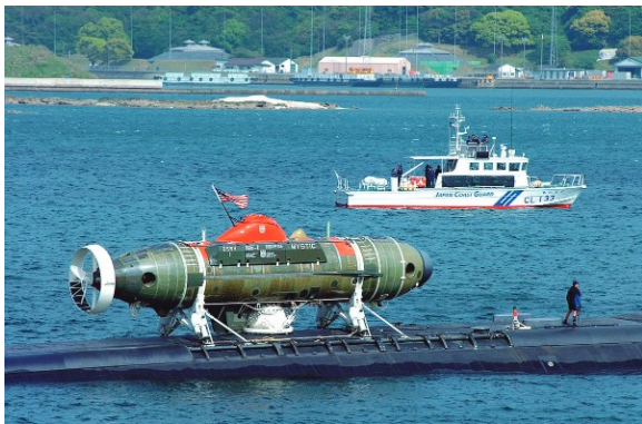
Figura 7: Deep Submerged Rescue Vehicle (DSRV) Mystic.

O sistema era aerotransportável e, com isso, enviado ao porto mais próximo do DISSUB. Em seguida, era transportado até a proximidade do submarino sinistrado por meio de um submarino-mãe americano ou aliado. Operá-lo a partir de um submarino-mãe significa que as condições do mar têm menor probabilidade de afetar as operações de resgate.