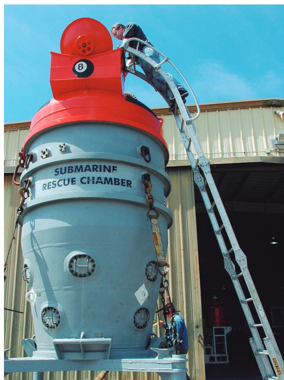
Figura 6: SRC McCann atual.

A doutrina do resgate submarino avançou ainda mais nos anos de 1960, após a perda de dois submarinos nucleares americanos, US Ships Thresher e Scorpion . Como consequência, sobreveio a criação do SubSafeProgram e, através dele, em 1970, foi iniciada a fabricação de dois submersíveis de socorro, os Deep Submerged Rescue Vehicle (DSRV) , nomeados de Avalon e o Mystic . Esses minissubmarinos tripulados se acoplavam na escotilha do DISSUB e podiam, cada um deles, transportar 24 pessoas por vez.