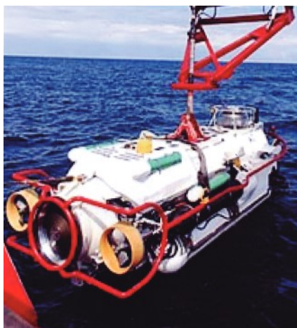
Figura 8: LR5 (SRV).

A exemplo da Marinha Americana, outras marinhas desenvolveram seus próprios sistemas de resgate portáteis. Em 1978, a Marinha Real passou a utilizar o veículo de resgate submarino LR-5(SRV), o qual é similar ao DSRV, que, no entanto, utilizava de um navio de oportunidade como navio-mãe. Além disso, incorporou a capacidade de tratamento hiperbárico, pois passou a permitir a pressurização interna, realizando em sequência o acoplamento ao sistema de transferência sob pressão ( transfer under pressure – TUP), para realização do tratamento necessário.