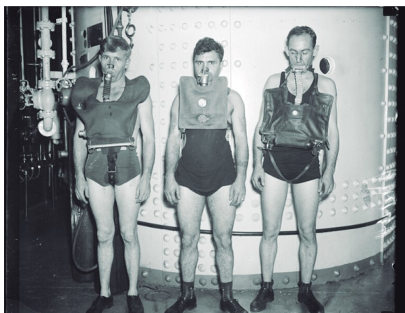
Figura 2: “Dräger Gegenlunge” (à esquerda), “Momsen Lung” (ao centro) e “Davis Submerged Escape Apparatus” (à direita).

Em 1911, na Alemanha, surgiu o pulmão Dräger , equipamento projetado com uma espécie de um pulmão externo, traqueias flexíveis, um pequeno cilindro de oxigênio e uma lata de cal sodada, o qual foi empregado no escape do submarino U3 neste mesmo ano. Em 1927, a Marinha Americana (USN) passou a utilizar o Momsen Lung , com consumo de oxigênio menor que o Dräger , e sua aplicabilidade estendeu-se até o ano de 1957. Já a Marinha Real Britânica (RN), em 1929, adotou o Aparelho de Escape Submarino Davis (DSEA).