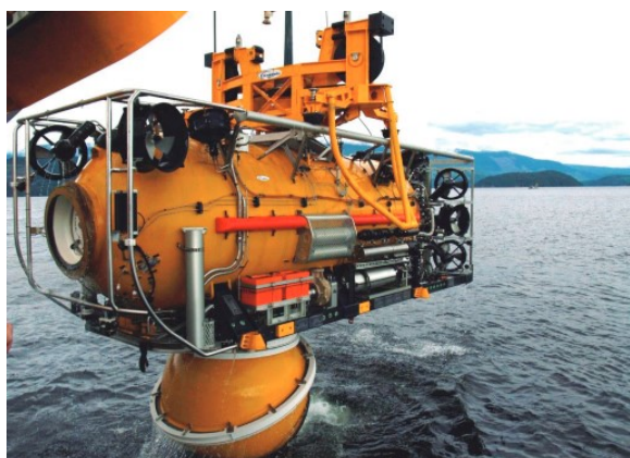
Figura 10: SRDRS FALCON.

Cabe ressaltar também que hoje há diversas marinhas com capacitação no resgate submarino, como Japão, Cingapura, China, Rússia, Coreia do Sul, Austrália, dentre outras, cujos meios estão disponíveis para consulta no site supracitado da ISMERLO.