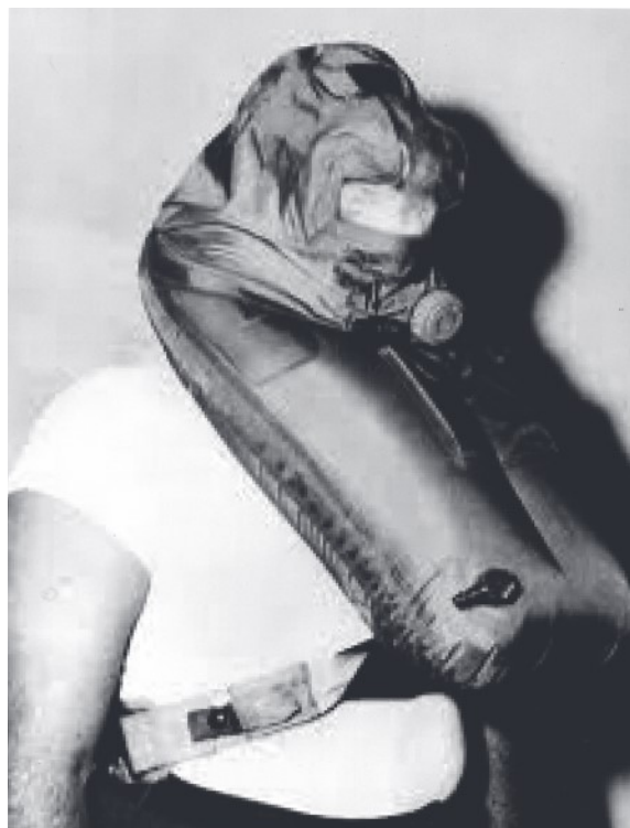
Figura 3: Steinke Hood.

Já no ano de 1962, o equipamento Steinke Hood foi implementado pela Marinha dos Estados Unidos. Este dispositivo consiste em um colete salva-vidas inflável com um capuz que envolve completamente a cabeça do usuário, prendendo uma bolha de ar respirável no seu interior. Durante a Guerra Fria foi empregado nos submarinos da USN.