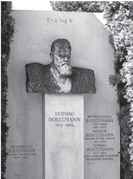
Sepultura no Cemitério Central de Viena

Tal esforço, estando ele já acima dos 60 anos, o levou à necessidade de reservar períodos de descanso e férias cada vez mais frequentes, o que, muitas vezes, acentuou seu sentimento de frustração. O último destes “repousos” teve lugar em