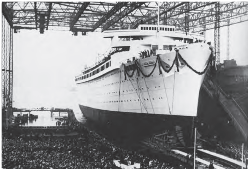
Lançamento do navio

O M/S Wilhelm Gustloff pôde realizar inúmeras viagens como navio de cruzeiro alemão, chamando atenção pelo seu tamanho, luxo e capacidade de realizar viagens em classe única para todos.