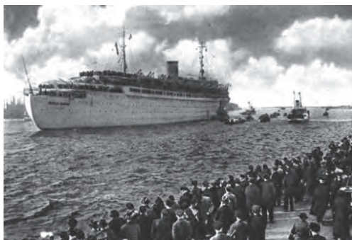
Embarcação deixando o porto