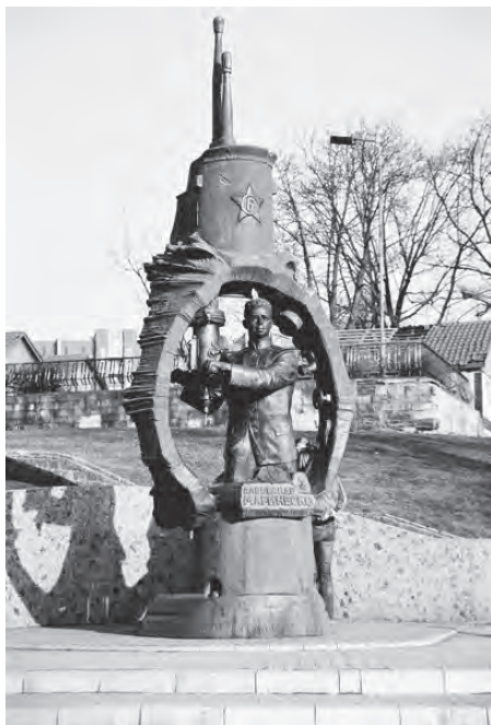
Monumento ao Comandante Marinesko erguido em Kaliningrado

Apesar da tragédia do Wilhelm Gustloff , a operação de remoção de refugiados, a Operação Hannibal, foi considerada um sucesso, pois se conseguiu transladar cerca de 2 milhões de cidadãos alemães para longe da ofensiva soviética.