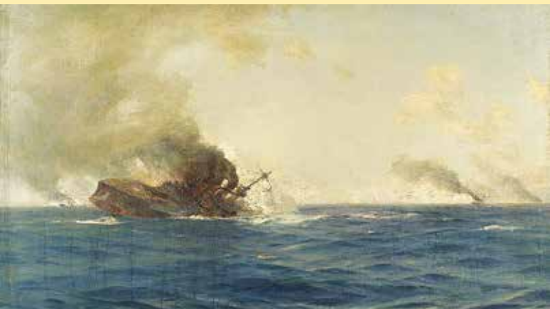
Figura 5 – Afundamento do Schanhorst – Batalha das Falklands – 8dez1914 – Thomas Jacques Somerscales (1842-1927)