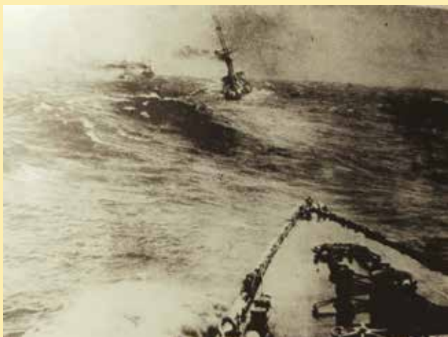
Figura 4 - Esquadrão do Almirante Spee cruzando o Pacífico - 1914

Em Juan Fernandes, última escala antes de chegar ao Chile, o Esquadrão Alemão da Ásia Oriental encerrou seu longo cruzeiro de guerra, de quatro meses e 18.000 milhas náuticas singrando as águas do Pacífico, em navegação tranquila, sem maiores problemas técnicos ou operativos, as belonaves bem abastecidas e com o moral das tripulações elevado. Mas sem qualquer contribuição para o esforço de guerra alemão no mar, com exceção apenas do CL Emden , destacado para ações no Índico, que se tornou o mais bem-sucedido corsário de superfície da Grande Guerra, com o afundamento de dezenove navios mercantes britânicos, um cruzador russo e um destróier francês, antes de ser afundado pelo CL Sydney , nas proximidades da ilha de Cocos, a noroeste da Austrália. (MASSIE, 2005, p.195).