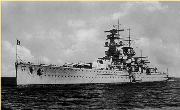
Figura 1 - Encouraçado Graf Spee

popa da imponente belonave que estava sendo lançada: Graf Spee (DICK, 2005, p.73).