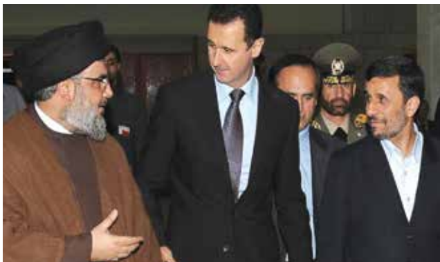
Figura 3: Da esquerda para direita: Hassan Nasrallah (líder do Hezbollah), Bashar al-Assad (presidente da Síria) e Mahmoud Ahmadinejad (ex-presidente do Irã).

tantes incidentes na fronteira com Israel, a presença dos campos de refugiados palestinos, a influência exercida por Síria e Irã e a existência de grupos armados, tais como: Fatah, Hamas e, principalmente, o Hezbollah, que hoje é um partido político oficializado e conta com a simpatia de grande parte da população.