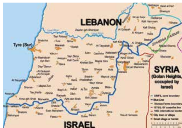
Figura 4: Rio Litani ao norte e Blue Line ao sul

desproporcional por grande parte da opinião pública, visto que as forças israelenses realizaram intensos bombardeios sobre o Líbano, causando a morte de inúmeros civis.