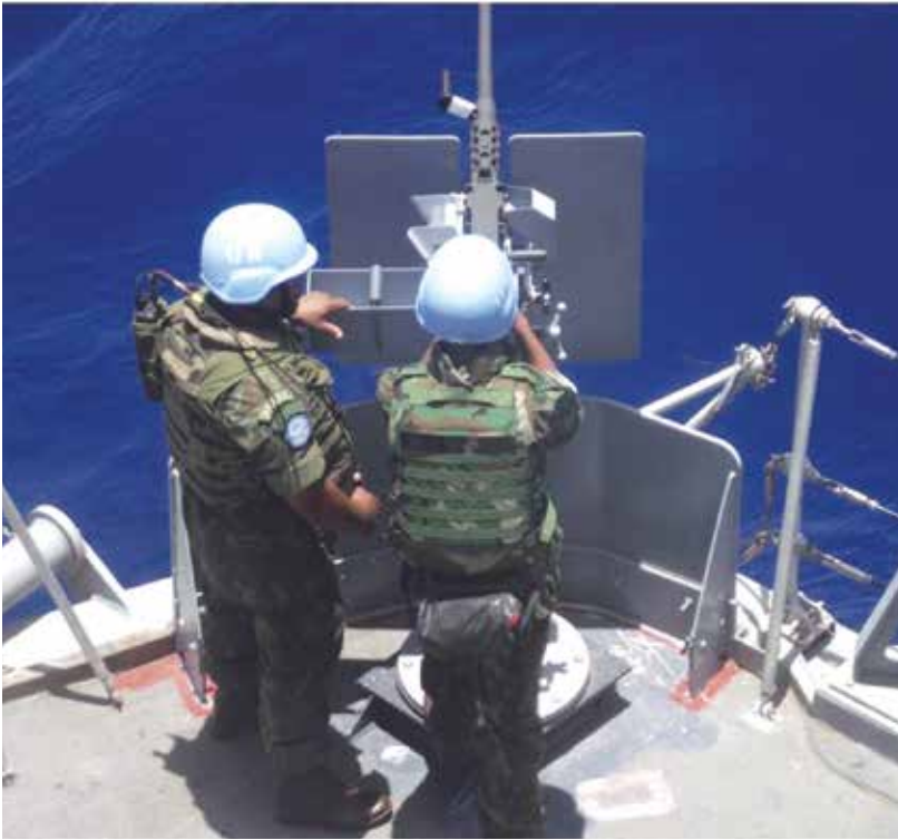
Figura 8: Operadores da Mtr 12,7 mm no “convés-chaff” Fonte: o autor (2012)

Quando em terra, o DstFN provia a escolta dos deslocamentos motorizados dos militares do Estado-Maior da FTM, principalmente nos itinerários compreendidos entre Beirute e Naqoura, cidade no sul do Líbano, onde se localiza o quartel-general do Force Commander .