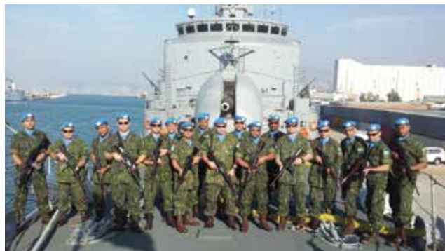
Figura 7: Destacamento de Fuzileiros Navais

Mocanguê, a preparação para o desempenho das tarefas do DstFN se desenvolveu do início do deslocamento para a Área de Operações até a incorporação da Fragata à FTM. Neste período, foram realizados exercícios de guarnecimento do GRAA, tiro com Mtr 12,7 mm, familiarização com a vida de bordo, principalmente com aspectos relacionados a procedimentos em caso de incêndio ou alagamento. Já em Beirute, ao longo de uma semana, foram ministradas aulas por oficiais do Estado-Maior da FTM, durante as quais eram apresentados dados de inteligência, composição da Força-Tarefa e procedimentos administrativos.