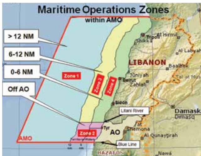
Figura 6: Área de Operações Marítimas

aqueles suspeitos de transportar armamento não autorizado. Quando no mar, a Fragata União assumia a função de MIO Commander , ficando responsável por compilar as informações dos navios mercantes presentes na AMO e, mediante a análise de determinados critérios, sugerir à Marinha libanesa ( Lebanon Armed Force Navy 6 - LAF Navy) que fosse realizada inspeção da carga das embarcações suspeitas. A FTM também possui a atribuição subsidiária de realizar adestramentos e exercícios em conjunto com embarcações da LAF-Navy.