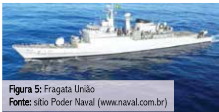
Figura 5: Fragata União

rotina diária consiste basicamente na interrogação dos navios mercantes que apresentam intenção de demandar os portos libaneses, a fim de indentificar