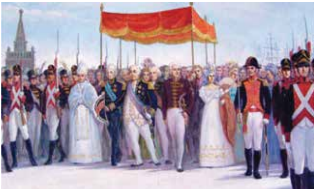
Figura 1: Brigada Real da Marinha na chegada da Família Real no Brasil

Semelhante às atividades realizadas por aqueles combatentes anfíbios de outrora, um Destacamento de Fuzileiros Navais embarcou na Fragata União, primeiro navio da Marinha do Brasil incorporado à Força-Tarefa Marítima da United Nations Interim Force in Lebanon 1 (UNIFIL). Com tarefas que confirmam as vocações consolidadas ao longo de nossa história, o CFN contribuiu de modo bastante pertinente não só de acordo com o preconizado em sua doutrina, mas também como meio de confirmar seu status de parcela intrínseca e indissociável do Poder Naval.