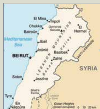
Figura 2: Principais características do Líbano