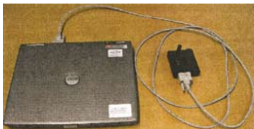
Notebook, Cabo USB TO RS-232, e antena WLN-ADAPTER II 915MHZ.

Por meio de um arquivo instalado no computador e a antena WLN, é possível realizar o registro dos militares que participaram do adestramento e, logo após, baixar todos os dados armazenados na PCU dos coletes utilizados pelos militares. Finalmente, gera-se o relatório dos eventos realizados, seja de um militar ou de uma fração de tropa.