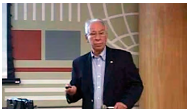
Almirante Elcio ministrando palestra sobre Transferência de Tecnologia no Clube de Engenharia (Clube de Engenharia, 2016)