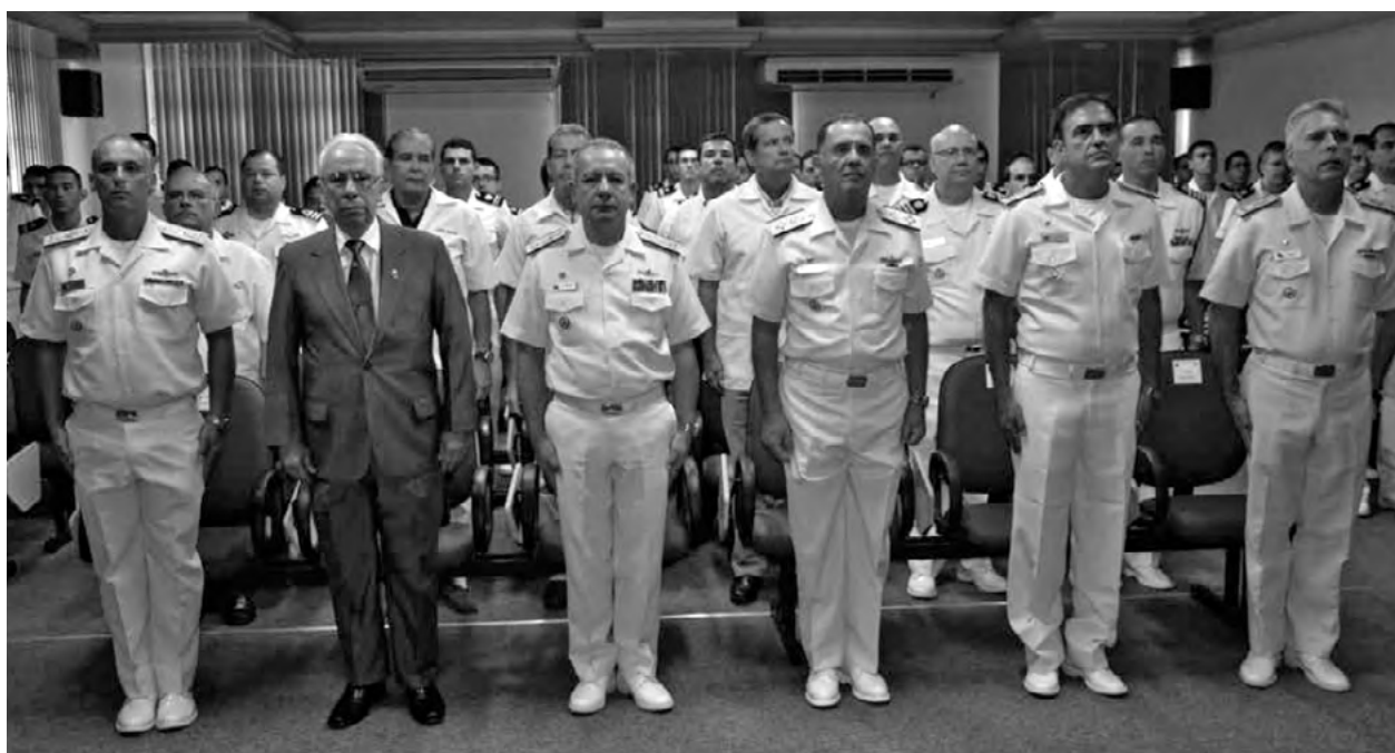
Aula inaugural no CIAW aos alunos do Curso de Formação de Oficiais (Freitas, 2017)

• Endoutrinação e Mudança de Mentalidade – Ele alertou para a necessidade de formação doutrinária contínua. A mentalidade da Marinha teria, segundo ele, que adotar e priorizar a cultura do projeto e da construção naval próprios, onde o esforço para a defesa disso “[...] será útil somente se for mais uma