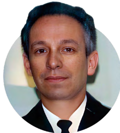
Vice-Almirante (EN) Elcio de Sá Freitas (Freitas, 2014)