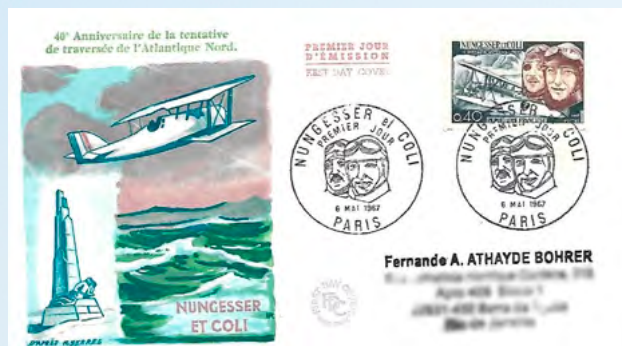
Homenagem aos quarenta anos das mortes de Nungesser e Coli

Nungesser e Coli desapareceram no Atlântico Norte durante a tentativa de travessia aérea de Paris a Nova Iorque, sem escalas, em 28 de maio de 1927, a bordo do avião “L’Oiseau Blanc”.