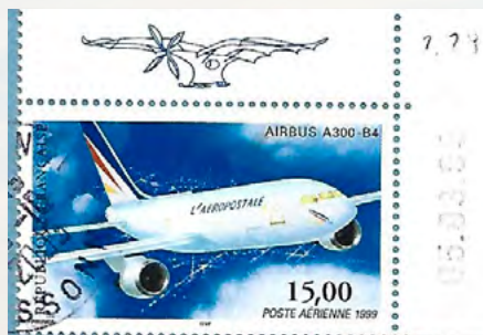
Airbus A300 B4