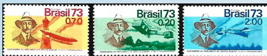
Alberto Santos Dumont e seus engenhos aeronáuticos

É dentro desse contexto que desejo apresentar aos leitores a evolução exitosa da aviação francesa, seus pioneiros, seus primeiros aviões e suas conquistas nesse universo maravilhoso da aeronáutica.