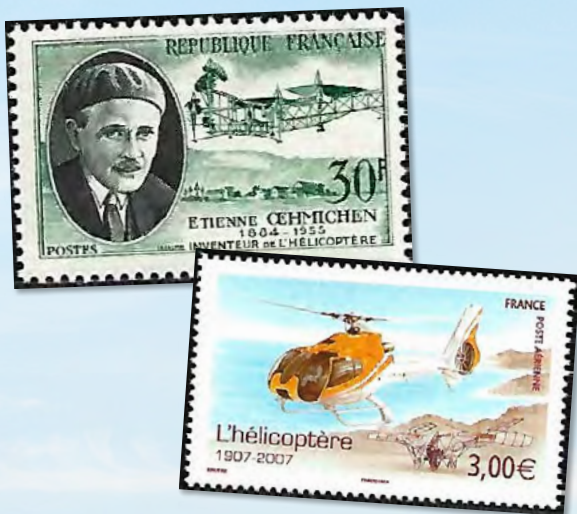
Étienne Oehmichen e sua invenção, o helicóptero

A antiga Aérospatiale, localizada na cidade de Marignane, no sul da França (ao lado do Aeroporto Marseille-Provence), foi o grande centro construtor dos helicópteros franceses.