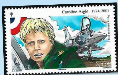
Caroline Aigle e a aeronave Dassault Mirage 2.000

Caroline Aigle, em 25 de maio de 1999, recebeu seu brevet de piloto de caça voando em uma aeronave “Alpha Jet”, na Base Aérienne 115, em Tours, sendo a primeira mulher a ser efetivada em um esquadrão de combate da Armée de l’Air francesa. No ano 2000, na Base Aérienne 105, em Orange, qualificou-se no Mirage 2.000 e, em 2005, tornou-se comandante de esquadrilha (Esquadrilha SPA 77 Mouette). Faleceu em 2007, na cidade de Dijon, acometida por um câncer.