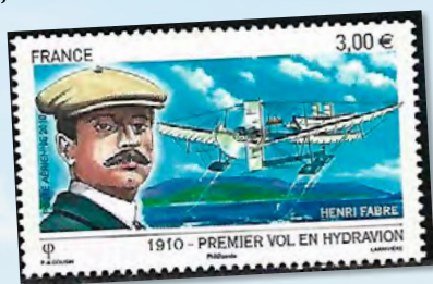
Henri Fabre e seu hidroavião “Canard”

Henri Fabre, engenheiro e aviador francês, foi o primeiro aviador a pilotar um hidroavião, invenção sua, em 28 de março de 1910, o “Canard”, decolando do Etang de Berre , Martigues, no sul da França.