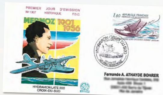
Jean Mermoz e seu hidroavião “Laté 300” “Croix du Sud”