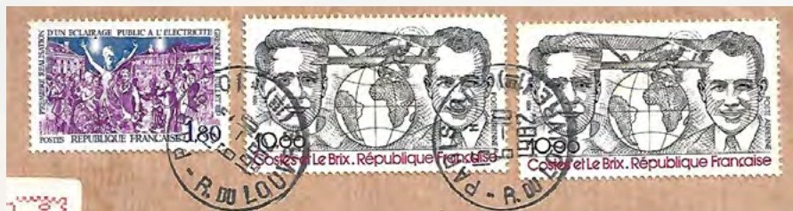
Costes e Le Brix

zar os Andes por três vezes). Depois, via Caracas, Panamá, Guatemala e México, chegaram a Nova Iorque. Após, cruzaram os Estados Unidos até São Francisco, embarcaram o pequeno avião em um navio a vapor que os transportou até Yokohama, no Japão, quando retornaram o voo seguindo a rota de Tóquio até Paris, fazendo escalas na Indochina francesa, Índia, Síria francesa e Grécia, antes de sua chegada no aeroporto Paris-Le Bourget, em 14 de abril de 1928.