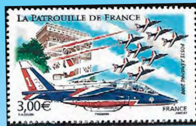
Patrouille de France

a École Militaire d'Étampes-Mondesir formou dois mil pilotos. Em 1927, Bouillux-Lafond criou a Aéropostale e, em 1932 foi criada a esquadrilha de demonstração aérea, Patrouille d'Étampes , a precursora da Patrouille de France , da Armée de l'Air francesa, hoje sediada na cidade de Salon-de-Provence, no sul da França.