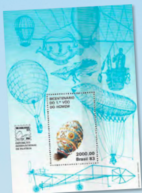
O balão dos irmãos franceses Montgolfier

Os irmãos Joseph-Michel e Jacques-Étienne Montgolfier, na cidade de Annonay, construíram o primeiro balão tripulado do mundo e, em 4 de julho de 1763, Joseph-Michel realizou seu primeiro voo.