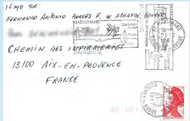
Correspondência postada na cidade de Marignane, com carimbo alusivo ao Centro de Construção Aeronáutica ("MARIGNANE – Carrefour Aérien")