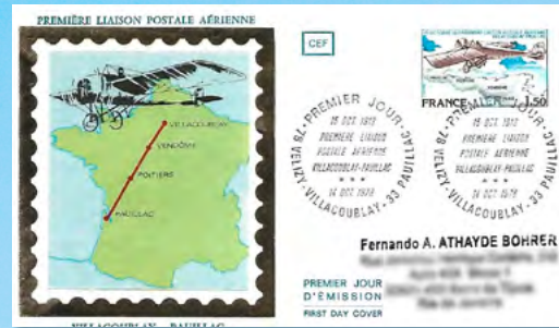
A ligação aérea Villacoublay-Pauillac foi realizada em 15 de outubro de 1913