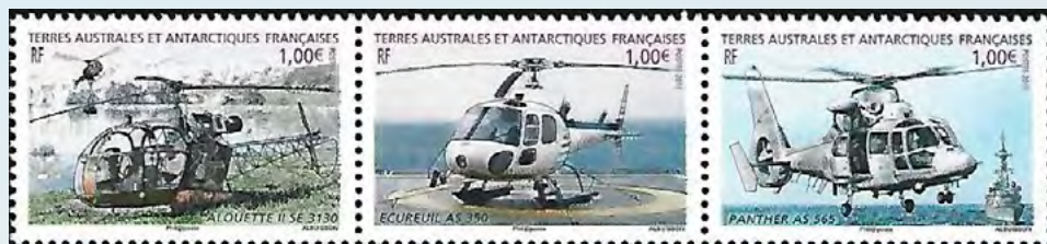
Helicópteros franceses da Aérospatiale: Alouette, Écureil e Panther