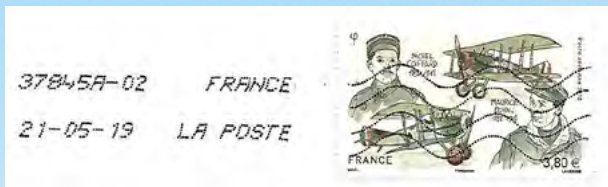
Coffard e Boyau

Maurice Boyau recebeu seu brevet de piloto militar em 28 de novembro de 1915, tendo se especializado na caça aos balões de observação alemães. Em 16 de setembro de 1918 foi abatido pela artilharia de defesa aérea alemã, em um de seus ataques aos balões alemães.