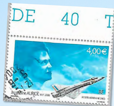
Jaqueline Auriol e a aeronave “Dassault Mirage IIIC”

Jaqueline Auriol foi uma aviadora francesa, piloto de provas e que estabeleceu vários recordes mundiais de velocidade. Em 1950 obteve sua licença de piloto militar. Em 22 de junho de 1962, voando um avião “Dassault Mirage IIIC”, atingiu velocidade média, ratificada pela Fédération de l’Aéronautique Internationale (FAI), de 1.850,2km/h.