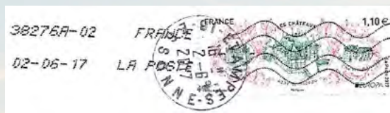
Fragmento de correspondência postada na cidade de Étampes, em 2017

Em março de 1910 foi fundada a École de Pilotage de Henri Farman e, em setembro, a École de Pilotage de Louis Blériot. Em 1914,