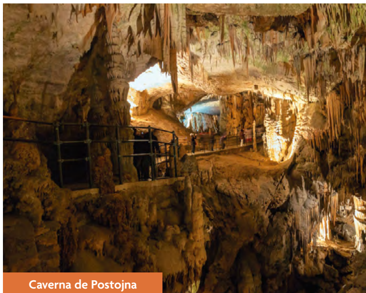
Caverna de Postojna

e mais conhecida e visitada, a Caverna de Postojna – aberta de junho a agosto. Fica localizada a cinquenta minutos da capital, na região conhecida pelas formações de cavernas. É possível contratar nos hotéis um tour para visitá-la, o que pode ser combinado com a visita ao Castelo de Predjama, aberto à visita o ano todo, que foi construído em uma enorme fenda da montanha, localizada próximo da caverna. Sai mais barato pagar pelas duas atrações e a compra dos bilhetes para ambas pode ser feita no local da entrada da caverna, que contempla um restaurante/café e algumas lojas de souvenirs, onde normalmente se aguarda a hora marcada para visitá-la.