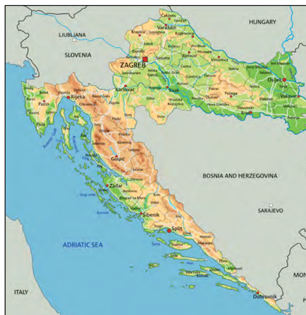
Mapa da Croácia com destaque para suas principais cidades e fronteiras com países vizinhos. Ao norte, a Eslovênia.

flitos bélicos foram travados motivados por problemas até hoje existentes de segregação étnica e religiosa. Muitas cidades foram bombardeadas e tiveram de ser reconstruídas, como exemplos, Dubrovnik na Croácia e Sarajevo na Bósnia e Herzegovina. Muitos anos depois, os países se restabeleceram e abriram suas fronteiras para o turismo.