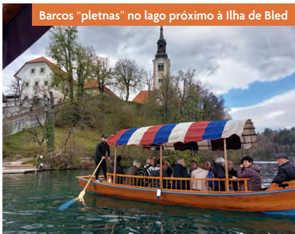
Barcos “pletnas” no lago próximo à Ilha de Bled

O passeio inicia-se em um pequeno trem de onde, após penetrar por muitos metros, é necessário desembarcar e prosseguir a pé para conhecer os diversos salões da caverna onde se deslumbra uma enorme quantidade de estalactites, estalagmites e colunas, muitas delas com iluminações coloridas e bem posicionadas para dar um toque de maior esplendor à visita. São quilômetros de extensão, mas somente pode-se adentrar em uma pequena parte dela. É um passeio que vale a pena.