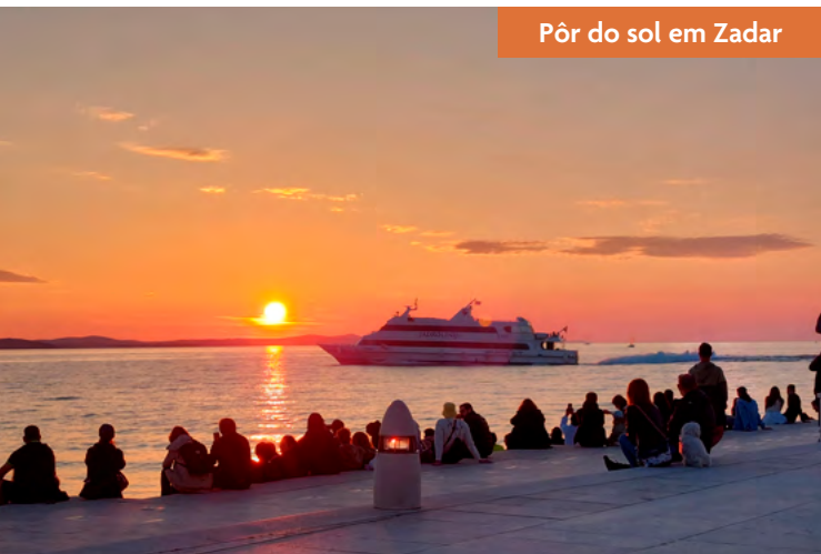
Pôr do sol em Zadar

Quem chega à cidade pelo mar, a bordo de um cruzeiro marítimo, tem como cartão de visita ce-