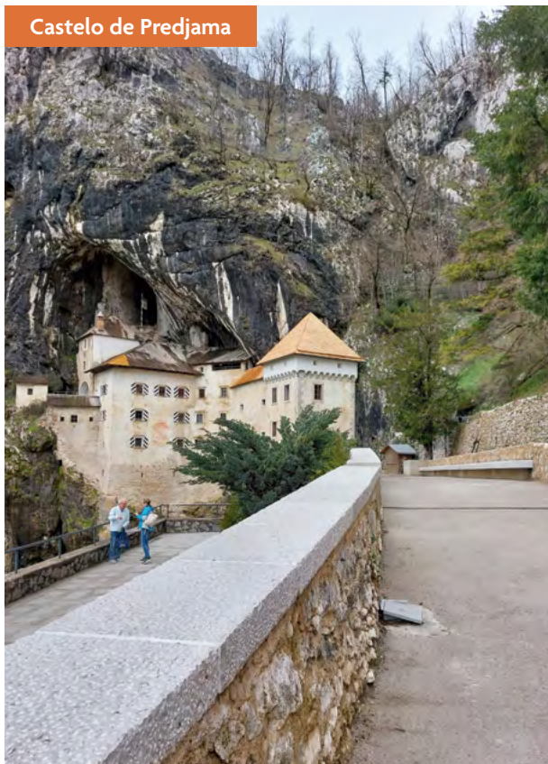
Castelo de Predjama

O passeio inicia-se em um pequeno trem de onde, após penetrar por muitos metros, é necessário desembarcar e prosseguir a pé para conhecer os diversos salões da caverna onde se deslumbra uma enorme quantidade de estalactites, estalagmites e colunas, muitas delas com iluminações coloridas e bem posicionadas para dar um toque de maior esplendor à visita. São quilômetros de extensão, mas somente pode-se adentrar em uma pequena parte dela. É um passeio que vale a pena.