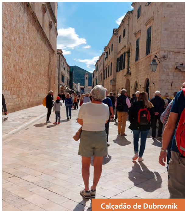
Calçadão de Dubrovnik

A entrada em Old Town se faz por meio de um pórtico de pedra – o Portão Pile – que permeia a muralha que a circunda. A primeira imagem ao se entrar é o calçadão de pedestres (chamado de “Placa”) recheado de lojas e de pequenos bares e restaurantes, que se estendem por cerca de 280m até a torre do relógio, localizada ao lado do Palá-