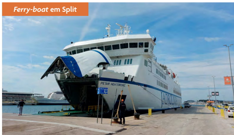
Ferry-boat em Split

deiras cobertas e protegidas de um sol acalentador acompanhado pela brisa marinha.