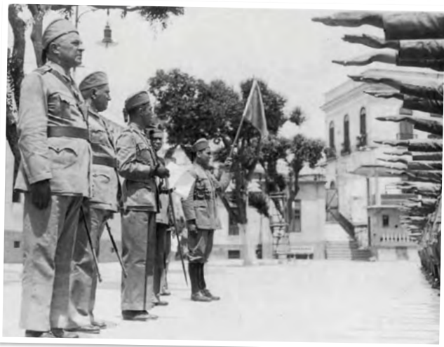
Cerimônia na Ilha das Cobras em 1934