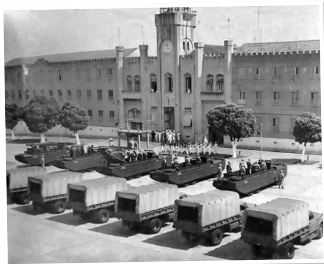
O Caminhão Anfíbio (CamAnf) foi adquirido pelo Comando dos Fuzileiros Navais na década de 1970