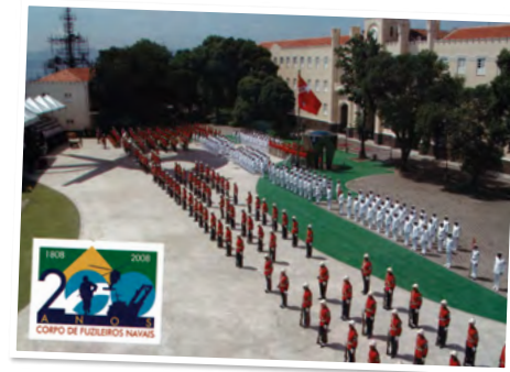
Bicentênio do Corpo de Fuzileiros Navais (2008)

camentos de outros países (Honduras, Paraguai, Nicarágua, Costa Rica e El Salvador), constituiu o Batalhão Fraternidade.