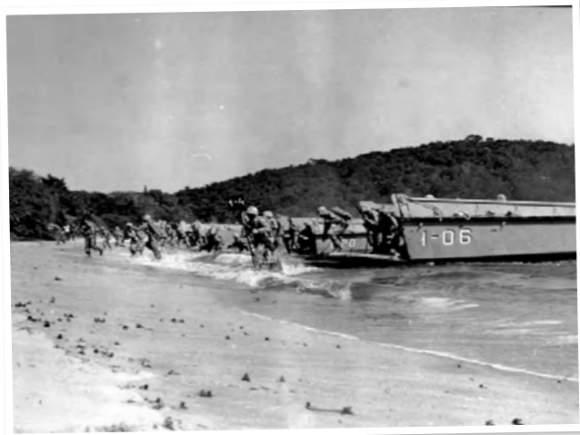
Operação Dragão I (1964)

A partir de 1964 foram iniciados os grandes exercícios anuais de operações de desembarque, com os três batalhões de infantaria e seus componentes de artilharia, de engenharia e de logística, como manutenção e outros. Os locais foram praias nos estados de Espírito Santo, Santa Catarina e Bahia.