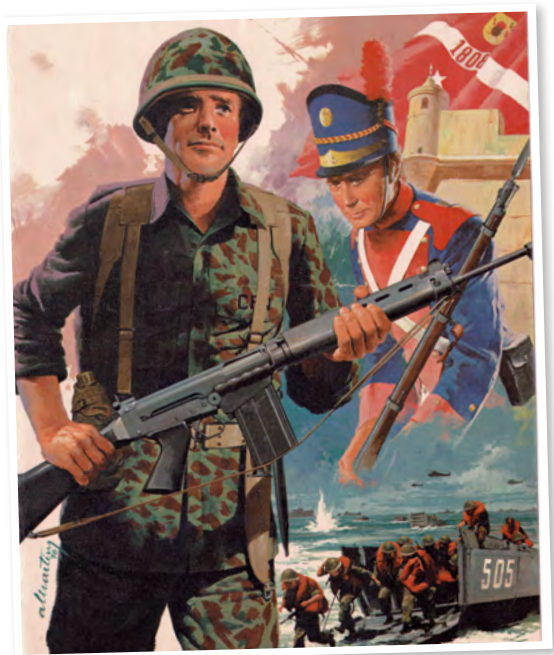
Imagem: capa da edição especial da Revista O Anfíbio (MAR1981)