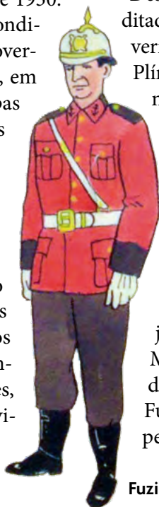
Fuzileiro Naval em 1934

Desde novembro de 1937, o País vivia sob a ditadura do Estado Novo, com Vargas no governo. O Partido Integralista, presidido por Plínio Salgado, fez sua primeira intervenção na Escola Naval. Na noite de 10 de março de 1938, cinco militares integralistas da Escola roubaram quatro cunhetes de munição e quarenta fuzis. Foram presos depois. Outra ação foi na residência oficial do Presidente da República, onde um fuzileiro naval da guarda foi morto e outros foram feridos. Com reforços, os policiais afastaram os revoltosos. Em outra jornada, os revoltosos tomaram o prédio do Ministério da Marinha, matando um soldado fuzileiro naval. O comando do Corpo de Fuzileiros Navais (CFN), com armamento pesado, recuperou o prédio do Ministério.