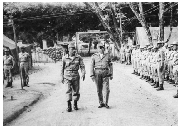
O General Panasco Alvim e o então Capitão de Corveta (FN) Fernando do Nascimento em revista ao II GptOpFuzNav

As ações da FIP e, portanto, do II grupamento de FN foram ligeiramente diferentes das realizadas na primeira fase. Foram voltadas para a ocupação de Ciudad Nueva e, conforme abordado, com a manutenção da ordem pública, ensejadas pelo estabelecimento de pontos de controle em locais críticos