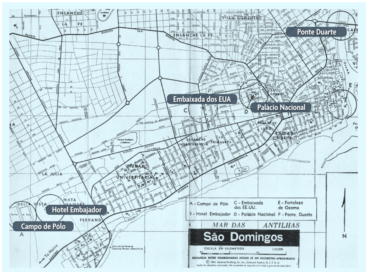
Mapa de São Domingos

Em resumo, o então Núcleo da 1ª Divisão de Fuzileiros Navais (Nu1ªDivFuzNav) expediu, respectivamente, em 7 e 16 de maio, a Diretiva de Planejamento (secreto) e a Ordem Preparatória da Operação Renascimento (secreto), visando aos preparativos e divulgando informações atualizadas sobre a RD. Determinou o início dos traba-