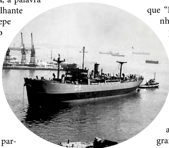
Navio Tanque “Ilha Grande”

que “Ilha Grande”, que a Marinha havia enviado a Toulon para ser modernizado em um estaleiro privado.