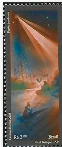
Farol de Bailique

Está situado no arquipélago do Bailique, Distrito de Macapá, no estado do Amapá, um conjunto de oito ilhas na foz do Rio Amazonas. A Estação de Bailique foi estabelecida em 1890. Tradicionalmente esses faróis em áreas remotas têm torres metálicas de treliça, adequadas ao terreno difícil e à logística de acesso limitado. Está dotado de lanternas eletrônicas modernas com alcance suficiente para trafegar com segurança na área estuarina.