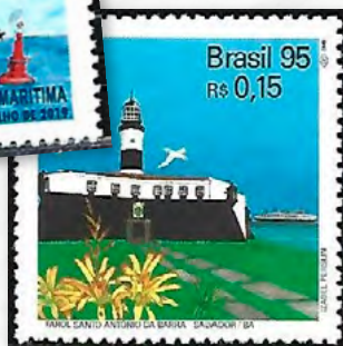
Farol de Santo Antonio da Barra