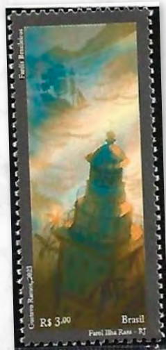
Farol da Ilha Rasa

Projetado pelos franceses Barbier Bernard e Turenne, localizado no cabo de Santa Marta, Laguna, no estado de Santa Catarina, no cume de um morro a 29 metros acima do nível do mar, com altitude de foco de 74 metros e um alcance geográfico de 22 milhas náuticas, tendo sido inaugurado em 11 de junho de 1891.