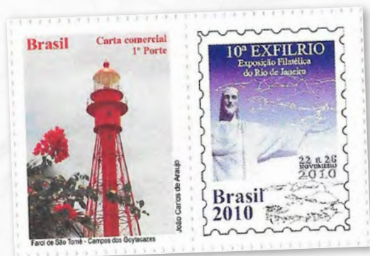
Farol do Cabo de São Tomé

Inaugurado há mais de 132 anos em Campo dos Goytacazes, no norte do estado do Rio de Janeiro. Construído por uma firma francesa, no ano de 1877, foi inaugurado em 29 de julho de 1882. Como curiosidade, anos mais tarde a mesma firma construiu a Torre Eiffel, em Paris.