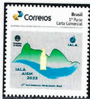
Farol da Ilha Rasa

Localizado na Ilha Rasa, a cerca de 10 quilômetros da barra da Baía de Guanabara, no Rio de Janeiro. Possui uma torre cilíndrica no cimo de uma torre quadrangular de três andares, com lanterna e galeria de 26 metros de altura. Tem em funcionamento uma das duas únicas lentes meso-radiantes de Fresnel da casa Barbier & Bernard (BBT), que se conhece terem sido fabricadas. A outra encontra-se no Farol de Abrolhos, no estado da Bahia, com um alcance de 51 milhas náuticas para a cor branca e de 45 milhas náuticas para a cor vermelha. É conjuntamente com o Farol da Ilha de Abrolhos, o farol marítimo mais potente do mundo, só sendo ultrapassado em alcance, pelo farol aéreo de Tetuan (aeroporto de Sania Ranel) no Marrocos, com 54 milhas náuticas de alcance.