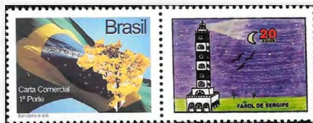
Farol de Sergipe

Localizado na Praia da Coroa do Meio, na cidade de Aracaju, no estado de Sergipe, foi obra da Construtora Celi. A torre de concreto, com 40 metros de altura, foi inaugurada em 12 de julho de 1991.