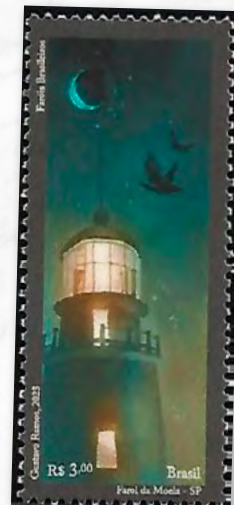
Farol da Moela

A Ilha da Moela, território insular costeiro, situado no município do Guarujá, São Paulo, a 2,5 quilômetros da costa, abriga o mais antigo farol do litoral paulista, inaugurado em 1830 e que conta com uma torre de 10 metros de altura. O farol possui uma visibilidade de até 50 quilômetros e foi um dos primeiros construídos no litoral paulista.