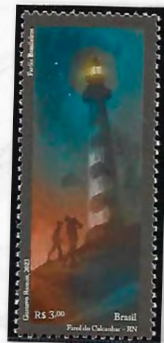
Farol de Touros

Com 62 metros de altura e 298 graus, é o segundo maior do Brasil. O primeiro farol nesse local foi construído e inaugurado em 1912. Em 1937, é construído um segundo farol, aeromarítimo; e o farol atual foi inaugurado em 10 de novembro de 1943, tendo sido a construção iniciada na gestão do Vice-Almirante Tácito Reis de Moraes Rego e concluída na do Contra-Almirante Jorge Dodsworth Martins, ambos Diretores-Gerais de Navegação (DGN).