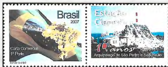
Farol de São Pedro e São Paulo