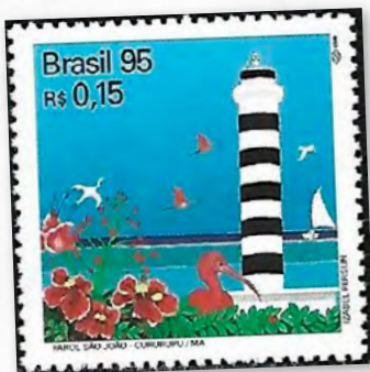
Farol de São João