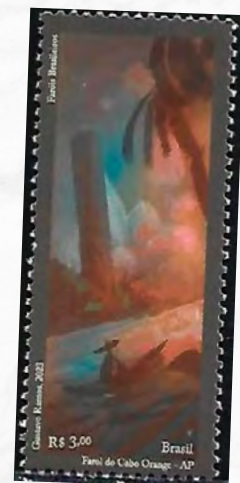
Farol do Cabo Orange