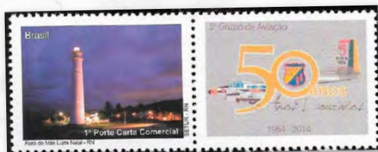
Farol de Natal