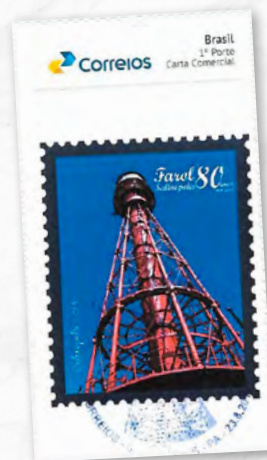
Farol de Salinópolis

Está situado no município de Salinópolis, na região da Praia do Atalaia, no estado do Pará. Com uma estrutura metálica, diferente de faróis históricos monumentais, ele é mais funcional do que turístico, mas acaba compondo a paisagem da Praia do Atalaia.