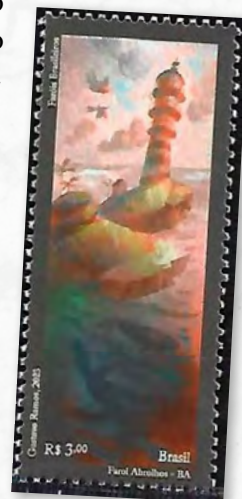
Farol de Abrolhos

Localizado no cume da Ilha de Santa Bárbara, a maior ilha do arquipélago de Abrolhos, no litoral do Estado da Bahia. É composto de uma torre cilíndrica em ferro fundido, com dupla galeria e 22 metros de altura, tendo sido pré-fabricada na França. Tem em funcionamento, uma das duas únicas lentes meso-radiantes de Fresnel da casa Barbier & Bernard (BBT), que se conhece terem sido fabricadas. A outra encontra-se no Farol da Ilha Rasa, no Estado do Rio de Janeiro. Possui um alcance geográfico de 19 milhas náuticas e alcance luminoso de 51 milhas náuticas.