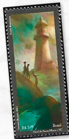
Farol de Santa Marta