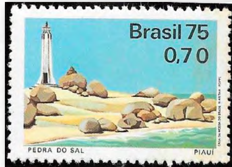
Farol da Pedra do Sal