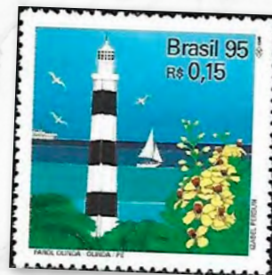
Farol de Olinda