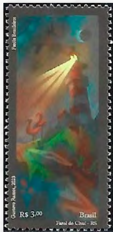
Farol da Barra do Chuí