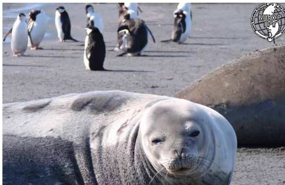
Foca-caranguejeira ( Leptonychotes weddelli ) descansando nas praias da Ilha Elefante, Shetlands do Sul

que, por sua vez, alimentam modelos de previsão climática. As atividades descritas acima representam um esforço conjunto de cientistas de vários países do mundo durante a última década que culminou com o Projeto Marine Mammals Exploring the Oceans Pole to Pole (MEOP), durante o 4º Ano Polar Internacional. Foi uma iniciativa pioneira e notável contribuição que conseguimos obter com a ajuda dos animais, tornando-se um exemplo de atividade que foi posteriormente inserida como área de ação e atuação no Sistema de Observação do Oceano Austral - Southern Ocean Observing System (SOOS). Portanto, a ideia de utilização de mamíferos marinhos como plataformas de monitoramento ambiental está consolidada, e cabe a nós, dar continuidade a esta nova maneira de se fazer ciência.