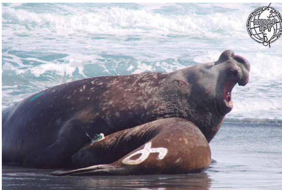
Casal de elefantes-marinhos do sul, incluindo fêmea recém-instrumentada com rastreador satelital - SRDL na Ilha Elefante, Shetlands do Sul já de partida para iniciar o período de alimentação pelágica (forrageio) no Oceano Austral.

lhoria significativa no tipo de informação que podemos obter, principalmente em períodos críticos como durante o inverno. O monitoramento desses animais aporta informações novas que despertam uma conscientização generalizada em termos científicos sobre a necessidade de trabalhar em grupo de forma complementar e multidisciplinar. Cabe ressaltar, entretanto, que estes dados precisam ser validados e complementados por plataformas de coleta de dados tradicionais (navios e boias). Essa tarefa é fundamental para possibilitar que os dados coletados, tanto por esses animais, atuando como monitores e avaliadores de ambiente, quanto por métodos tradicionais, contribuam significativamente para o aprimoramento de modelos climáticos.