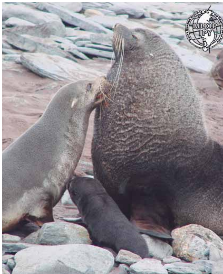
Grupo de lobos-marinhos antárticos (Arctocephalus gazella) Ilha Elefante, Shetlands do Sul) partindo para iniciar o período de alimentação pelágica (forrageio) no Oceano Austral.

As características físico-químicas do ambiente polar amostradas a partir de mamíferos marinhos foram descritas e utilizadas para integrar modelos para determinar a estrutura e o funcionamento do ambiente, num período determinado, durante o qual informações adicionais obtidas por técnicas tradicionais foram, também, coletadas, ainda que somente no verão. Uma experiência interessante ocorreu quando dois animais que rastreamos, instrumentados na Ilha Elefante, estavam passando pelas proximidades da Plataforma de Wilkins, quando houve ruptura de parte dessa estrutura. Dados coletados por estes animais (e outros animais do Projeto MEOP) mostraram o que ocorreu com a coluna d'água no momento da quebra da plataforma, bem como momentos antes e depois. Foi uma casualidade impossível de ser prevista ou programada, mas evidencia a grande vantagem de utilizarmos animais para esse tipo de pesquisa. É fundamental, por exemplo, utilizar a informação que os predadores-topo estão coletando para compreendermos melhor essa dinâmica durante períodos em que observações tradicionais não estão disponíveis, como no inverno.