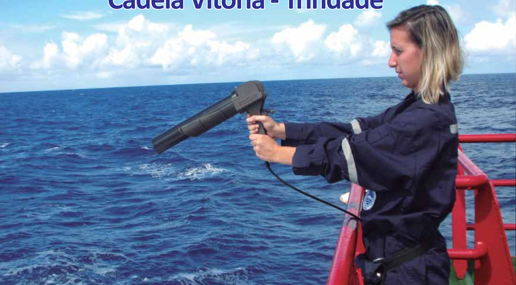
Lançamentos a bordo do Navio Polar Almirante Maximiano