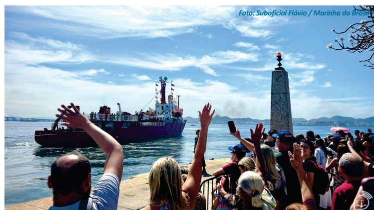
Despedida do Navio de Apoio Oceanográfico "Ary Rongel" do Rio de Janeiro.